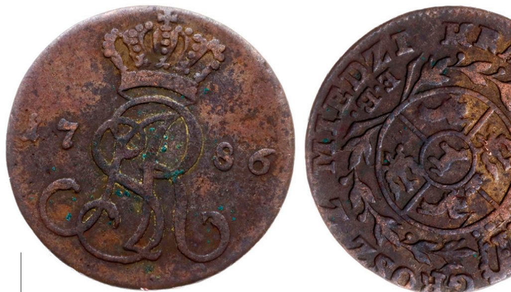
1 grosz z miedzi krajowej (z Miedzianej Góry) z roku 1786 wybity w Mennicy Warszawskiej

Stefan Żeromski wymarzył sobie higieniczne, czyste i pełne światła szklane domy. My dziś możemy puścić wodze fantazji i wyobrazić sobie, jak w Miedzianej Górze zaczyna panować architektoniczna spójność, a miedź staje się