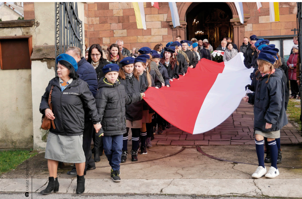
Drużyna harcerska im. Szarych Szeregów na uroczystość obchodów 101. rocznicy odzyskania niepodległości przygotowała biało-czerwony korowód