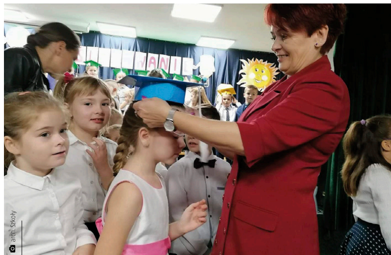
Uroczystość pasowania na pierwszoklasistów w Szkole Podstawowej w Kostomłotach Drugich

W Szkole Podstawowej w Kostomłotach Drugich uroczystość zaślubiono 63 uczniom. Sukcesem dla szkoły zakończyły się XIII eliminacje powiatowego konkursu „Bezpieczeństwo