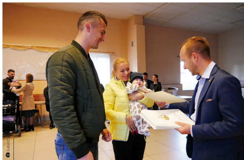
Najpopularniejsze nadawane imiona dla chłopców to Wojciech, Mikołaj, Antonii i Leon, a dla dziewczynek - Julia, Pola i Nela