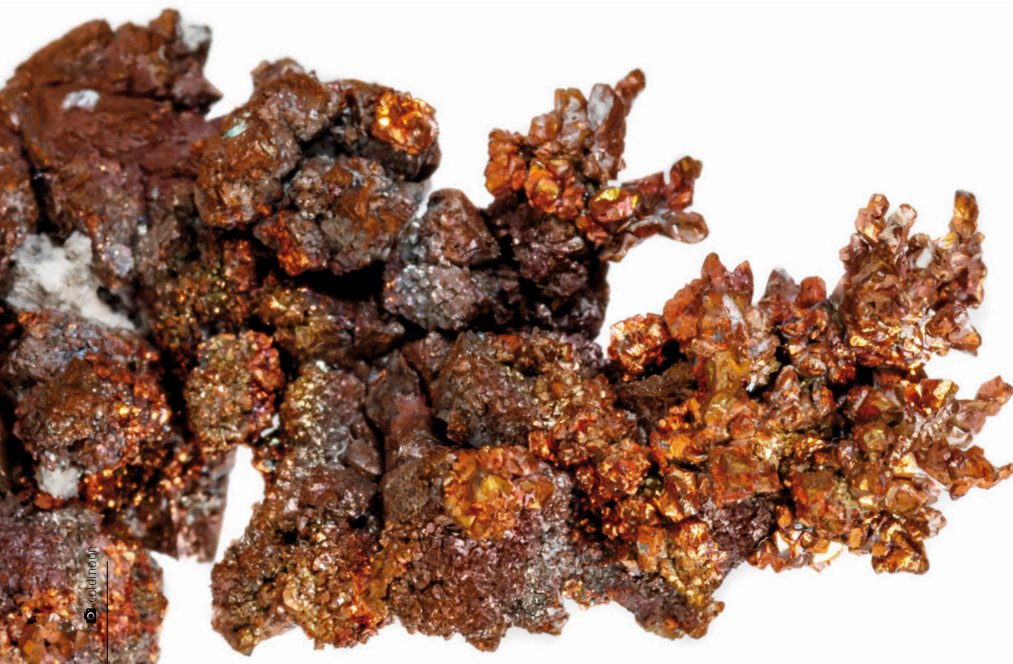
Miedź w naturze występuje w postaci rud oraz w postaci czystej jako minerał

Przy tych wszystkich zaletach miedzi, dzięki którym współcześnie wykorzystuje się ją w budowlance i architekturze, metal posiada jeszcze jedną, niekoniecznie chlubną cechę – jest stosunkowo droga. Dzieje się tak ze względu na wspomniane wcześniej ogromne zapotrzebowanie i niewielkie zasoby. Inwestycja w miedziane elementy zwraca się jednak na kilka sposobów. Po pierwsze, zwiększa wartość budynku, po drugie, pozytywnie wpływa na zdrowie człowieka i na środowisko, po trzecie, dzięki wytrzymałości