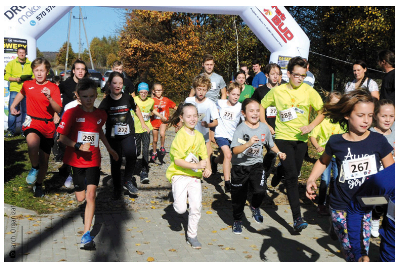
Dzieci startowały na dwóch dystansach: młodsze – 800 metrów i starsze – 1500 metrów

Po raz kolejny tej sportowej imprezie towarzyszyła akcja pomocy. – Kiedy dwa lata temu organizowaliśmy po raz pierwszy Bieg Wokół Góry Grodowej, przyświecało nam hasło