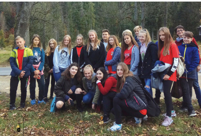
W październikowy weekend wolontariusze ze Szkolnego Koła Caritas wzięli udział w wyjeździe szkoleniowym

– Obecnie rozpoczęła się kolejna edycja kampanii „Pola Nadziei”, międzynarodowego programu pozyskiwania środków na funkcjonowanie hospicjów, w którym uczestniczą nasi