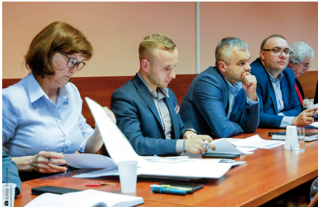
Trwają zaawansowane prace nad budżetem na 2020 rok. Uchwałę budżetową zgodnie z ustawą o samorządach rada gminy podejmuje przed rozpoczęciem roku budżetowego

Narzędzie będzie składało się z modułów, dzięki którym będzie ono służyło nie tylko do przeprowadzania badań