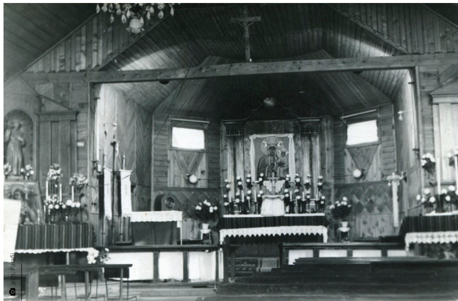
◀ Pierwszy kościół parafialny ▲ Wnętrze kościoła ▼ Obecna świątynia w trakcie budowy