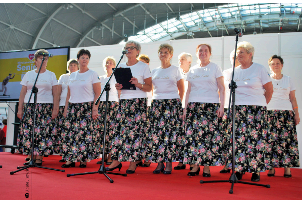
Członkinie Klubu Seniora „Złote Lata” na scenie I Międzynarodowych Targów Seniora