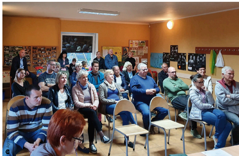
Mieszkańcy Tumlina pieniądze przeznaczyli m.in. na oświetlenie ulic sołectwa czy montaż lustra drogowego na ulicy Barwnej

Sołectwa: Tumlin, Ćmińsk Kościelny, Ćmińsk Rządowy, Kostomłoty Pierwsze i Kostomłoty Drugie otrzymały z funduszu sołeckiego po 37 912 złotych. Natomiast sołectwu Bobrza