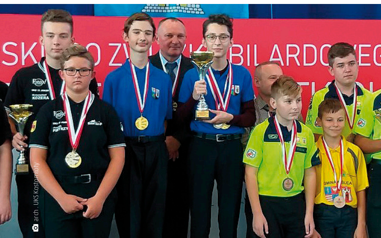
Drużyna UKS Kostomłoty z pucharem Mistrza Polski