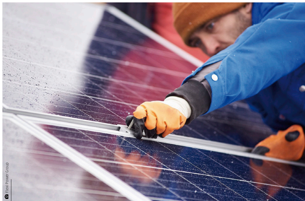
Rozpoczął się montaż pierwszych instalacji fotowoltaicznych na terenie naszej gminy w ramach realizacji projektu pn: „Zielone Gminy Zagnańsk i Miedziana Góra”

Kończą się prace projektowe nad nowym miejscowym planem zagospodarowania przestrzennego sołectwa