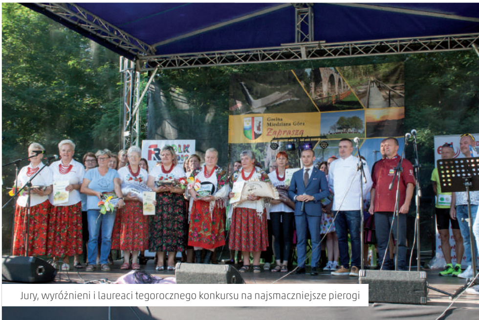
Jury, wyróżnieni i laureaci tegorocznego konkursu na najsmaczniejsze pierogi