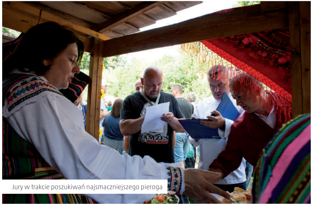
Jury w trakcie poszukiwań najsmaczniejszego pieroga