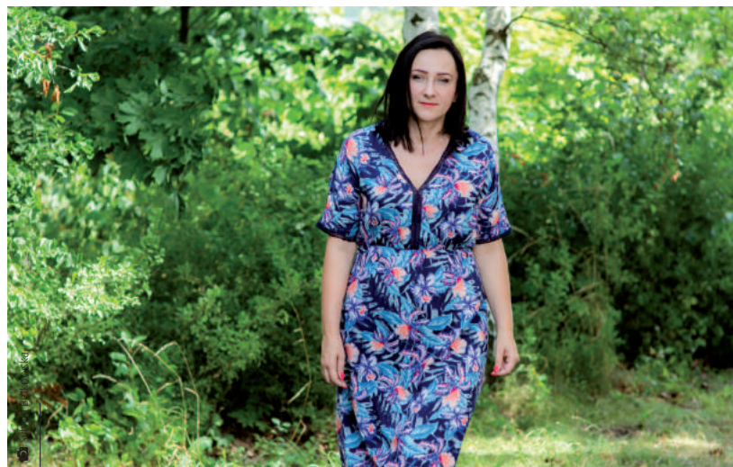
Bezpieczeństwo i zrównoważony rozwój gminy oraz integracja jej mieszkańców to najważniejsze sprawy dla radnej