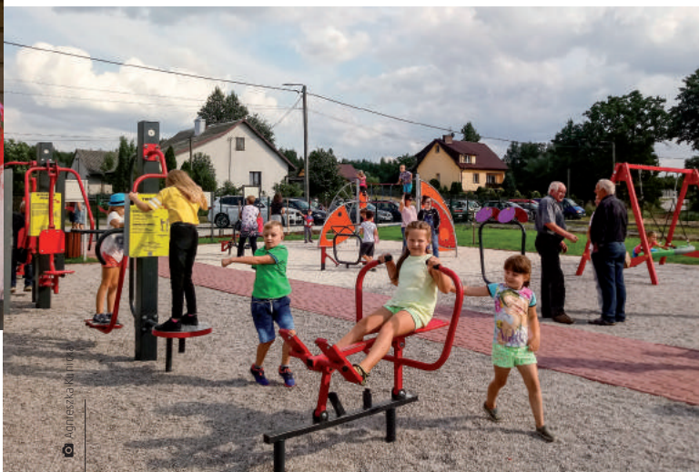
Kolorowy i bezpieczny sprzęt zlokalizowany na placu zabaw, pozwoli dzieciom urozmaicić czas kontaktu z rówieśnikami

Słowa podziękowania należą się wszystkim zaangażowanym w budowę tego miejsca, które umożliwi wspólne spędzanie czasu oraz integrację społeczną. Ważne dzisiaj jest, by „oderwać” dzieci i młodzież od komputerów. – Mieszkańców naszej