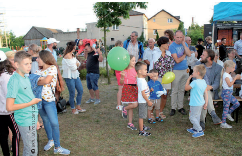
Pierwsza edycja Porzeczady mimo kapryśnej pogody przyciągnęła mieszkańców sołectwa i okolic

Punktem kulminacyjnym było przeciąganie liny: dzieci kontra dorośli. Wyrównane konkurowanie i głośny śmiech dzieci udawały, jak ważny jest dla nich czas spędzany z dorosłymi. Także do udziału w rozgrywkach zręcznościowych nie brakowało ochotników, a drobne upominki, którymi nagradzani byli zwycięzcy, niewątpliwie zwiększały chęć rywalizacji. Organizatorzy zatroszczyli się także o poczęstu-