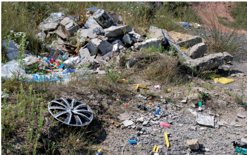
Nielegalnie wyrzucone śmieci na terenie kamieniołomu Mogiłki w Kostomłotach Pierwszych