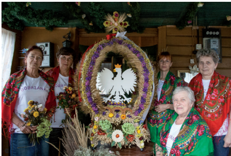
Gminę Miedziana Góra w tegorocznym powiatowym święcie plonów reprezentować będzie wieniec upleciony przez KGW Bobrzanki

W stuletniej chałupie od połowy lipca trwają intensywne prace nad dożynkowym wieńcem gminy Miedziana Góra. Powstające ludowe dzieło weźmie udział w konkursie na najpiękniejszy wieniec powiatu kieleckiego. Po raz pierwszy wiją go członkinie Koła Gospodyń Wiejskich Bobrzanki. – To dla nas duży zaszczyt i wyróżnienie. To też nasz mały debiut. Wcześniej wieńce dożynkowe wyplatałyśmy na parafialne święto plonów w Ćmińsku – mówią panie z KGW Bobrzanki.