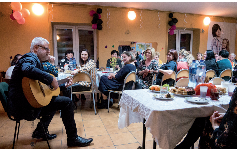
8 marca celebrowany z gitarą w świetlicy w Tumlinie

Jeszcze w karnawale z przytupem rozpoczęły świętowanie KGW „Porzeczaneczki” – imprezą, na której obowiązywały stroje z lat młodości. – Niezaprzeczalnie dla mnie to