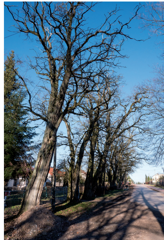
Aleja 200-letnich akacji w Bobrzy przy ulicy Stanisława Staszica

dróg. Przykładem były karczmy i zajazdy, karczma taka funkcjonowała m.in. w Bobrzy.