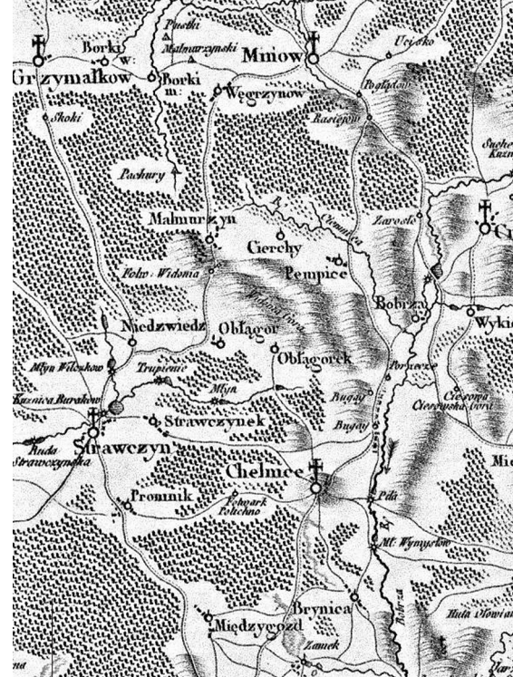
Fragment mapy z 1787 roku z układem dróg w miejscowościach leżących obecnie na terenie gminy

Odcinki dróg miały średnio dwie mile, posiadały szlabany, zaczynały się i kończyły przy zabudowaniach miejscowości. W pewnym momencie uregulowano budownictwo wokół traktów,