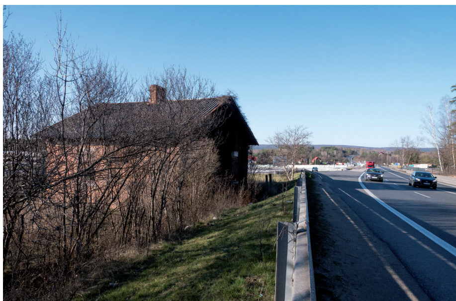
Po 1815 roku tereny gminy Miedziana Góra należały do zaboru rosyjskiego. Przy drogach budowano koszarki, jedyna stoi jeszcze przy drodze 74 przy torze Kielce

Ciekawym obiektem stojącym blisko drogi Cmińsk-Samsonów jest zrekonstruowany w 2008 roku kopiec w Cmińsku. Trudno określić, przez kogo i kiedy został usypany. Według niektórych przekazów mógł on być kopcem granicznym z czasów zaborów. Jeszcze inne źródła przekonują, że kopiec to relikwiarz dawnego drogownictwa. Wiele jednak wskazuje na to, że obiekt jest jeszcze starszy, a jego historia może sięgać okresu, gdy tereny te były własnością biskupów krakowskich. Możliwe, że pierwotnie stanowił on jeden z punktów, które wytyczały granice między ziemiami biskupimi a dobrami szlacheckimi, od północy należącymi do rodziny Gawrońskich, a od zachodu – do rodu Tarłów. Z czasem kopiec stał się miejscem kultu oraz pamięci historycznej. ■