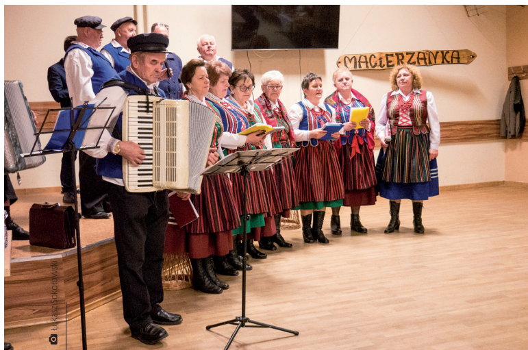
Koło Gospodyń Macierzanka dzięki wsparciu będzie kontynuować promocję kultury i tradycji ludowej

Środki zostały przyznane łącznie 23 organizacjom, które w tym roku ubiegały się o dofinansowanie przedsięwzięć służących mieszkańcom gminy. Są to zarówno wydarzenia o charakterze sportowym, kulturalnym czy edukacyjnym. Część z nich to imprezy cykliczne, które już na stałe wpisały się w życie naszej społeczności. Organizują je LUKKS Miedziana Góra, Stowarzyszenie „Aktywny Ćmińsk”, a także kluby sportowe Wicher Miedziana Góra i Gród Ćmińsk. Wśród dotowanych znalazło się Stowarzyszenie Rekonstrukcji Historycznej