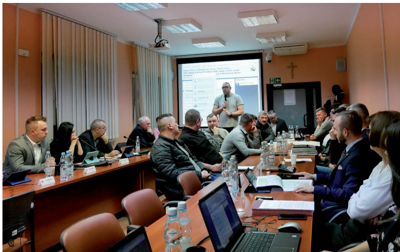
W obradach Rady Gminy swój głos sprzeciwu odnośnie planów budowy linii kolejowej CPK przez gminę wyrazili mieszkańcy

W trakcie posiedzenia dwunastu radnych podjęło między innymi uchwały finansowe dotyczące budżetu gminy na 2020 rok. Radni wyrazili sprzeciw wobec wszystkich zaproponowanych wariantów przebiegu planowanej przez teren gminy linii kolejowej Centralnego Portu Komunikacyjnego. W bloku uchwał przyjęty został także na ten rok program opieki nad zwierzętami bezdomnymi oraz zapobiegania ich bezdomności. Jednym z elementów programu jest wydawanie mieszkańcom naszej wspólnoty talonów na sterylizację kotek (60 sztuk) i suk (70 sztuk) przez Urząd Gminy. Dokument zawiera także wytyczne, jak postępować w przypadku bezdomnych zwierząt na terenie gminy. Zgłoszenia o takiej sytuacji należy kierować do Urzędu Gminy, a po godzinach jego pracy i w wolne dni oraz święta można zgłaszać pod numerem telefonu 883 777