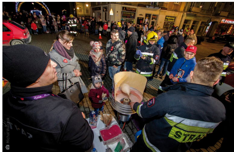
Kwista ćmińskich strażaków na ul. Sienkiewicza w Kielcach

Młodzieżowej i Kobiecej Drużyny Pożarniczej po strażaków z OSP zapełniliśmy nasze skarbonki nie tylko pieniędzmi, ale i pozytywną energią oraz serdecznością wszystkich ludzi. Wspaniale jest poczuć tę niesamowitą moc dobra! – cieszą się ochotnicy z OSP, których pokaz ratowania ludzkiego życia z wypadku komunikacyjnego zgromadził w Kielcach przy ulicy Sienkiewicza tłum ludzi o wielkich sercach, chętnie wypełniających kolejne puszkę WOŚP. Zbiórkę wspomógł przy okazji morsowania nad zalewem Umer „Aktywny Ćmińsk”, zapraszając wolontariuszy z OSP i szkoły. 97 morsów w wo-