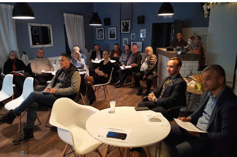
Grudniowe konsultacje z mieszkańcami Miedzianej Góry i Kostomłotów Drugich

Na grudniowym spotkaniu dotyczącym części zachodniej i południowej została przedstawiona prezentacja wyjaśniająca, czym jest plan zagospodarowania przestrzennego. Omówiono tryb opracowania projektów planu, składania