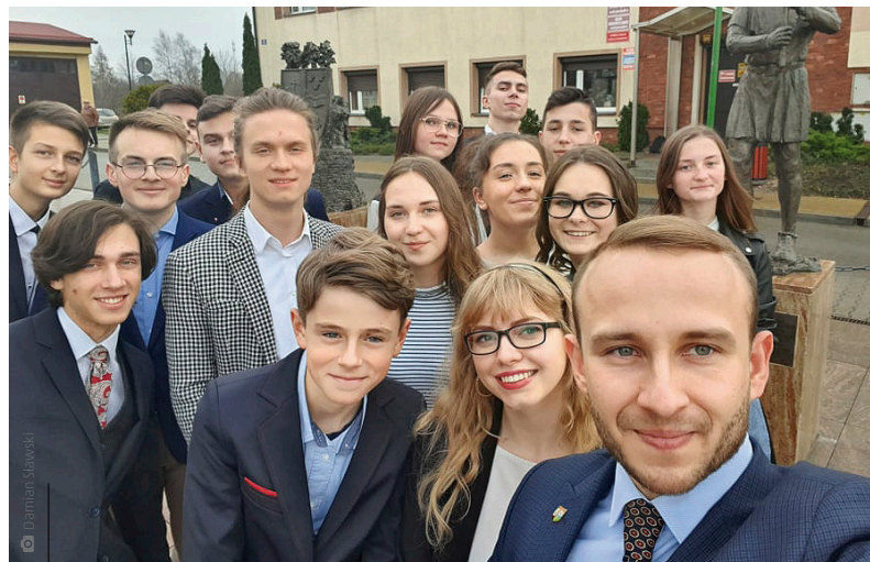
Młodzieżowa Rada Gminy liczy 16 członków, a jej kadencja będzie trwała dwa lata

Młodzi samorządowcy na początku obrad złożyli uroczyste ślubowanie i otrzymali certyfikaty potwierdzające uzyskanie mandatu. Następnie radni wybrali prezydium rady – prze-