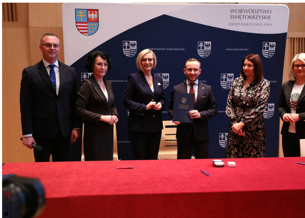
Podpisanie umowy partnerskiej na projekt „Tworzenie lokalnych systemów wsparcia dla seniorów”

temów Wsparcia dla Seniorów», którego liderem jest Regionalny Ośrodek Polityki Społecznej. Jest to projekt finansowany z budżetu Unii Europejskiej, który, jak sama nazwa wskazuje, ma pomóc starszym mieszkańcom, zwłaszcza tym najbardziej potrzebującym, w codziennym funkcjonowaniu. I jest to działanie zaadresowane wprost do Waszej gminy,