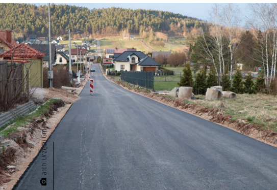
Jeden z 17 odcinków dróg przebudowanych w ramach dwuletniego przedsięwzięcia inwestycyjnego z dofinansowaniem rządowym

Nasza gmina zmienia się, co widać gołym okiem. Jest bezpieczniej, ładniej i łatwiej – szczególnie dzięki nowej infrastrukturze drogowej. Ale lepsza gmina to nie tylko drogi czy oświetlenie. To nowoczesne szkoły i żłobek. To bogaty