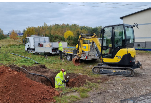
Prace przy wymianie starego wodociągu w sołectwie Ćmińsk Kościelny

na poziomie ponad 11 000 000 złotych. To drugie najwyższe dofinansowanie wśród gmin z naszego powiatu w ramach pierwszej edycji konkursu. Innymi słowy: staramy się pozyskać maksymalnie dużo środków, by inwestycje w gminie było jak najwięcej. W mijającej kadencji przebudowano, rozbudowano i wyremontowano prawie 16 kilometrów dróg na terenie gminy Miedziana Góra! To aż 17 odcinków dróg przebudowanych niemalże we wszystkich sołectwach gminy. Modernizacji uległ także most nad Bobrzą łączący Porzecze z Ciosową. Nowe oblicze zyskały także drogi powiatowe, wśród nich ulice: Laskowa w Kostomłotach Drugich i Wykień w Ćmińsku oraz odcinek Przyjmo–Bobrza dzięki współpracy z samorządem powiatu kieleckiego. Przebudowy i remonty objęły także drogi gminne: ulicę Leśną w Ciosowej, Kamienną i Słoneczną w Miedzianej Górze oraz ulicę Świątełek w Ćmińsku. Rozpoczęliśmy prace przy ulicy Staszi-