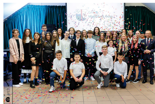
Laureaci drugiej edycji Gminnego Programu Stypendialnego „Nadzieje Miedzianej Góry”

Edukacja dzieci i młodzieży w gminie od początku kadencji jest naszym priorytetem. Konsekwentnie remon-