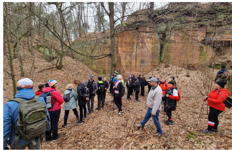
Uczestnicy rajdu w rezerwacie Kamienne Kręgi w Tumlinie

Co roku 1 marca przypominamy sobie polskich bohaterów, którzy po zakończeniu drugiej wojny światowej nie pogodzili się z rosyjskim dyktatem i nie oddawszy broni, zwalczali komunistów w kraju. Wielu z nich działało w strukturach partyzanckich i w Armii Krajowej. Po wojnie za niezłomność,