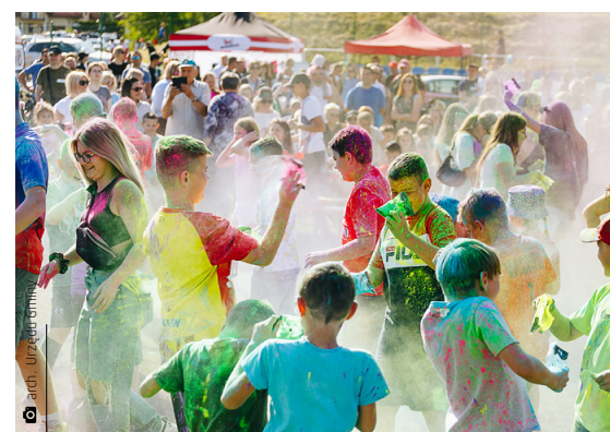
Gminny festyn rodzinny z okazji Dnia Dziecka