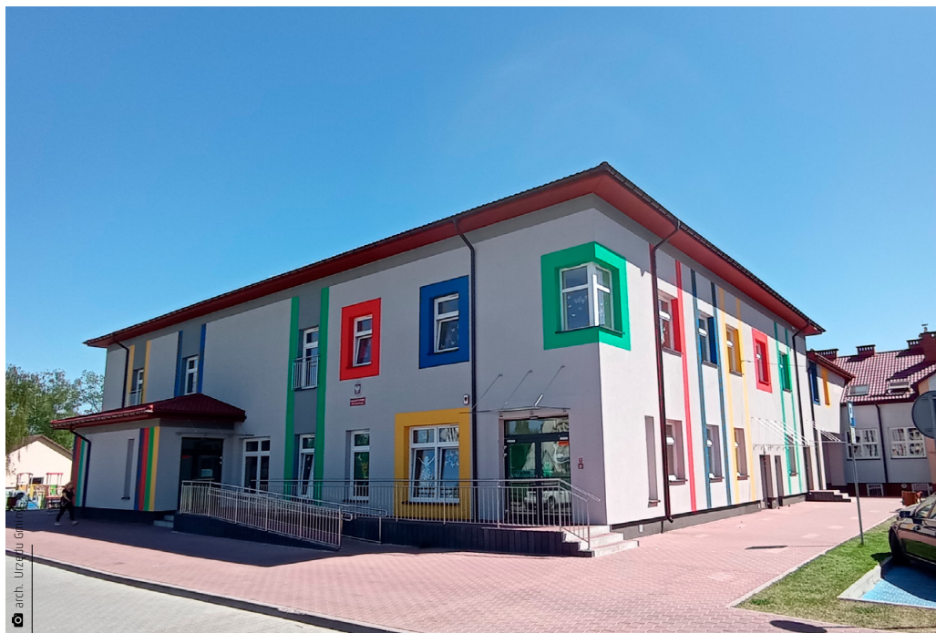
Pierwszy samorządowy żłobek w gminie

Ponad 350 000 złotych dofinansowania otrzymała nasza gmina na zakup sprzętu informatycznego i wdrożenie nowych e-usług. Dzięki środkom z Unii Europejskiej powstał Cyfrowy Urząd – Portal Interesanta, a Urząd Gminy Miedziana Góra został wyposażony w nowoczesny sprzęt komputerowy, czytniki do e-dowodów czy urządzenia sieciowe.