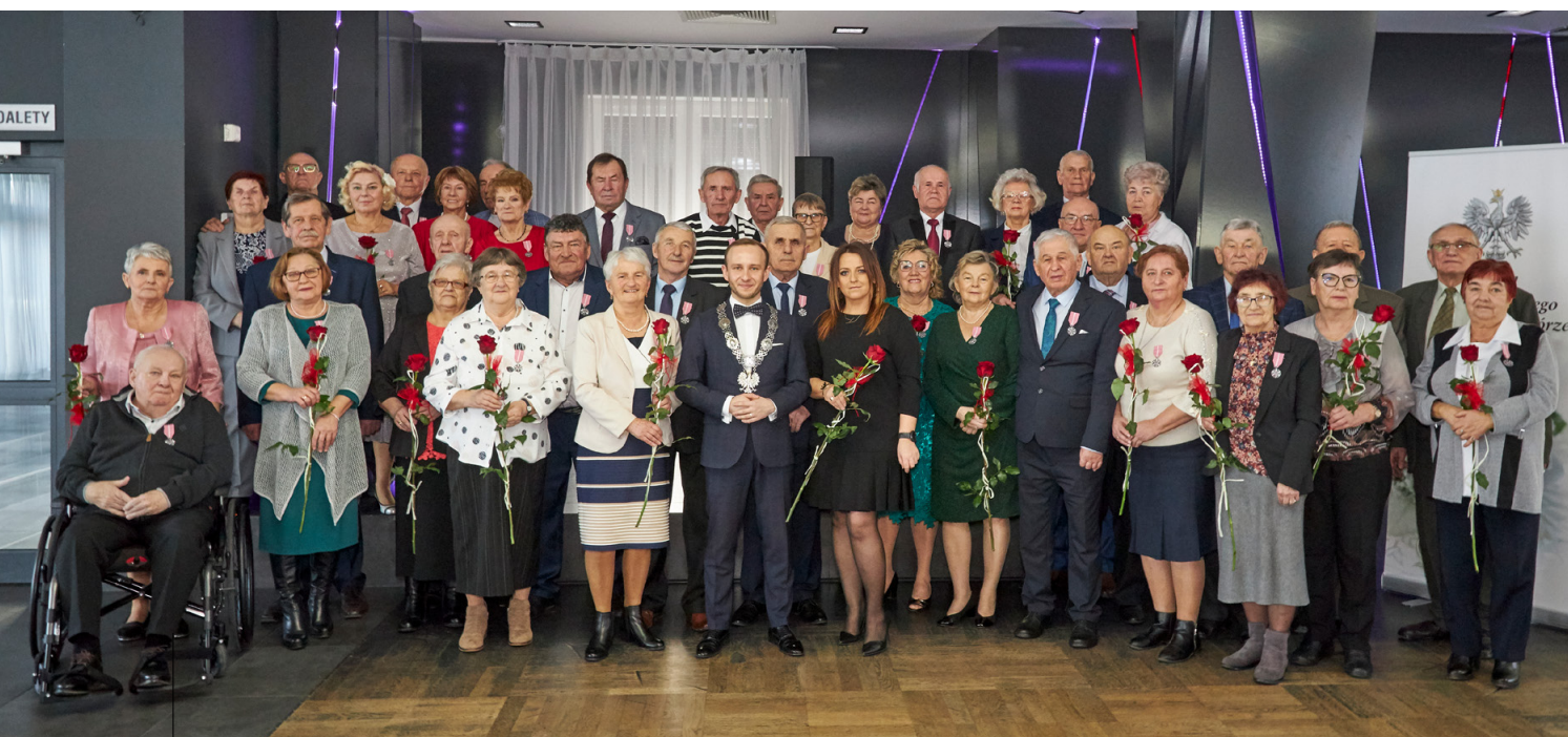
Pary obchodzące jubileusz 50 lat małżeńskiego pożycia