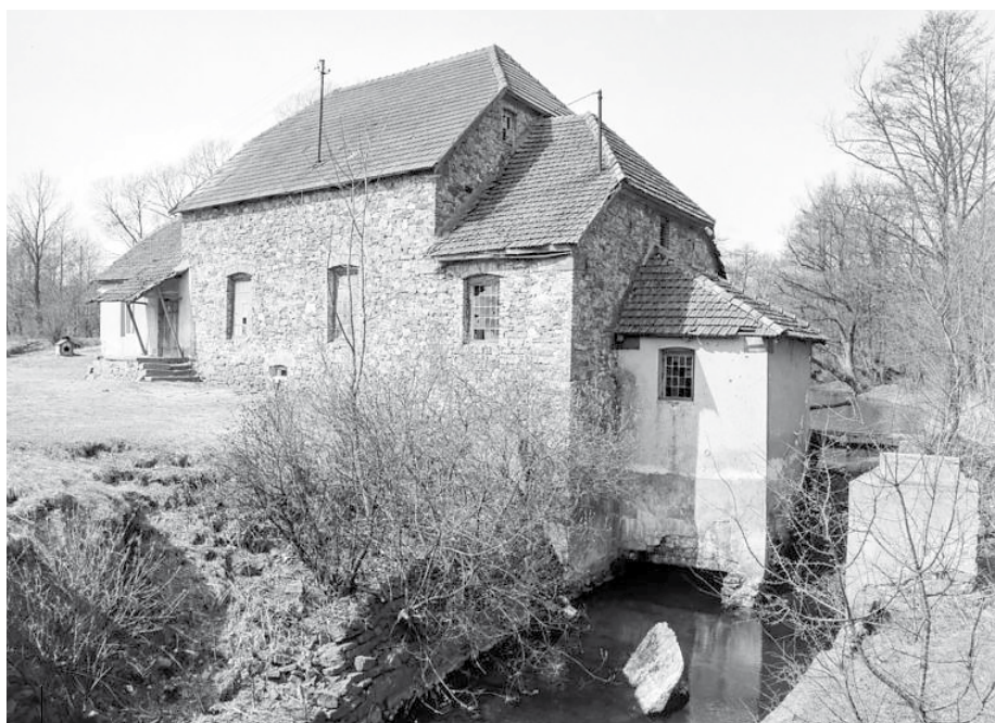
Młyn w Bobrzy, 1972 rok, zdjęcie wykonał Paweł Pierściński

W następnych latach w Bobrzy młyna nie było. Pierwsza informacja o nowym młynie pochodzi z roku 1925, lecz podobno istniał on już od 1914 roku. Pracował w nim jeden robotnik, a w wykazie wójta gminy Samsonów podano, że prowadził go Dominik Soja. Młyn mielił żyto, pszenicę, jęczmień i tatarkę. Przeciętna produkcja roczna w 1925 roku wyniosła około 15 ton. Młyn ten umieszczono na terenie obecnej Śle-farni, która należała do Bobrzy; wid-