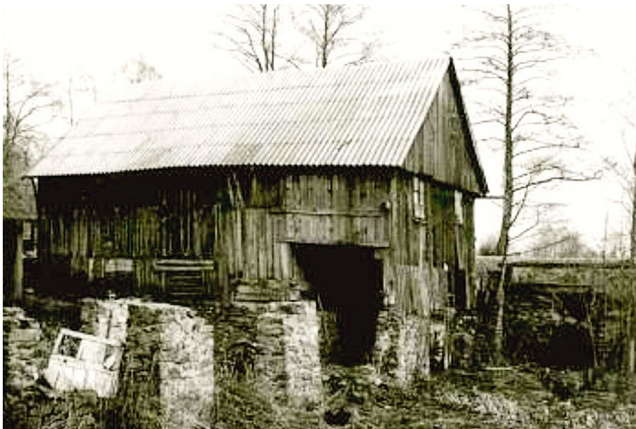
Młyn w Świątełku – widok od strony zachodniej, rok 1985, zdjęcie Zbigniew Wojtasik

W Bobrzy pierwszy młyn postawiony został przy obecnej ulicy Kaczmarka, przy skrzyżowaniu z polną drogą biegnącą w kierunku północnym. Młyn ten wykorzystał układ wodny XVI-wiecznego wielkiego pieca hutniczego, a później działających tutaj kuźnic. W 1789 roku istniała w tym miejscu kuźnica,