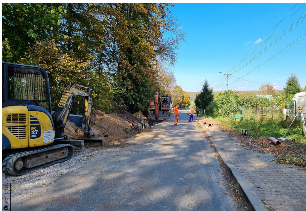
Półmetek realizacji wielomilionowej inwestycji wodociągowo-kanalizacyjnej w Ćmińsku Rządowym przypadającym na drugą połowę zeszłego roku

inwestycji wodno - kanalizacyjnych. Aż 2 000 000 złotych przeznaczymy na rozbudowę i remont infrastruktury obsługującej kanalizację i wodociągi. Dodatkowo z kolejnego naboru „Rozświetlamy Polskę” pozyskaliśmy kwotę 308 569 złotych, która pozwoli wymienić lub postawić nowe lampy oświetleniowe w miejscach publicznych. Drogie w utrzymaniu oprawy oświetleniowej zastąpią bardziej ekonomiczne i efektywne lampy LED. W sumie wymienimy aż 147 lamp ulicznych i 56 lamp parkowych. Zmiana oświetlenia poprawi bezpieczeństwo w gminie i pozwoli w przyszłości zoptymalizować wydatki na