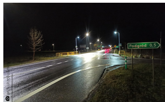
Oświetlone przejście dla pieszych na drodze 74 dla mieszkańców Podgródu

Ledwo ucichły odgłosy sylwestrowych fajerwerków, a podpisano kolejne umowy. Władze gminy podpisały umowy na projekty: rozbudowy drogi powiatowej wraz z chodnikiem oraz odwodnieniem na ulicy Przyjmo oraz projekt rozbudowy ulicy Szkolnej wraz z przebudową rowu odwadniającego w Kostomłotach Drugich. Podpisano także umowę na projekt rozbudowy części drogi powiatowej wraz z chod-