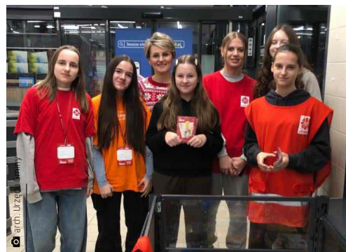
Zbiórka żywności zorganizowana przez Caritas Diecezji Kieleckiej