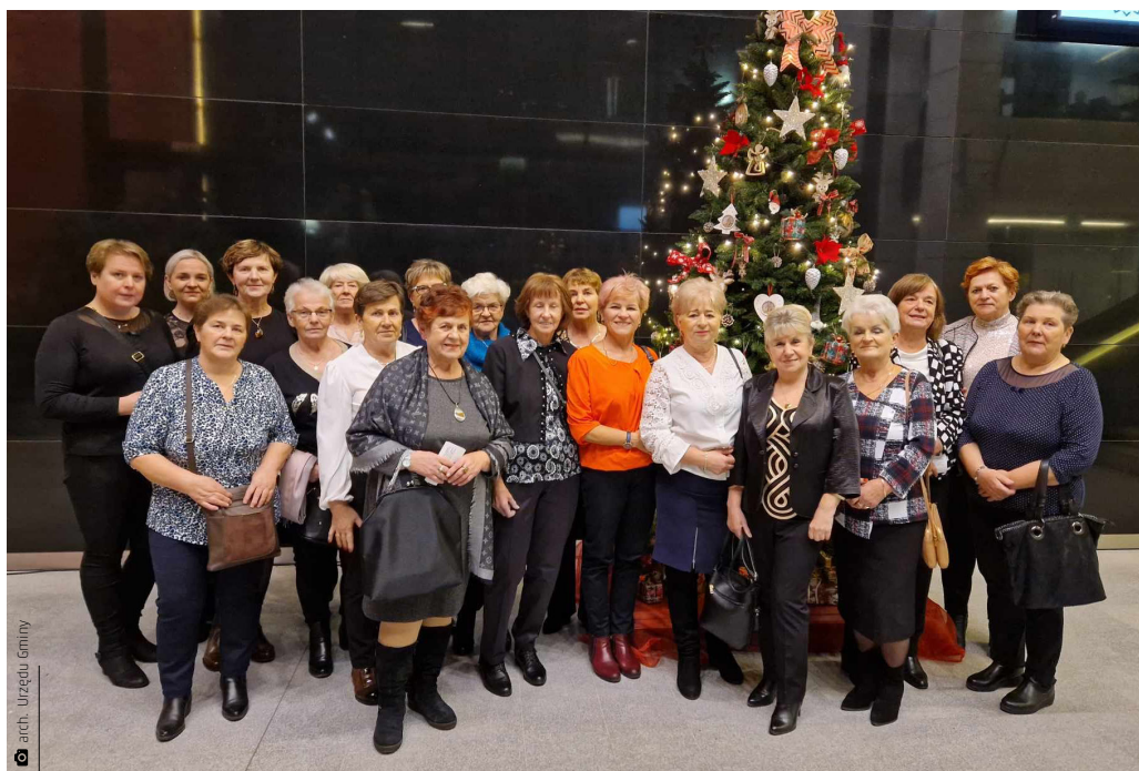
Uczestnicy projektu na Koncercie Wiedeńskim w Filharmonii Świętokrzyskiej w Kielcach

A co trzeba było zrobić, żeby wziąć udział w programie „Senioralnie z pasją!”? Mieć skończone 60 lat i poprawnie wypełnić deklarację, a następnie