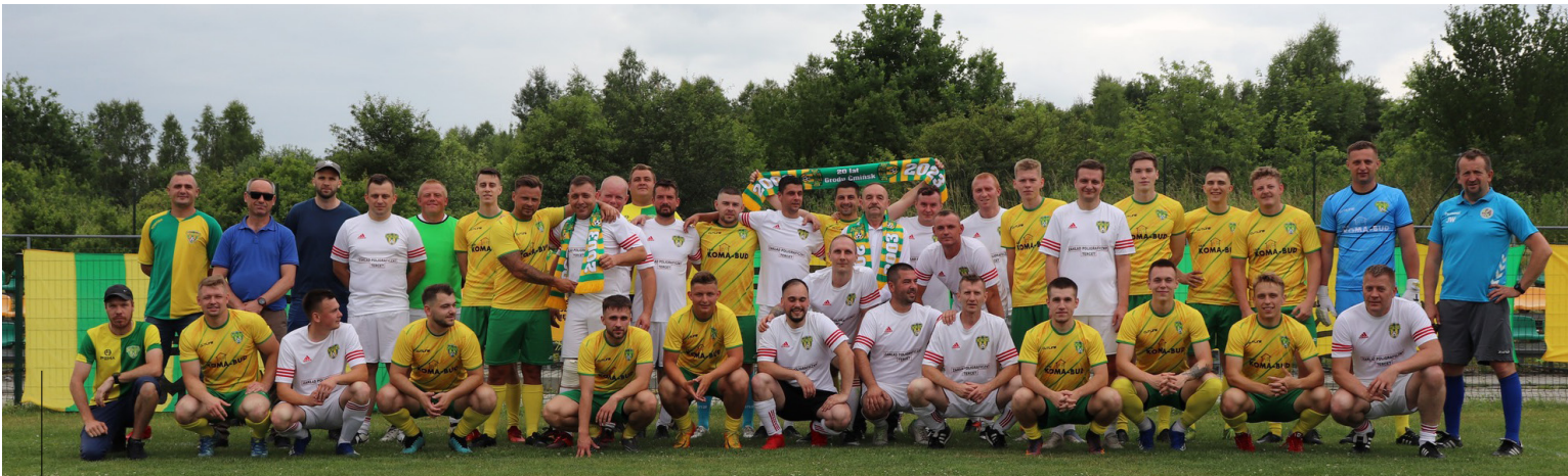
Obecni i byli zawodnicy klubu Gród Ćmiński podczas uroczystości 20 lecia klubu