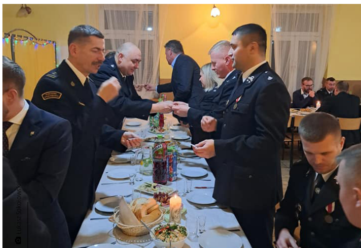
Spotkanie opłatkowe strażaków z OSP Kostomłoty Drugie

Na terenie naszej gminy działają cztery jednostki Ochotniczej Straży Pożarnej: OSP Bobrza, OSP Ćmińsk, OSP Kostomłoty i OSP Miedziana Góra. Trzy spośród tych jednostek są włączone do Krajowego Systemu Ratunkowo-Gaśniczego (Bobrza, Ćmińsk, Kostomłoty Drugie). Wszystkie jednostki posiadają strażnice murowane oraz centralne ogrzewanie. A na ilu strażaków możemy liczyć, gdy w naszym otoczeniu