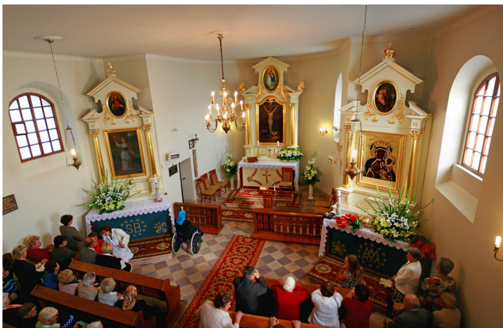
Wnętrze kaplicy św. Barbary w Miedzianej Górze