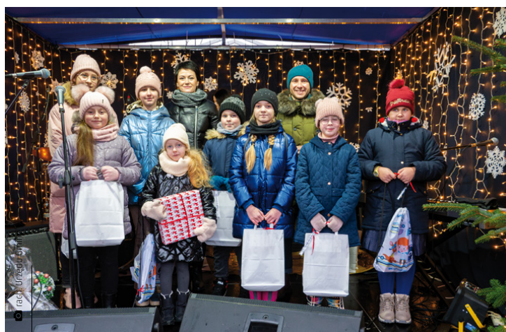
Wyróżnieni autorzy kartek świątecznych

Pięknie ubrane choinki, kolędy i zapach pierników, czyli święta za pasem. Już niebawem wszyscy usiądziemy razem za wigilijnym stołem. Co jednak z tymi, którzy są daleko?