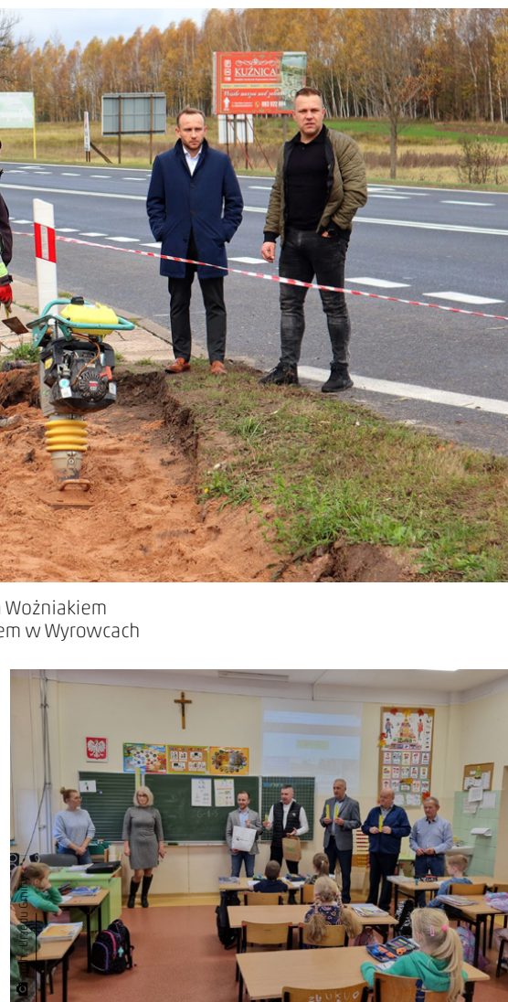
Wójt z radnymi wręczyli odblaski najmłodszym uczniom