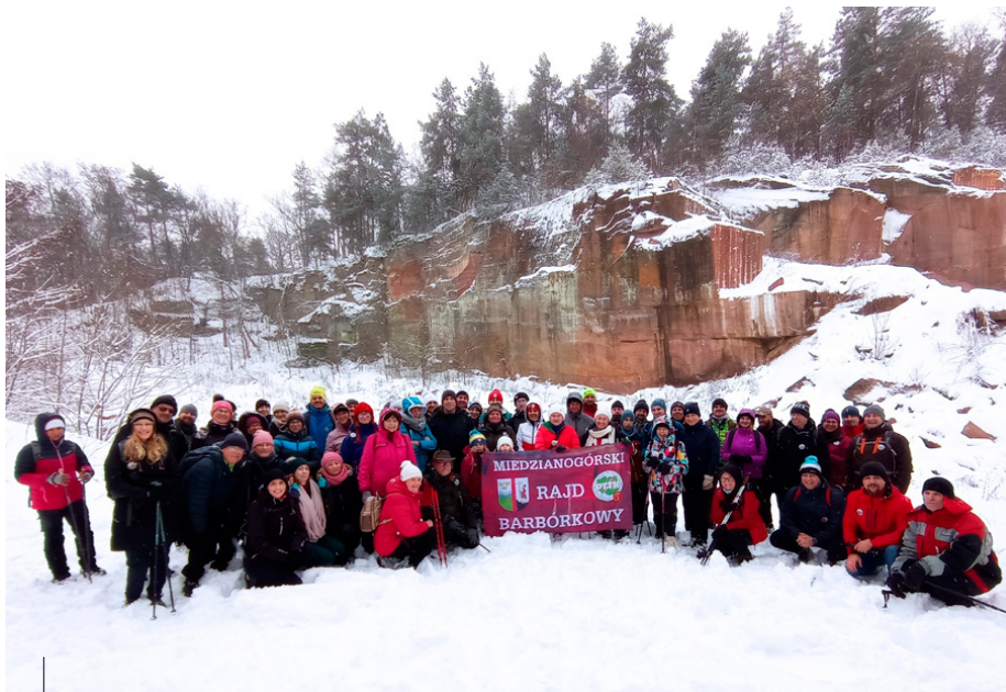
Uczestnicy rajdu barbórkowego w kamieniołomie „Tumlin-Gród”

dla górników kopalni „Tumlin-Gród”, opiekują się nią i raz w roku 5 sierpnia uczestniczą tu w uroczystej mszy odpustowej.