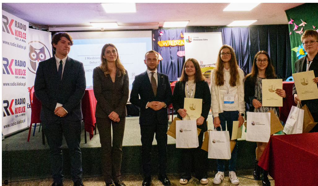
Zwycięzcy turnieju debat oksfordzkich z Zespołu Szkół w Kostomłotach Drugich

mał sprzęt komputerowy i oprogramowanie, a uczniowie i nauczyciele wzięli udział w licznych zajęciach przedmiotowych. Z kolei udział w projekcie „Aktywna Tablica” umożliwił zakup m.in. wysokiej klasy oprogramowania do kształcenia uczniów ze specjalnymi potrzebami edukacyjnymi: Dysleksja PRO i Spektrum Autyzmu PRO. Służą one do diagnozy, terapii i kształcenia uczniów ze SPE i skorzystały z nich wszystkie gminne placówki. W ramach działania „Laboratorium Przyszłości” nasze szkoły otrzymały wsparcie finansowe na zakup pomocy technicznych do zajęć manualnych. Wartość tylko tych wymienionych projektów, realizowanych w tym roku, to 1 208 899,57