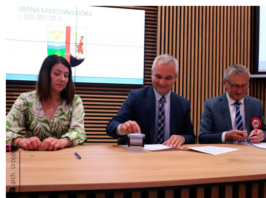
Podpisanie umowy z wojewodą świętokrzyskim Zbigniewem Koniuszem

Dzięki wsparciu minister Anny Krupki już niebawem nasze boisko zyska na urodzie i funkcjonalności. Pierwsze prace mają się rozpocząć wiosną 2024 roku, a ich zakończenie planowane jest na 2025 rok. Całkowity koszt inwestycji to blisko 1 800 000 złotych. – Boisko zyska nowoczesną sztuczną nawierzchnię oraz trybuny, których obecnie nie ma. Najważniejsze jednak będzie zainstalowanie oświetlenia, o co niejednokrotnie upominali się nasi mieszkańcy. Pozwoli to korzystać z obiektu także po zmroku, co dotychczas było niemożli-