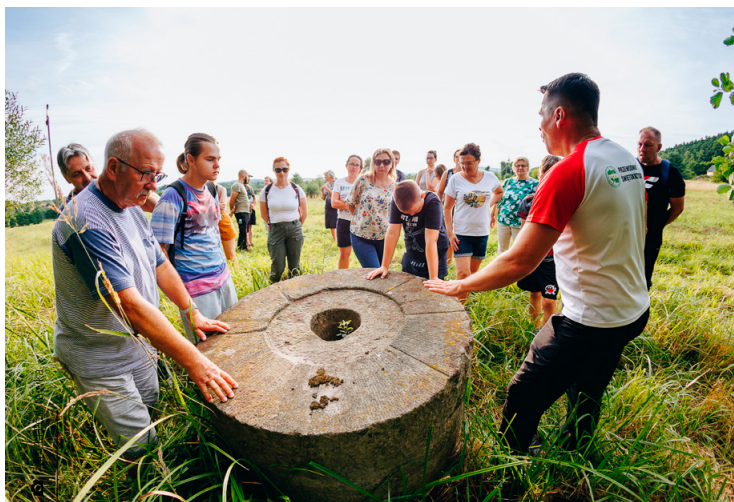
Wycieczka śladami historii sołectwa Ciosowa