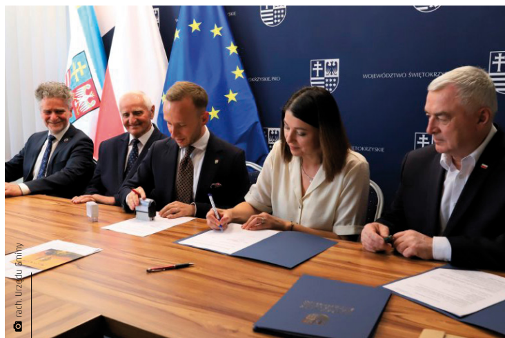
Podpisanie umowy na stworzenie miejsca aktywności i integracji w sołectwie Porzecze

Aktywność na świeżym powietrzu to same plusy. Pomaga utrzymać prawidłową masę ciała i wydolność, dotlenia, relaksuje. A do tego, sprzyja integracji. Wiedzą o tym beneficjenci konkursu pn. „Wsparcie funkcjonalności obszarów wiejskich”. W jego ramach w Miedzianej Górze realizowany jest Projekt „Stworzenie miejsca integracji i aktywności w gminie Miedziana Góra poprzez budowę małej infrastruktury rekre-