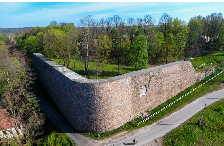
Prace remontowe nie ominą Muru Oporowego w Bobrzy

Kwota dofinansowania to dokładnie 1 045 300 złotych. Pod czujnym okiem konserwatorów prowadzone będą prace na czterech obiektach. W zakresie trwałego zabezpieczenia Muru Oporowego w Bobrzy przyznano kwotę 500 000 złotych. Remont więźby dachowej i wymiana pokrycia dachowego wraz z orywnowaniem na budynku plebanii w parafii pw. Św. Trójcy w Ćmińsku Kościelnym – 150 000 złotych. Prace konserwatorskie wewnątrz i na zewnątrz kaplicy św. Barbary w Miedzianej Górze – 195 900 złotych oraz prace konserwatorskie wewnątrz i na zewnątrz kaplicy pw. Przemienienia Pańskiego w Kostomłotach Pierwszych – 195 900 złotych.