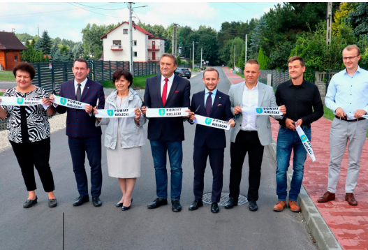
Uroczyste oddanie do użytku zmodernizowanej ulicy Wykień

przy giełdzie w Miedzianej Górze, w każdą niedzielę jest tu bardzo duży ruch oraz tysiące samochodów i pieszych. Dlatego powstała nowa nawierzchnia i nowy chodnik, aby bezpiecznie spacerować, robić zakupy i zjeść legendarne żołądki. Bo być w Miedzianej Górze i nie zjeść żołądków to jak być w Paryżu i nie zobaczyć Wieży Eiffla – powiedział starosta Mirosław Gębski. Podkreślił też, że ten odcinek nie jest zbyt długi, ale