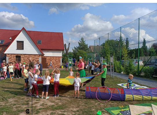
Impreza na zakończenie wakacji w świetlicy w Tumlinie

I choć nadchodząca jesień kusi piękną pogodą i widmem wieczorów spod znaku „kakałka” i kocyka, tęsknota za latem dopada nas często i niespodziewanie. Ciężko sobie z nią poradzić, zwłaszcza że latem w naszej gminie