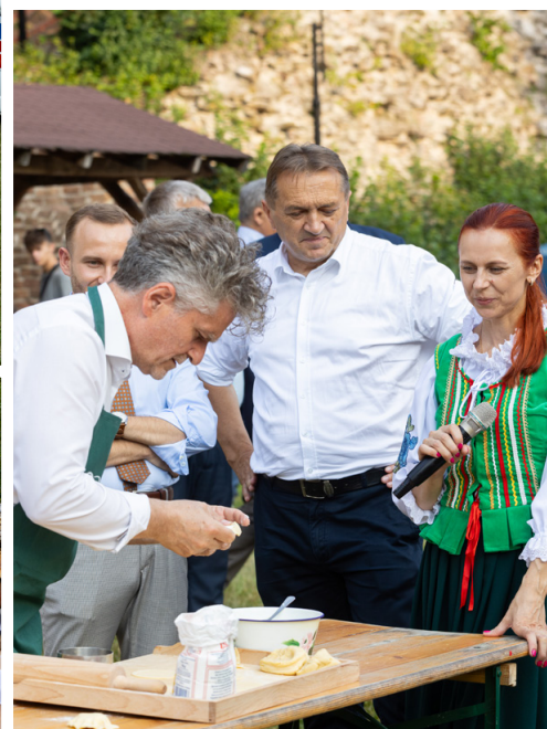
Zwycięcy i wyróżnieni na jubileuszowej 10. edycji Święta Pieroga Świętokrzyskiego