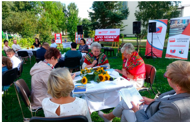
„Narodowe Czytanie” stało się tradycją w Miedzianej Górze

Czytanie poszerza słownictwo, wpływa na wyobraźnię, uczy i relaksuje. Naukowcy nie mają żadnych wątpliwości co do tego, że czytać można, a nawet trzeba. Dlatego co roku Gminna Biblioteka w Miedzianej Górze zachęca do czytania klasyków polskiej literatury. W ramach akcji „Narodowe Czytanie” mieszkańcy naszej gminy mogli zapoznać się z dziełem Elizy Orzeszkowej „Nad Niemnem”. Po odczytaniu fragmentu listu Prezydenta Rzeczypospolitej Polskiej, za-