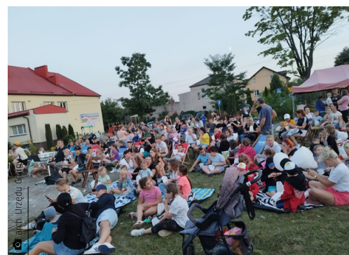
Kino letnie na placu przed Szkołą Podstawową w Porzeczcu

Nie próżnowały także panie z Koła Gospodyń Wiejskich „Porzeczaneczki”. Minifestyn zamykający wakacje okazał się sukcesem. Plac szkolny w Porzeczcu zmienił się w bajkową krainę dzięki dmuchańcom, kulkom i darmowym słodkościom. Nie zabrakło kina pod chmurką i „Kota w butach”, którego uwielbiają i mali, i duzi. W pamięci mieszkańców Porzeczca na długo pozostanie także wspomnienie nocy święto-