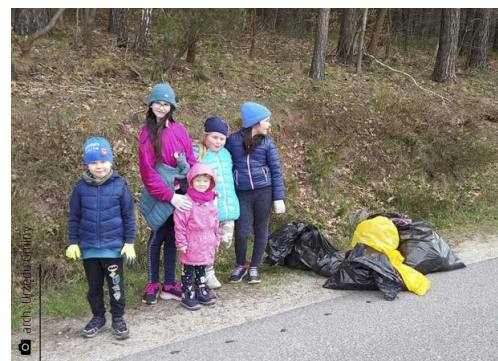
Najmłodszy z sołectwa Ciosowa zaangażowani w akcję sprzątaną