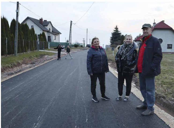
Nowa nawierzchnia asfaltowa na ul. Malachitowej w Miedzianej Górze