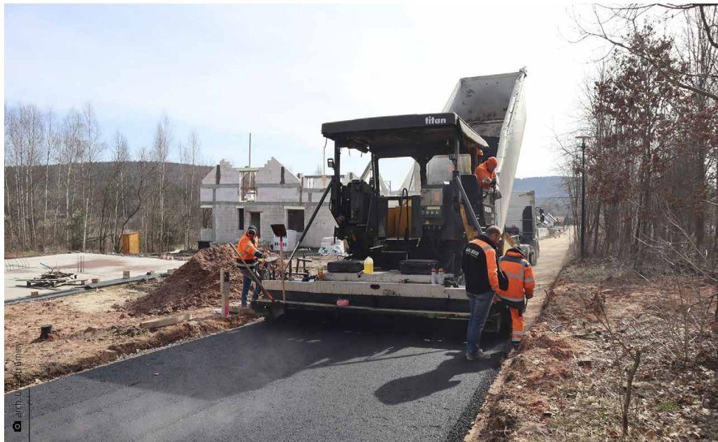
Układanie nawierzchni asfaltowej na ulicy Jesionowej

Nie wszystkie prace zostały całkiem ukończone, wciąż przed nami jest poważny remont mostu w pasie drogo-