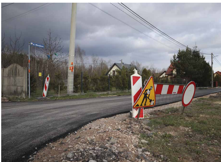
Nowa nawierzchnia na ul. Wierzbowej w Kostomłotach Drugich