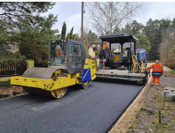
Prace na ul. Grabowej w Ćmińsku