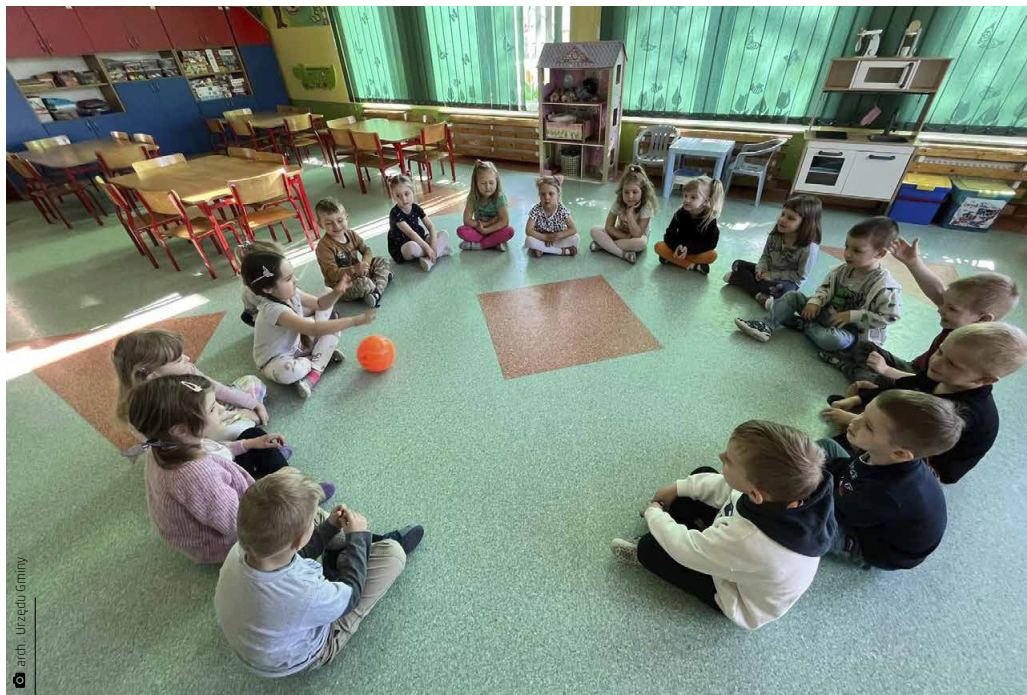
Nauka języka angielskiego w Przedszkolu Samorządowym w Kostomłotach Drugich

z zakresu poradnictwa zawodowego wśród uczniów szkół podstawowych na terenie powiatu kieleckiego. Przedsięwzięcie zainicjował starosta kielecki Mirosław Gębski. Młodzi ludzie mają szansę określić swoje mocne i słabe strony i wybrać dla siebie najlepszy zawód. W programie oprócz wykładów znalazł się także test predyspozycji i kompetencji zawodowych oraz możli-