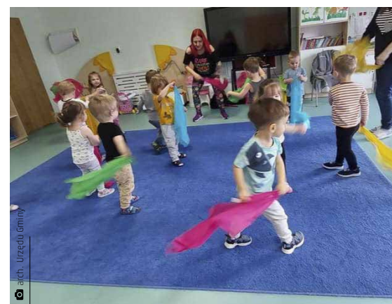
Zumbini to zajęcia, które skupiają się na podróży dziecka w świat muzyki i tańca

Z przedszkola płynnie przechodzimy do podstawówki. Ósma klasa to nie przelewki! Wymagania rynku pracy stają się coraz większe z każdym rokiem, dlatego Powiatowy Urząd Pracy w Kielcach przeprowadził cykl spotkań