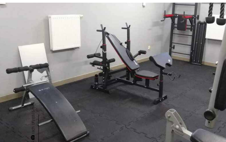
Świeżo wyremontowana siłownia wyposażona w profesjonalny sprzęt do ćwiczeń