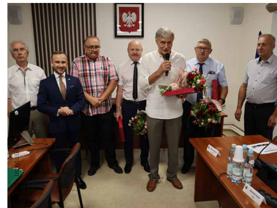
Czerwcowe sesja była też okazją do oficjalnego pożegnania się z dyrektorami gminnych placówek oświatowych

Następnie przystąpiono do głosowania, które dało taki sam wynik jak w przypadku wotum zaufania – pięć głosów za udzieleniem, dziewięć przeciwnych oraz jeden wstrzymujący. Wójt nie otrzymał od radnych absolutorium,