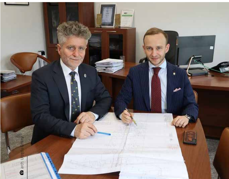
Senator Krzysztof Słoń kolejny raz przynosi dobre wieści do gminy

Przewidziane prace stanowią kontynuację etapu V należącego do wieloletniego projektu polegającego na budowie sieci kanalizacji sanitarnej oraz rozbudowie i przebudowie