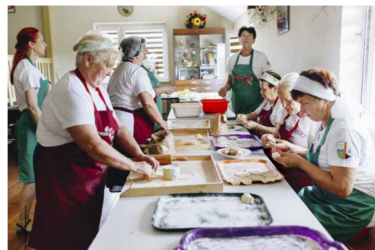
Przygotowania do pobicia rekordu z 2019 roku już się zaczęły

ło się co roku aż do wybuchu pandemii Covid-19 w 2020 roku. Powraca po przerwie już pod koniec sierpnia.