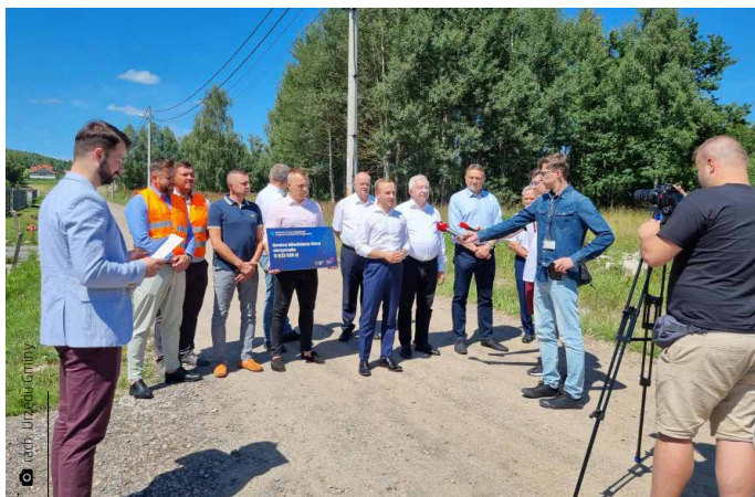
Konferencja prasowa z okazji rozpoczęcia prac budowlanych

Uroczyste przekazanie terenu firmie ALBUD Sp. z o.o. odbyło się w sołectwie Tumlin-Wykień przy ulicy Uroczej, formalnie rozpoczynając pierwszy etap inwestycji. Drogi, które zostaną przebudowane lub rozbudowane, mają od 60 do 1000 metrów długości, toteż remont obejmie w sumie blisko sześć kilometrów tras w niemal wszystkich sołectwach gminy Miedziana Góra. Obok dróg modernizację czeka też most nad rzeką Bobrzą znajdujący się w ciągu komunikacyjnym między Porze-