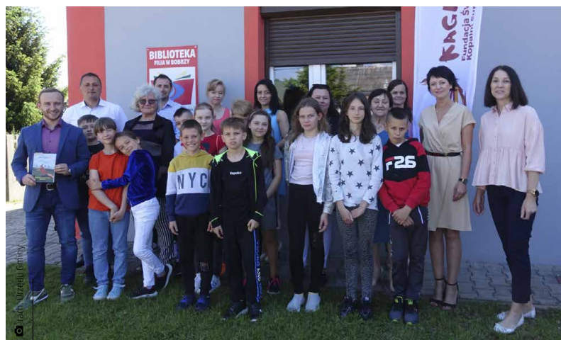
Pamiątkowe zdjęcie z uczestnikami uroczystego otwarcia