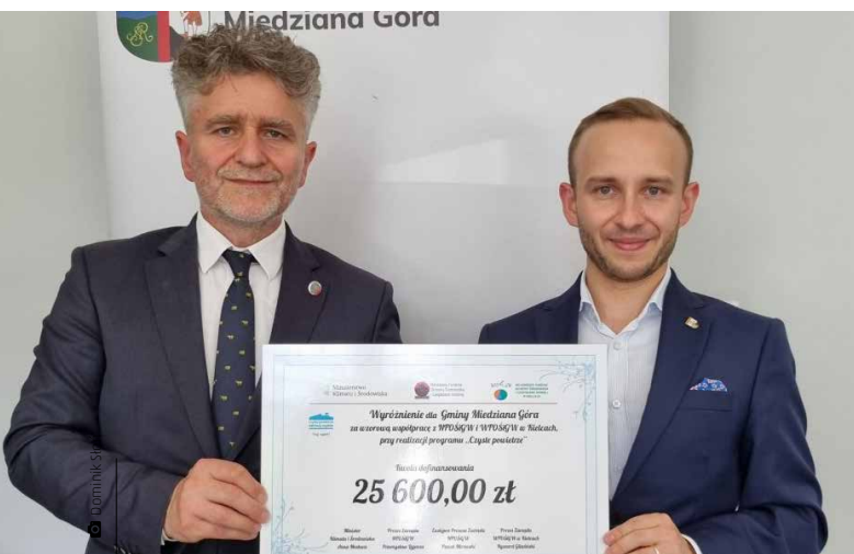
Senator Krzysztof Słoń przekazuje wójtowi promesę

Adresatami programu „Czyste Powietrze” realizowanego w całym województwie są właściciele domów jednorodzinnych, którzy przeprowadzają w swoich budynkach termomodernizację i wymieniają stare źródła ciepła na nowoczesne i przyjaźniejsze środowisku. Od 1 kwietnia 2021 roku do 31 marca 2022 roku mieszkańcy naszej gminy złożyli 178 wniosków o dofinansowanie – z tym wynikiem zajmujemy 11. miejsce w województwie i 153. w kraju. Zapewniło nam to wyróżnienie i otrzymanie dofinansowania na działalność Gminnego Punktu Konsultacyjno-Informacyjnego programu „Czyste Powietrze”. Promesę na kwotę 25 600 złotych przekazał wójtowi Damianowi Sławskiemu senator Krzysztof Słoń 18 lipca podczas spotkania.