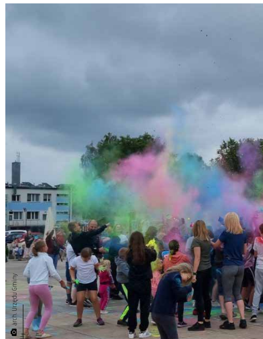
Po dwóch latach przerwy inwazja kolorów wróciła na plac przed Urzędem Gminy