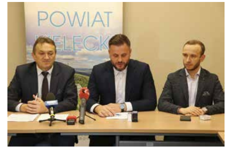
PODPISANIE UMOWY NA PRZEBUDOWĘ DROGI POWIATOWEJ W BOBRZY I PRZYJMIE