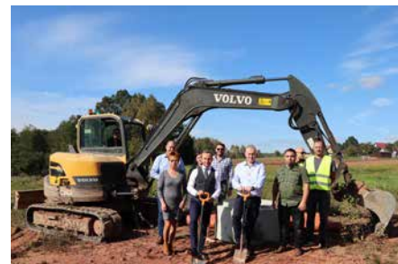
ROZWÓJ SYSTEMU WODOCIĄGOWO- KANALIZACYJNEGO