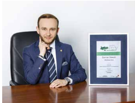
RANKING PERŁY SAMORZĄDU