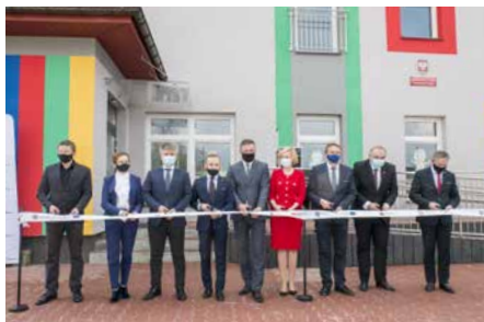
OTWARCIE PIERWSZEGO SAMORZĄDOWEGO ŻŁOBKA W GMINIE