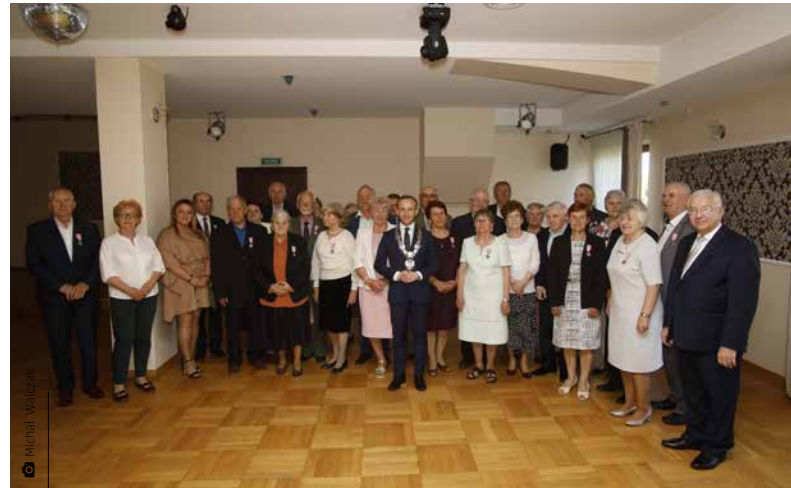
W uroczystości jubileuszowej wzięł udział również poseł Krzysztof Lipiec