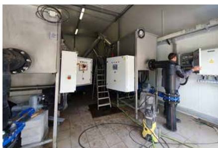
ROZBUDOWA OCZYSZCZALNI ŚCIEKÓW