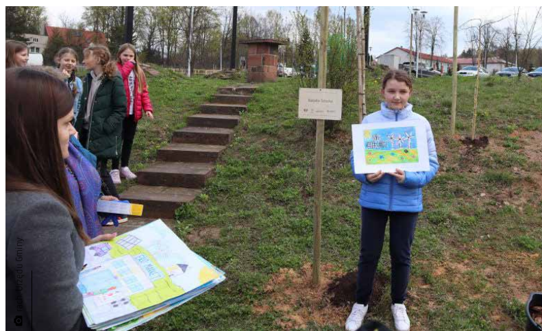
Pamiątkowe zdjęcie przy nowo posadzonym drzewie

Obchodzony co roku 22 kwietnia Międzynarodowy Dzień Ziemi kojarzy się zazwyczaj z uczniami szkół wyruszającymi w teren w celu zbierania pozostawionych śmieci. Tym razem ekologiczne święto było dla Gminnej Biblioteki Publicznej w Miedzianej Górze świetną okazją do zorganizowania nietuzinkowego przedsięwzięcia. Placówka we współpracy z Fundacją Świętokrzyskich Kopalni Surowców Mineralnych „Kaganek” ogłosiła konkurs plastyczny dotyczący „Zielonej Kopalni”. Wziąć mogli w nim udział wszyscy uczniowie szkół w Kostomłotach Drugich, Ćmińsku i Porzeczcu. Wykonanie