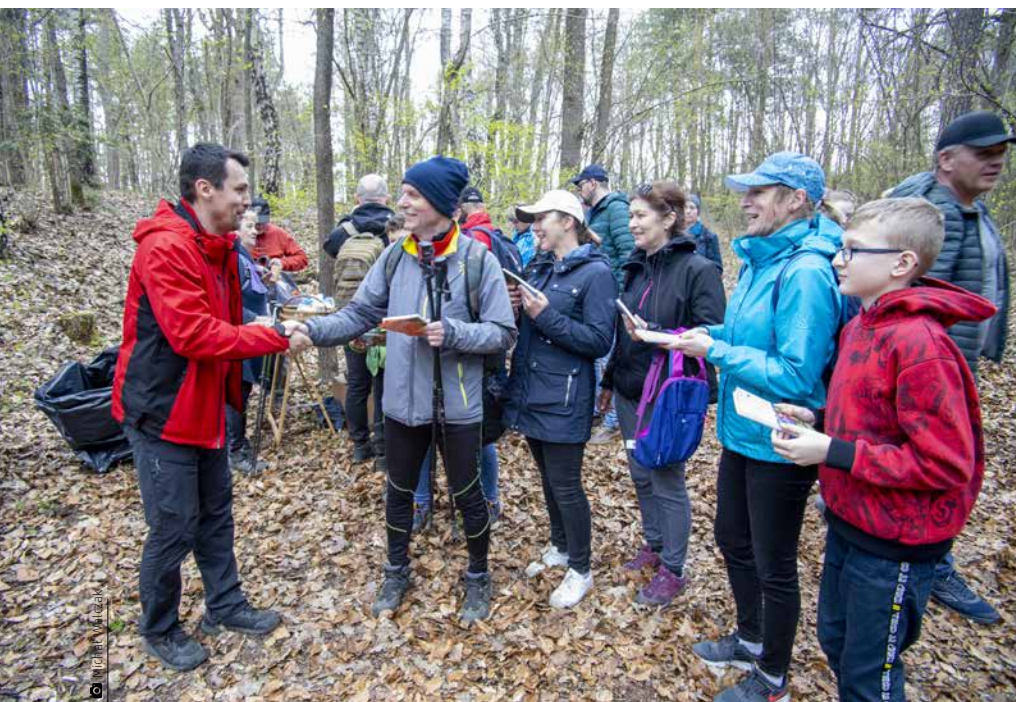
Na mecie rajdu wytrwali piechurzy otrzymali przewodnik i mieli okazję pogratulować autorowi

Uroczyste spotkanie z okazji ukazania się pierwszego przewodnika turystycznego po naszej gminie miało