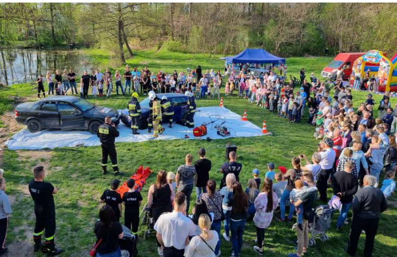
Pokazy i atrakcje przyciągnęły duże grono mieszkańców