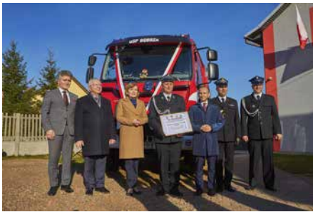
ZAKUP NOWEGO WOZU STRAŻACKIEGO DLA OSP BOBRZA