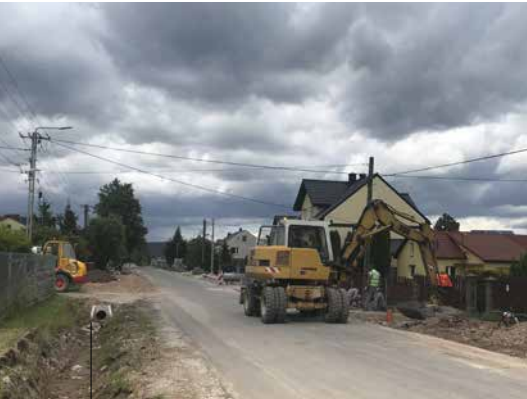
Budowa drogi w Bobrzy

Wykonawca prowadzi już zaawansowane roboty. Dotyczą one poszerzenia jezdni do szerokości 5,5 metra, ułożenia obrzeża chodnika oraz zjazdów na prywatne posesje. Robione są także przepusty pod drogą. Jak mogliśmy usłyszeć w Powiatowym Zarządzie Dróg w Kiel-