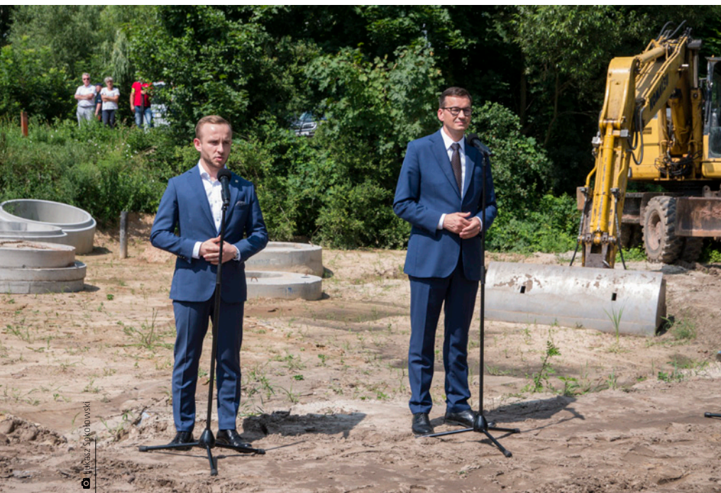
W lipcu gminę, a dokładnie plac budowy kanalizacji i przebudowy wodociągu w Porzeczcu odwiedził Premier Mateusz Morawiecki

– Ten rok był wyjątkowy dla naszej gminy. Została ona zauważona przez ekspertów najbardziej znanych i prestiżowych rankingów podsumowujących działania jednostek samorządu terytorialnego. „Liderzy Inwestycji” to zestawienie czasopisma „Wspólnota” i przygotowane jest w oparciu o informacje o wydatkach majątkowych poniesionych przez polskie samorządy przez ostatnie trzy lata. Gdy przyglądamy się danym dotyczącym nas, widać wyraźnie tendencję rozwojową. W rankingu obejmującym lata 2016–2018 nasz samorząd zajmował 407. miejsce, w kolejnym rankingu związanym z latami 2017–2019 byliśmy na 467. miejscu, a w najnowszym zestawieniu umiejscowiono nas na 188. pozycji. To jeden z najlepszych wyników w powiecie kieleckim i województwie świętokrzyskim. Awans naszej gminy widoczny jest także w Rankingu Samorządów „Rzeczpospolitej” uznawanym za jeden z najbardziej prestiżowych i wiarygodnych w kraju. Znaleźliśmy się w drugiej dziesiątce rankingu na pozycji 18.! Rok wcześniej zajmowaliśmy 286. miejsce. To pokazuje, że mimo trudnych czasów wywołanych pandemią można realizować wiele inwestycji i jednocześnie zadbać o zrównoważony rozwój.