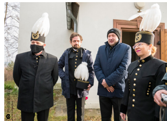
W nabożeństwie uczestniczyli pracownicy kopalni „Laskowa” ubrani w galowe stroje

Wyobraźmy sobie młodzieńką dziewczynę, córkę zamożnego człowieka z Heliopolis w dzisiejszym Libanie. Ojciec wysłał ją na naukę do innego miasta – tu nastolatka styka się z religią, która do niej przemawia, którą rozumie i dzięki której czuje się zrozumiana. Gdy do ojca dociera informacja, że dziewczyna przyjęła obcą wiarę, usiłuje ją zmusić do wyparcia się nowych przekonań. Jego prośby i groźby nie przynoszą skutku, więc donosi na córkę do władz prześladowających chrześcijan. Dziewczyna nie zostaje od razu stracona – najpierw władze zamykają niepokorną chrześcijankę w wieży i poddają okrutnym torturom, po czym skazują na śmierć. Katem zostaje ojciec, który w imię własnych idei ścina swojemu dziecku głowę. Tak pokrótce wyglądało życie św. Barbary, według przekazów zakończone właśnie 4 grudnia. Dzień ten poświęcono jej pamięci, a w późniejszych czasach ogłoszono świętem górników. Wbrew własnemu losowi św. Barbara patronuje dobrej śmierci, a swoją opiekę roztacza dziś nie tylko