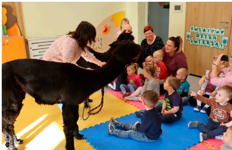
Towarzystwo alpaka uspokaja, relaksuje i poprawia nastrój

O kojącym i leczniczym oddziaływaniu tych sympatycznych zwierzaków mogły się przekonać maluchy z Samorządowego Żłobka w Kostomłotach Drugich. Dzieci miały okazję nakarmić, pogłaskać oraz oprowadzić alpaki na smyczy. Do-