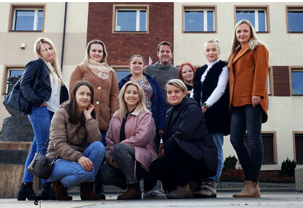
Uczestniczki projektu Mamy GÓRĄ!

Wieść o projekcie szybko rozeszła się po miedzianogórskich domach. Rekrutacja ruszyła w sierpniu, a już we wrześniu