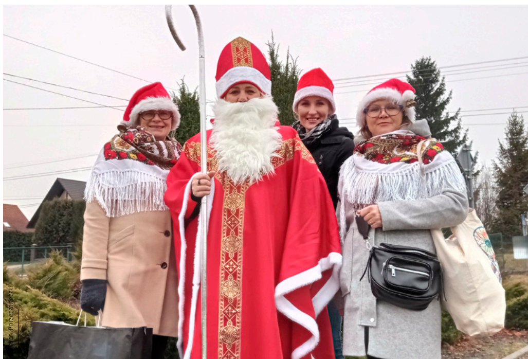
Mikołaj nie zapomniał odwiedzić także mieszkańców Porzecza

nili licznie przybyli goście. Na początku programu odbyło się krótkie przedstawienie muzyczno-pastorałkowe, po którym dzieci odwiedził św. Mikołaj wraz ze Śnieżynką i podarował im prezenty. W pomaganiu Mikołajowi włączyły się członkinie KGW „Porzeczaneczki”, robiąc piękną niespodziankę mieszkańcom Porzecza. Każdej rodzinie wręczyły własnoręcznie przygotowane herbatki w trzech rodzajach: rozgrzewającą, antywirusową i wzmacniającą oraz samodzielnie zrobiony płyn do dezynfekcji. –