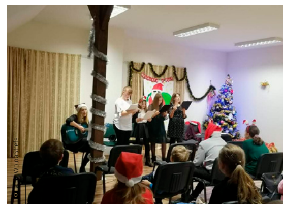
Impreza mikołajkowa w Klubie „Wolna Strefa” w Kostomłotach Pierwszych

To tytuł filmu, na który organizatorzy klubu „Wolna Strefa” zabrali swych podopiecznych do kina „Moskwa”, by uczcić mikołajki. Wraz z wychowankami celebrowali święto obdarowywania również 7 grudnia. Tego dnia zorganizowano w klubie przyjęcie mikołajkowe dla dzieci i młodzieży, które uświet-