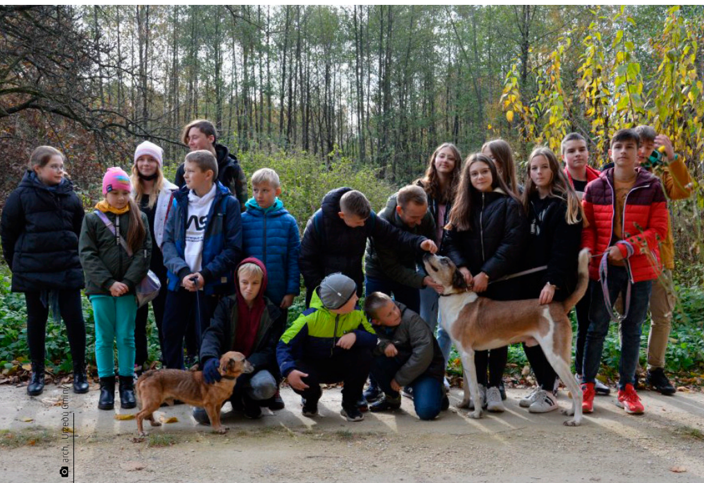
Kilkaset kilogramów suchej i mokrej karmy, koce, miski i zabawki – taki prezent zgotowali uczniowie z trzech miedzianogórskich szkół psiom z schroniska w Rytlowie

niem domu, mandat może wynieść od 50 do 250 złotych. Do 500 złotych zapłaci opiekun Fafika, który przewozi go bez smyczy i kagańca w autobusie czy pociągu. Tyle samo zapłacą właściciele psa rasy uważanej za niebezpieczną, jeśli będzie biegał bez kagańca lub jeśli zapomną o zabranii ze sobą pozwolenia na posiadanie takiego zwierzaka. Czy istnieje taryfa ulgowa? Mamy możliwość negocjacji. Jeśli udowodnimy, że Fafik jest wytresowany i wykonuje nasze polecenia, mamy szansę wybronić się od kary. Ale na wszelki wypadek nie zapominajmy o przepisach. Dwie stówki piechotę nie chodzą.