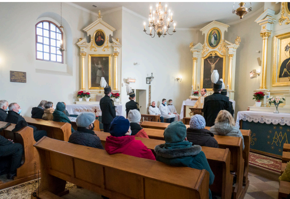
Msza święta „barbórkowa” w kaplicy św. Barbary na Górze Buchcinej w Miedzianej Górze

Znaczenie górnictwa w naszym kraju zawsze było ogromne, wydobywany kruszec niejednokrotnie stanowił o bogactwie regionu i jego mieszkańców.