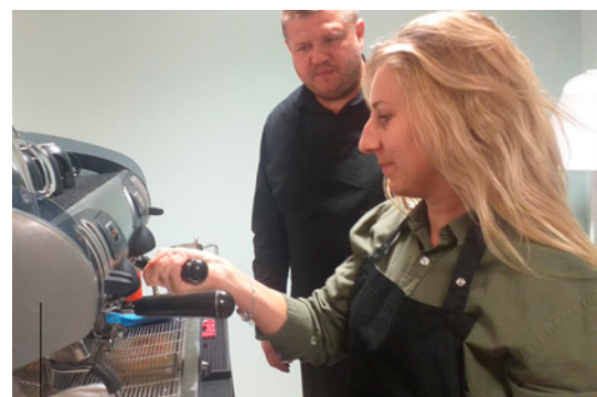
Część praktyczna kursu kelnerskiego