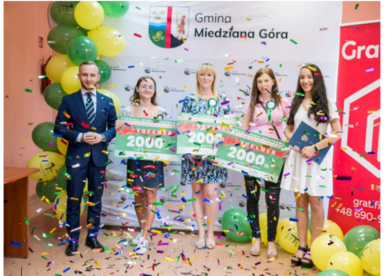
Zwycięcy w pierwszej loterii podatkowej w gminie Miedziana Góra