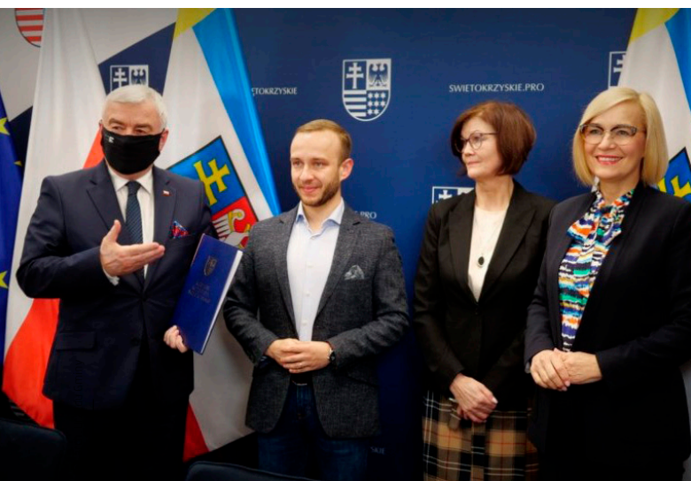
Podpisanie umowy na dofinansowanie projektu

Projekt edukacyjny „TIK? Tak!” zmierza do podniesienia ogólnej jakości kształcenia poprzez wprowadzenie nowych metod nauczania z zastosowaniem TIK, czyli Technologii Informacyjno-Komunikacyjnych. Dotyczy to przede wszystkim