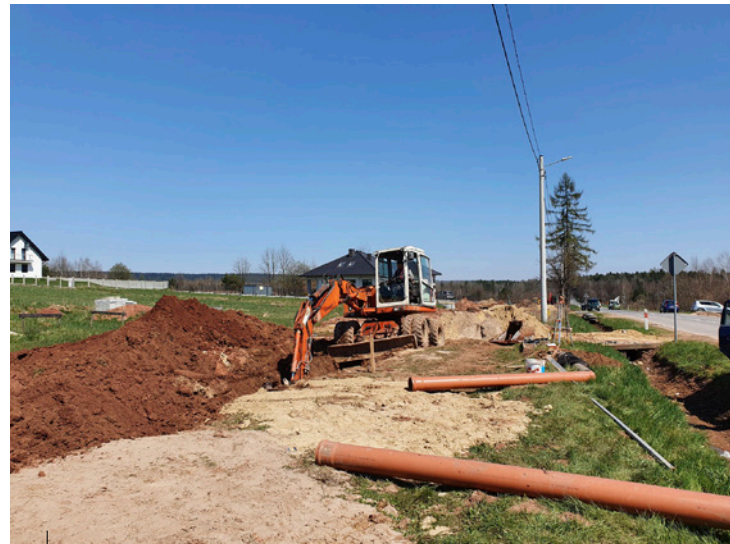
Budowa kanalizacji w Ćmińsku