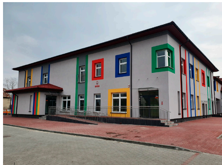
Nowo wybudowany samorządowy żłobek