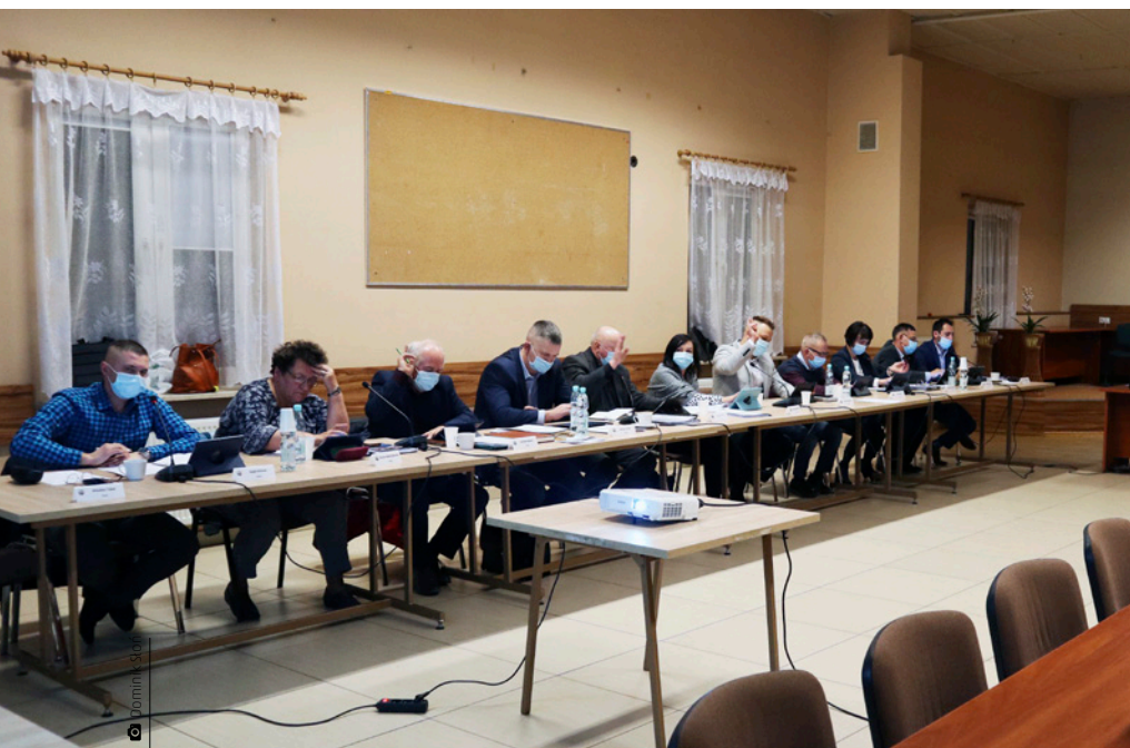
Posiedzenie Rady Gminy Miedziana Góra w dniu 25 listopada 2021 roku

Przychodzi mi do głowy, że jedyna opcja, która nam pozostaje, to zakopanie topora wojennego, schowanie swojej dumy i próba wypracowania wspólnego planu działania. Na pewno nie zadowolimy wszystkich, ale dążmy do tego, aby jak najwięcej mieszkańców skorzystało z naszych sił i naszej wiedzy. Nie marnujmy energii na udowadnianie racji, przeznaczmy ją lepiej na plany i na konkretne działania. Po to tu jesteśmy. ■