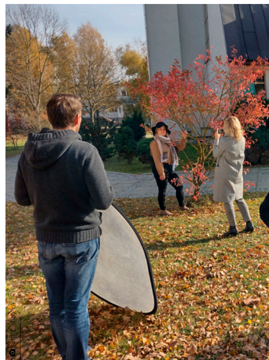
Dzięki kursowi fotograficznemu uczestniczki poznały obsługę aparatu

odbyły się pierwsze warsztaty. – Zależało nam na tym, aby mamy, które mają możliwość opieki nad pociechami w żłobku czy przedszkolu, zaczęły myśleć także o sobie i uwierzyły we własne siły, odkryły swoje talenty i zdobyły nowe, praktyczne umiejętności ułatwiające znalezienie zatrudnienia – tłumaczy dyrektor Opala. A skąd wiadomo, o jakie umiejętności chodziło? Z ankie-