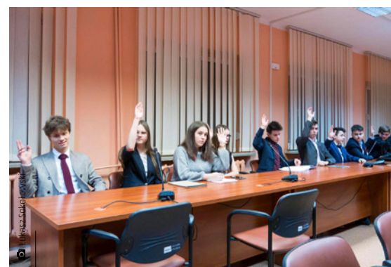
Jedno z pierwszych posiedzeń nowo powołanej rady młodzieżowej

uchwał. Śladem pracy radnych są również liczne interpelacje, opinie i apele. Nowe wyzwania oraz możliwości stoją przed obecnymi radnymi z nowym prezydium. Dla tej grupy nastolatków pojawia się okazja, aby nabyć i rozwinąć umiejętności pracy w zespole, komunikacji czy zarządzania czasem, a także poznać podstawy prawa na poziomie lokalnym i zasady funkcjonowania samorządu. Przewidziane wcześniej wybory radnych na kolejną kadencję MRG tymczasowo są wstrzymane ze względu na pandemię i wszelkie utrudnienia, jakie się z tym wiążą. – Współpraca z członkami Młodzieżowej Rady Gminy układała się pomyślnie i dostrzegam konieczność kontynuowania tej formy życia obywatelskiego, dlatego gdy tylko sytuacja się nieco polepszy, postaramy się