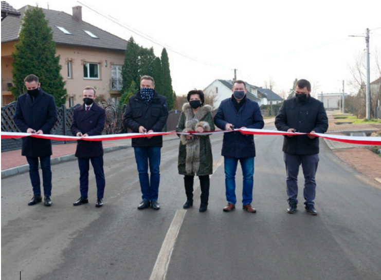
Uroczystość oddania do użytku ul. Laskowej w Kostomłotach Drugich