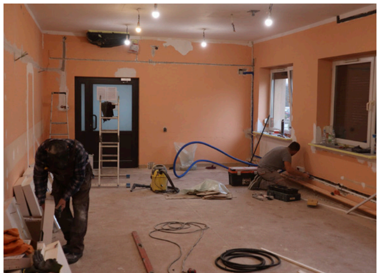
Remont sali konferencyjnej w Urzędzie Gminy