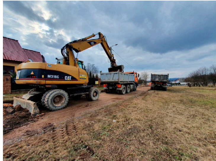
Rozpoczęcie remontu ul. Słonecznej w Miedzianej Górze