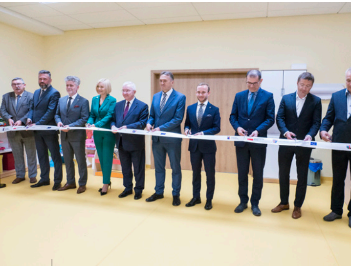
Uroczyste otwarcie nowych oddziałów żłobkowych z zaproszonymi gośćmi