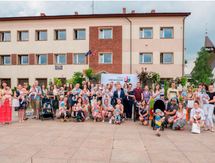
Akcja „Drzewko dla szczęśliwych rodziców”