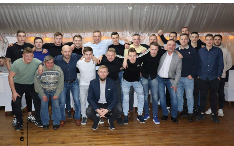
Drużyna Grodu Ćmińsk na imprezie kończącej rundę jesienną

GKS Gród Ćmińsk po 15 kolejkach sezonu 2021/2022 ligi okręgowej zdobył 33 punkty i zajął znakomite II miejsce w tabeli. – Zdecydowanie rok 2021 był bardzo udany dla naszej drużyny. Po rewelacyjnej rundzie wiosennej w A klasie walczyliśmy w pięknym stylu o awans do ligi okręgowej. Przed inauguracją w V lidze udało nam się przede wszystkim utrzymać kadre i dokonać kilku ciekawych transferów, które z perspektywy czasu okazały się przysłowiowym strzałem w dziesiątkę. Piękna gra na inaugurację i zwycięstwo dały drużynie niesamo-