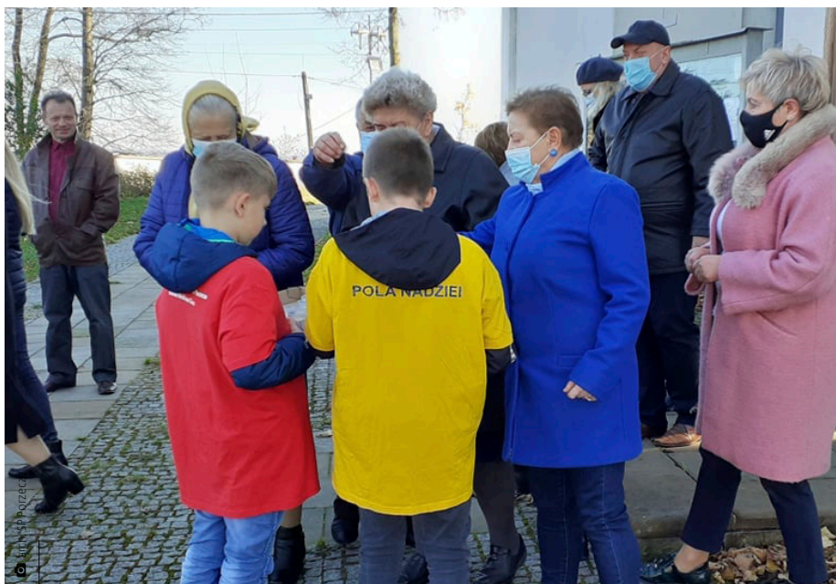
Młodzi wolontariusze ze Szkolnego Koła Caritas działającego w Szkole Podstawowej w Porzeczcu

Grudzień to czas oczekiwania na święta, ale też czas pomocy tym, którzy jej potrzebują. Nasi najmłodszy mieszkańcy co roku włączają się w akcję pomocy innym ludziom.