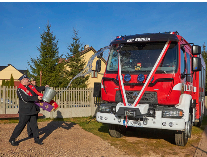
Uroczystość wprowadzenia samochodu do pododdziału bojowego w OSP Bobrza