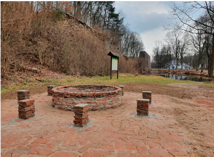
Strefa rekreacji w Bobrzy na terenie ruin Zakładu Wielkopiecowego