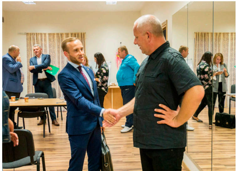
Cykl spotkań soteckich z mieszkańcami