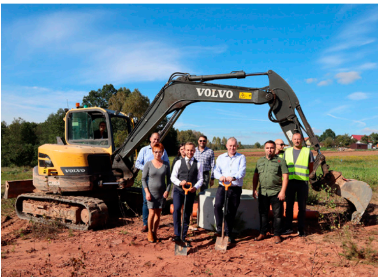
Wbicie topaty pod budowę systemu kanalizacji sanitarnej oraz rozbudowę i przebudowę sieci wodociągowej w Przyjmie