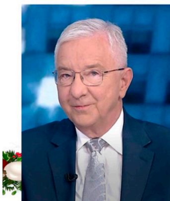
Krzysztof Lipiec Poseł na Sejm Rzeczypospolitej Polskiej