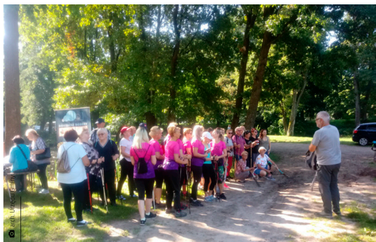
Piechurów sprzyjała wyborna pogoda, jak i piękne widoki na trasie

Rajd rozpoczął się od zapoznania uczestników przez przewodnika z historią Zakładu Wielkopieczowego w Bobrzy. Następnie członkini ekipy Kijowe Lejdis przeprowadziła