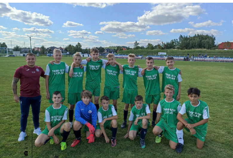
Drużyna trampkarzy młodszych Wichru Miedziana Góra