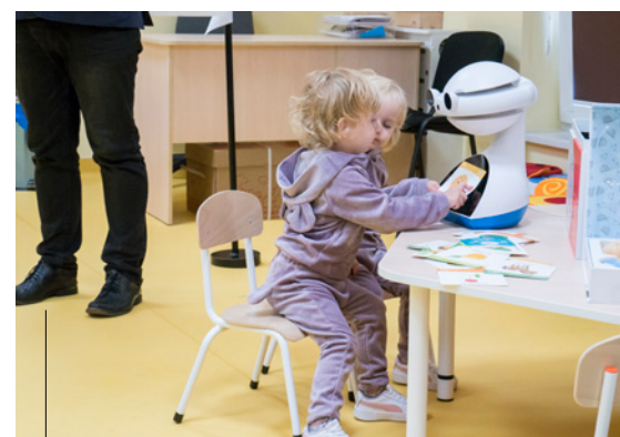
Pierwsi żłobkowiec testują innowacyjnego robota do nauki

Przybliżona wartość miesięcznego wsparcia w ramach projektu „Aktywni rodzice = szczęśliwe maluchy!” dla jednego rodzica to 1 400 złotych.