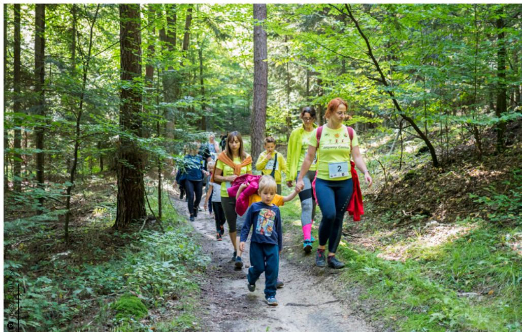
W rajdzie uczestniczyła spora grupa najmłodszych entuzjastów pieszych wędrówek