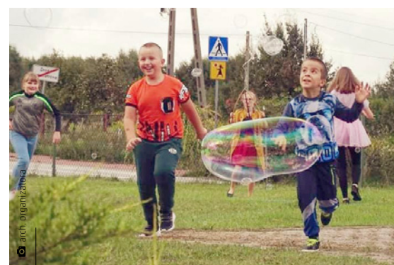
Pożegnanie lata na festynie zorganizowanym przez „Porzeczaneczki”

Wesoło i rodzinnie mieszkańcy Porzecza mogli spędzić ostatnie dni waka-