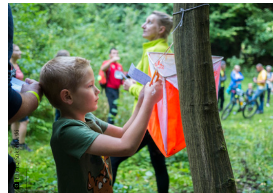
Kamieniołom Wykień był jednym z punktów kontrolnych na trasie rajdu

Kim tak naprawdę byli dawni gwarkowie? Samo to określenie pochodzi z języka niemieckiego, ein Gewerke , co oznacza kogoś, kto jest właścicielem kopalni lub organizatorem produkcji. Aby móc założyć kopalnię, gwarek musiał otrzymać od właściciela ziemi fryszt, czyli pozwolenie na wydobywanie złóż. W przypadku rejonu Miedzianej Góry frysztu udzielali biskupi krakowscy. Co