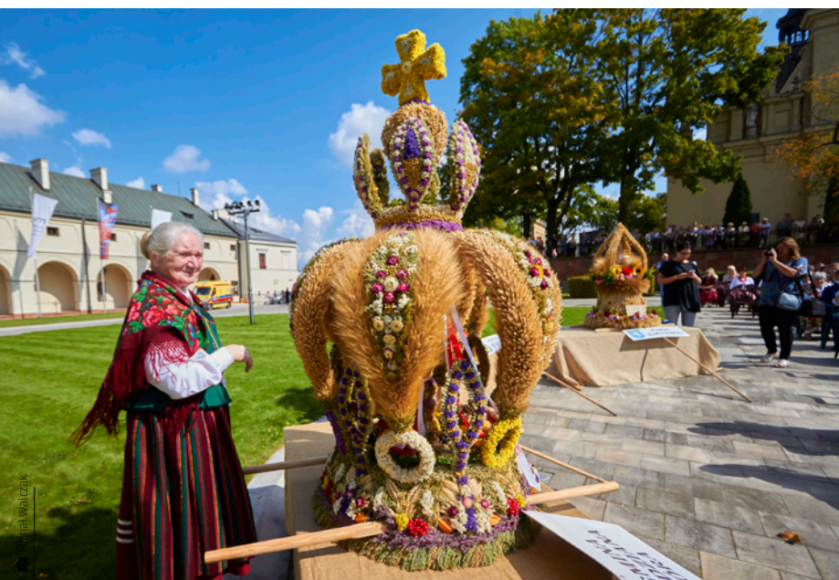
Zwycięski wieniec na dożynkach wojewódzkich w Kielcach

szczyście ścinana i wręczana najlepszym żniwiarkom do uwicia wieńca. Do jego przybrania używano kiści jarzębiny, orzechów, owoców, kwiatów i kolorowych wstążek. Tradycyjne wieńce dożynkowe miały zwykle kształt wielkiej korony lub koła. Wieniec dożynkowy przechowywany był w stodole do kolejnego roku, do nowego siewu.