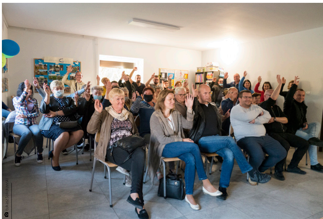
Spotkanie wiejskie z mieszkańcami w Tumlinie-Wyknii

Porzeczce z kolei na zwiększenie gotowości bojowej OSP Bobrza przeznaczyło 1 000 złotych, na zagospodarowanie terenu wokół świetlicy – 23 000