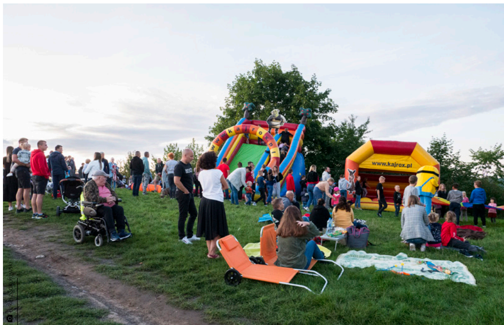
Obchody Dnia Sąsiada na Górze Jana to już cykliczna impreza dla mieszkańców