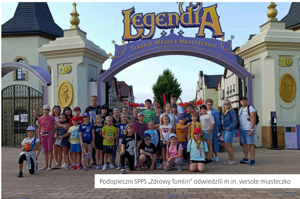
Podopieczni SPPS „Zdrowy Tumlin” odwiedzili m.in. wesołe miasteczko