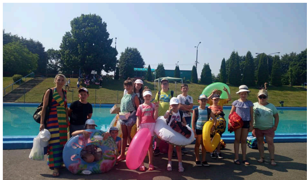
Klub „Wolna Strefa” zaprosił dzieciaki na basen