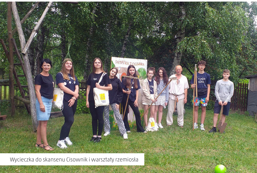
Wycieczka do skansenu Cisownik i warsztaty rzemiosła