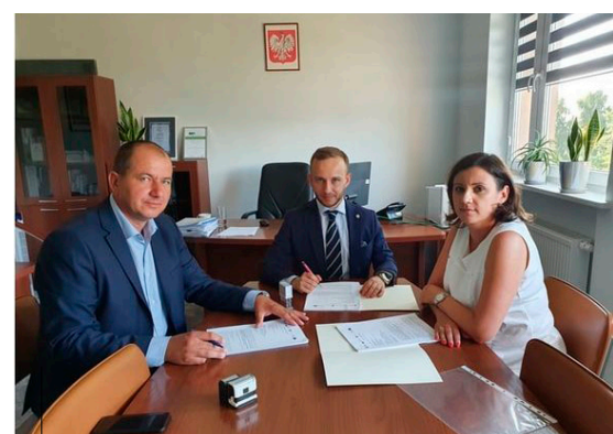
Już niedługo w Przyjmiu rozpocznie się budowa kanalizacji i rozbudowa wodociągu wraz z usunięciem azbestowych rur