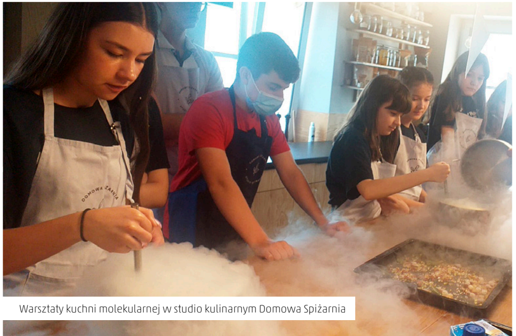
Warsztaty kuchni molekularnej w studio kulinarnym Domowa Spizarnia