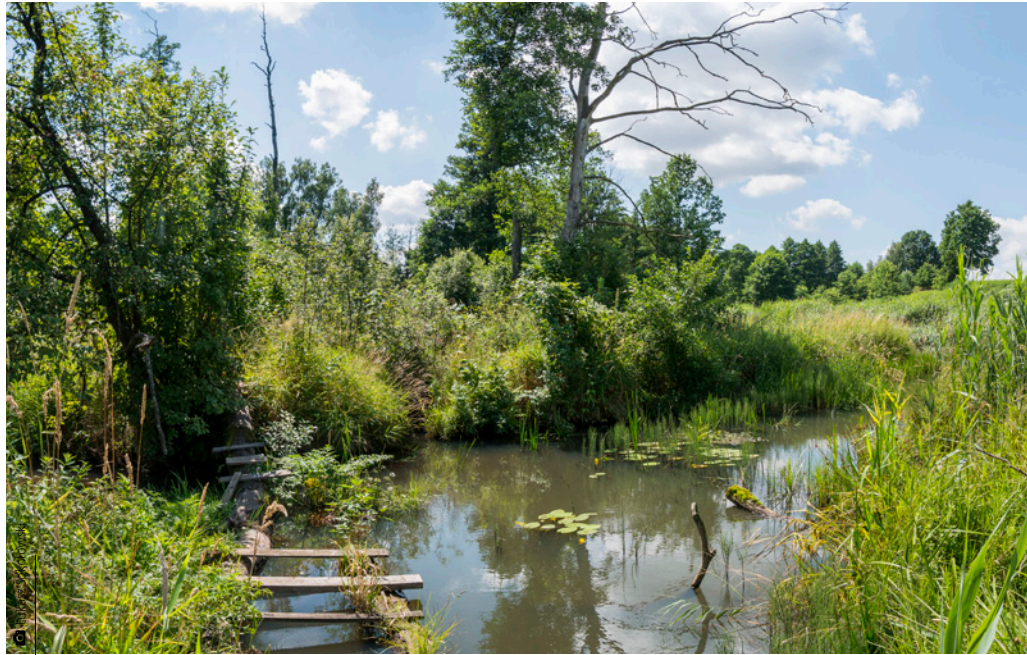
Piękne rozlewisko na rzece Bobrza przy Kobylakach

jako użytek ekologiczny o powierzchni ok. 5 hektarów. Porasta je typowa roślinność bagienna, natomiast granicę wyznacza otaczający las. Bagna śródleśne nazywano dawniej ługami, zaś od kwitnącej tu wełnianki często mówiono o tym miejscu „białe ługi”. Teren jest stale podmokły i stanowi torfowisko przejściowe. Występują tu rzadkie zespoły roślinne – dominuje przygiełka biała oraz zbiorowiska szuwarowe z udziałem trzciny pospolitej, pałki szerokolistnej i pałki wąskolistnej oraz jeżogłówki gałęzistej. Rosną tu także