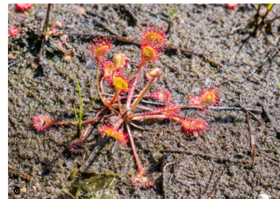
Rosiczka długolistna występująca na bagnie

Na wschód od wsi Bugaj, na prawo od trasy Kostomłoty–Strawczyn znajdziemy bagno – podmokły teren chroniony