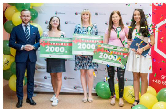
Uroczystość wręczenia nagród w pierwszej loterii podatkowej

Dumie z miejsca zamieszkania może towarzyszyć także radość z rozliczenia podatku. Niemożliwe? A jednak! Okazuje się, że 38% środków pochodzących z podatku od osób fizycznych jest przekazywanych gminie, w której ten podatnik mieszka. Samorząd może je dowolnie wykorzystać. Innymi słowy – trafiają one ponownie w ręce mieszkańców Miedzianej Góry. To pieniądze na nowe drogi, remonty i inne inwestycje. Dodatkowo w ramach akcji „Rozlicz PIT w Miedzianej Górze! To Ci się opłaci!” nasi mieszkańcy mieli możliwość udziału w loterii z nagrodami. Do wygrania były vouchery pieniężne o wartości