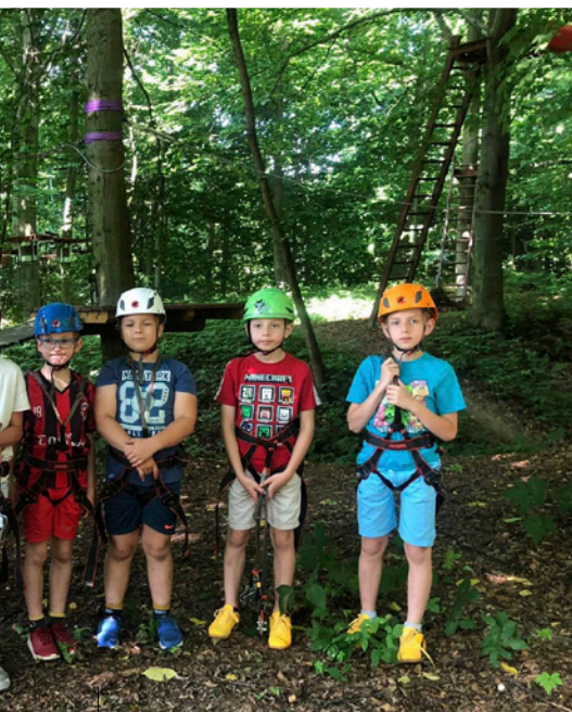
Uczestnicy półkolonii „Plusika” tym razem w parku linowym

Wakacje to dla uczniów upragniony okres „nicnierobienia”. Jednak letni odpoczynek może być także czasem intensywnego rozwoju dzieci. Wypoczynek i słoneczne dni wpływają pozytywnie