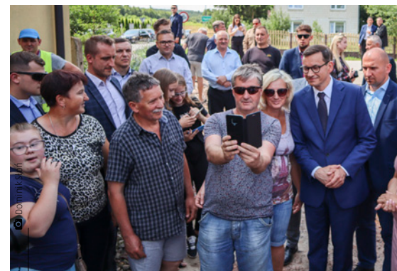
Premier znalazł również czas na rozmowę i zdjęcia z mieszkańcami

– W czasie spotkania premier zapewnił mnie, że „Polski Ład” i specjalne dedykowane mu programy doprowadzą do przełomu w małych miejscowościach. Znacznie więcej środków finansowych skierowanych zostanie właśnie do takich miejscowości jak nasza. Będę robił wszystko, aby w najbliższych latach jak najwięcej skorzystać z tego programu. Chciałbym, aby Miedziana Góra stała się ważnym beneficjentem „Polskiego Ładu” – powiedział po brie-