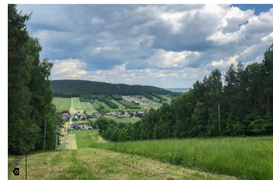
Widok na Górę Grodową ze szczytu wyciągu narciarskiego

nie. Internet jednak szybko tłumaczy – słup i płyta to praca dyplomowa studenta architektury, który dokładnie wyliczył punkt podparcia. Z kamieniołomu po małych perturbacjach z zagubioną ścieżką wracamy na czerwony szlak i chyżo ruszamy pod górę. Podejście jest strome, ale szybko zdobywam szczyt. Tu czeka na nas kolejne zejście ze szlaku w kierunku pozostałości po skoczni narciarskiej. Przechodzimy dalej grzbietem Góry Wykieńskiej i docieramy na szczyt działającego zimą stoku narciarskiego. Podziwiam widoczną z naprzeciwka Grodową i czuję się tak, jakbym była co najmniej w Beskidach. Wracam na czerwony szlak, bo naszym następnym celem jest Góra Kamień i jej fantazyjne skalne monolity. Dopiero lektura przewodników wyjaśnia, że choć Kamień i Góra Wykieńska stoją obok siebie, różni je budowa geologiczna i okres powstania.