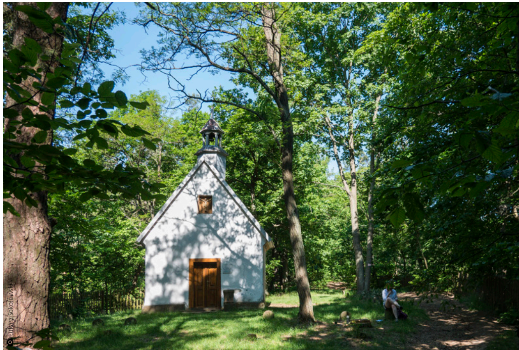
Kaplica Przemienienia Pańskiego na Górze Grodowej

Rażno drepczemy dalej w kierunku Ciosowej. Krajowa droga 74 w Miedzianej Górze wita nas niemożliwym hałasem i szumem. Szybko uciekamy do kolejnego kamieniołomu. Tu spotykamy turystę z Koszalina, który zmierza do Kuźniaków i kończy czterodniową wyprawę przez Główny Szlak Świętokrzyski. Cieszy się z naszego towarzystwa, bo samotność zaczęła mu powoli doskwierać. Miła pogawędka mija i nie wiadomo kiedy stajemy w Porzeczu i się żegnamy.