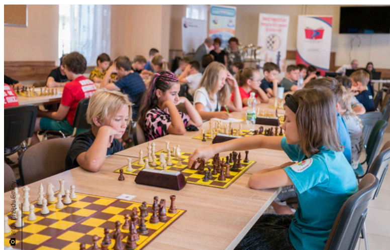
W turnieju wzięło udział 37 zawodników

Turniej został zgłoszony do oceny Międzynarodowej Federacji Szachowej (FIDE) i przebiegał zgodnie z obowiązującymi przepisami gry FIDE i Kodeksem Szachowym Polskiego Związku Szachowego. Rozgrywki o Puchar Wójta Gminy Mie-