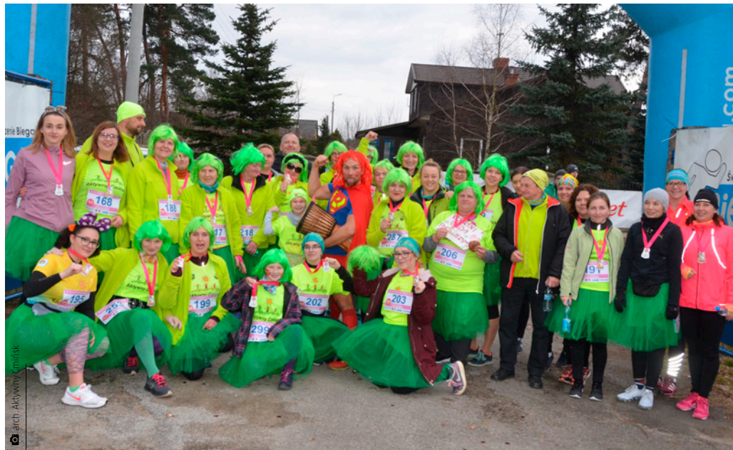
Nie cyckamy się z rakiem – barwny Suchedniowski Bieg Kobiet 2020

ce się powodzeniem imprezy. Zdołaliśmy uczcić Dzień Babci i Dziadka, Dzień Kobiet i zorganizować Aktywne Disco Party podczas morsowania, które zgromadziło, nie bagatela, ponad 300 osób. Z nadzieją wchodzimy w nowy rok, wierząc, że uda nam się kontynuować wydarzenia, na które ludzie czekają. Planujemy zainicjować zimową edycję Biegu wokół Góry Grodowej, zakończyć sezon morsowania złotem morsów, spróbować morsowania w morzu. Postaramy się nie zawieść ludzi, którzy w sens naszej pra-