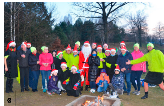
Mikołajkowe morsowanie nad zalewem Umer

– Obecna sytuacja i nam pokrzyżowała plany. W ubiegłym roku, jubileuszowym, stworzyliśmy specjalny kalendarz, zaznaczając na nim cykliczne, cieszą-