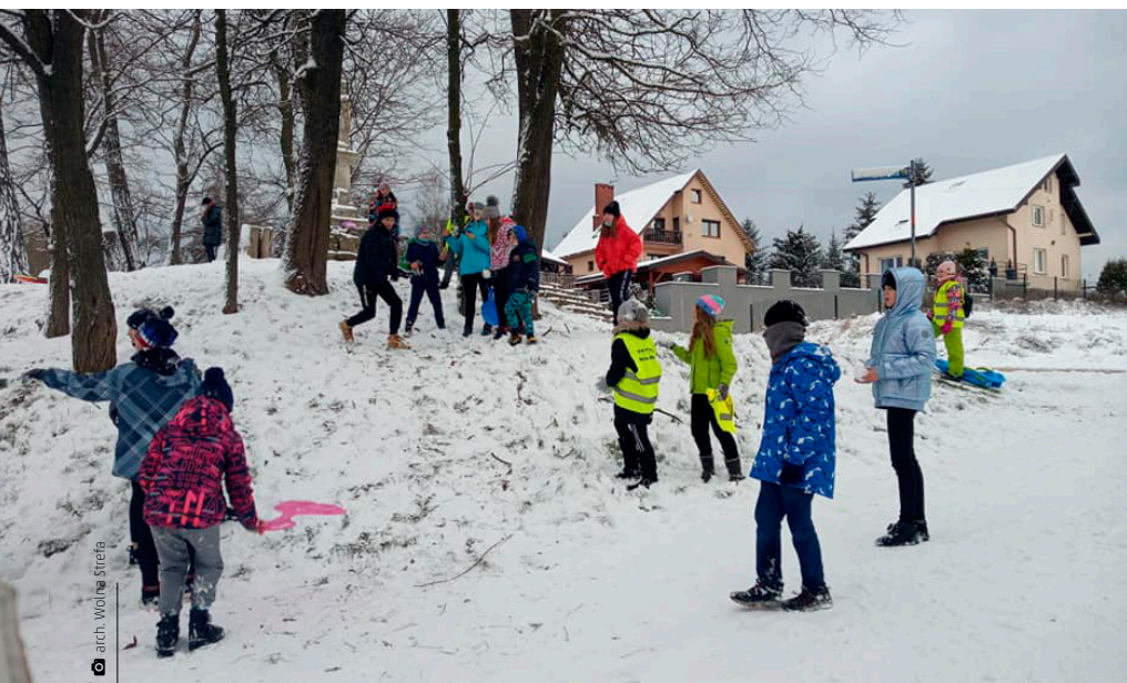
W zdrowym ciele zdrowy duch - taka idea przyświecała feriom zorganizowanym przez Klub Młodzieżowy Wolna Strefa w Kostomłotach Pierwszych

Z kolei dzieci z klas I–IV ze Szkoły Podstawowej w Kostomłotach Drugich uczestniczyły w półkolonijnych zajęciach sportowo-rekreacyjnych zorganizowanych przez Stowarzyszenie GLKS Wicher w Miedzianej Górze. Wzięło w nich udział ponad 30 dzieci podzielonych na grupy. Podczas półkolonii odbyły się warsztaty z trenerem mentalnym (psychologiem sportu), został zorganizowany wykład z funkcjonariuszem policji na temat bezpiecznych ferii oraz zajęcia profilaktyczne. W ciągu dnia młodzi zawodnicy Wichru odbyli dwa treningi piłkarskie na hali oraz dodatkowo wzięli udział w rozgrywkach unihokeja, tenisa stołowego i bilardu. Nie brakowało także zabaw na powietrzu. Chłopcy lepiłi bałwana oraz rozegrali