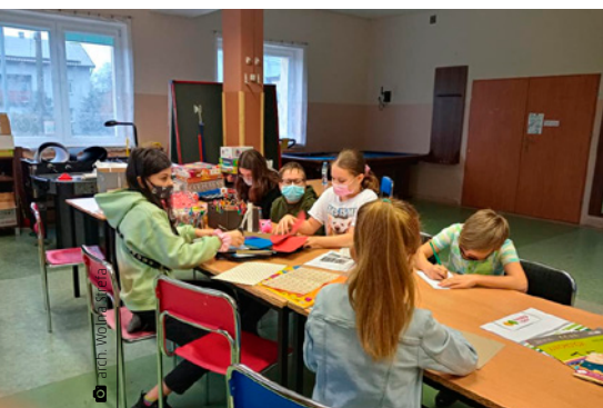
Podopieczni Wolnej Strefy wykonują laurki dla swoich babć i dziadków

nizacje: Wicher Miedziana Góra i Klub Młodzieżowy „Wolna Strefa Kostomłoty” wyszły naprzeciw potrzebom mieszkańców i pomogły zorganizować wolny czas dzieciakom. Dzięki nim