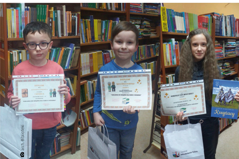
Laureaci pierwszych miejsc w konkursie na najładniejsze zakładki do książek dla babci i dziadka

Dzięki zgłębianiu wiedzy o swojej małej ojczyźnie dowiadujemy się czegoś o sobie i o społeczności, z której się wywodzimy. Taki cel przyświeca pomysłodawcy projektu „Dawniej a dziś w Miedzianej Górze”, Gminnej Bibliotece Publicznej, która zdobyła grant na jego realizację w ramach programu „Równać szanse” Polsko-Amerykańskiej Fundacji Wolności i Polskiej Fundacji Dzieci i Młodzieży. Biblioteka zaprosiła do udziału