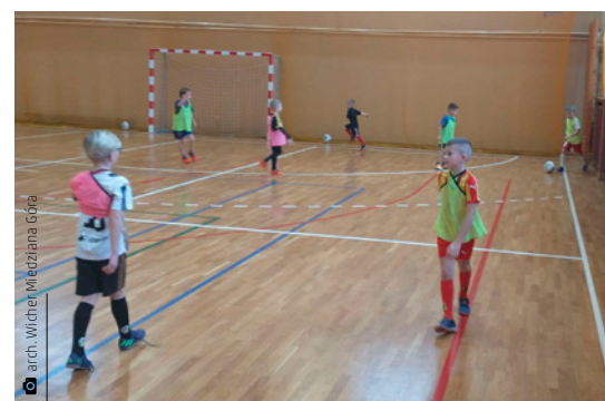
Ferie z Wichrem nie mogły się odbyć bez treningu piłkarskiego

dziwiania przyrody można było solidnie się zmęczyć z korzyścią dla organizmu. Młodzi ludzie mnóstwo czasu spędzali na spacerach po okolicy i wspólnych zabawach na śniegu. Oprócz tego odbywała się cała paleta różnych zajęć wewnątrz budynku: plastycznych, językowych, pedagogicznych czy ukierunkowanych rozmów profilaktycznych. W ramach projektu unijnego przeprowadzono warsztaty psychologiczne ze wspólnym oglądaniem seansu pt. „W głowie się nie mieści” i późniejszą dyskusją na temat refleksji po obejrzanym materiale. Z kolei na zajęciach muzycznych dzieci przygotowały się do występu wokalnego w tegorocznej festostrefie online. Uczestniczki pod okiem opiekunki opracowały trzy wy-