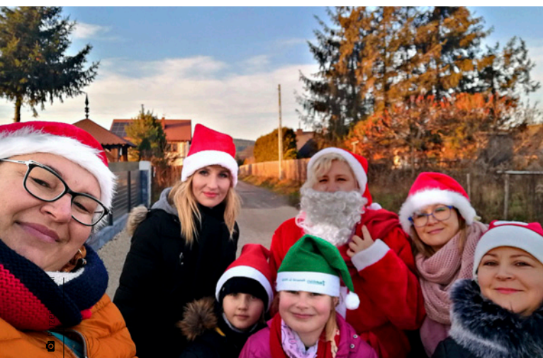
Mikołajkowa akcja rozdawania mydełek mieszkańcom Porzecza

Zeszły rok był trudnym czasem i ogromnego znaczenia nabrały przedsięwzięcia, za sprawą których ludzie mogli poczuć, że stanowią wspólnotę. Na wysokości zadania stanęły Porzeczaneczki, czyli członkinie Koła Gospodyń Wiejskich w Porzeczu. We wrześniu podsumowały projekt „Smakuj zdrowie u Porzeczaneczek”, którego uczestniczki zbierały zioła, kwiaty i pędy po to, by zrobić z nich różne przetwory – syropy, pachnące sa-