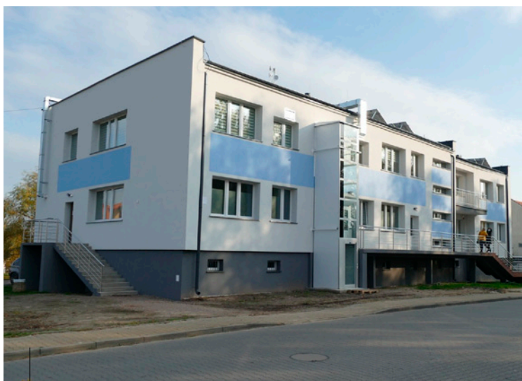
Budynek Samorządowego Ośrodka Zdrowia po zakończonej termomodernizacji