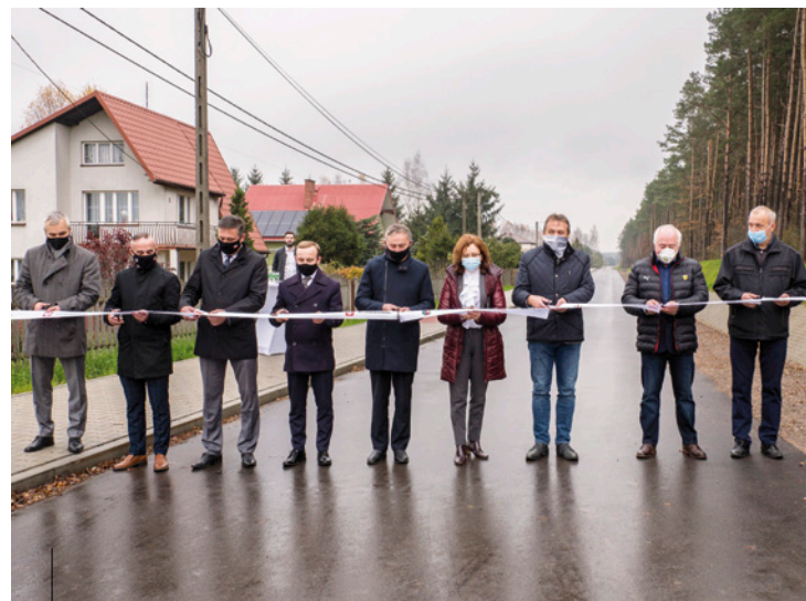
Uroczyste oddanie do użytku ulicy Leśnej w Ciosowej