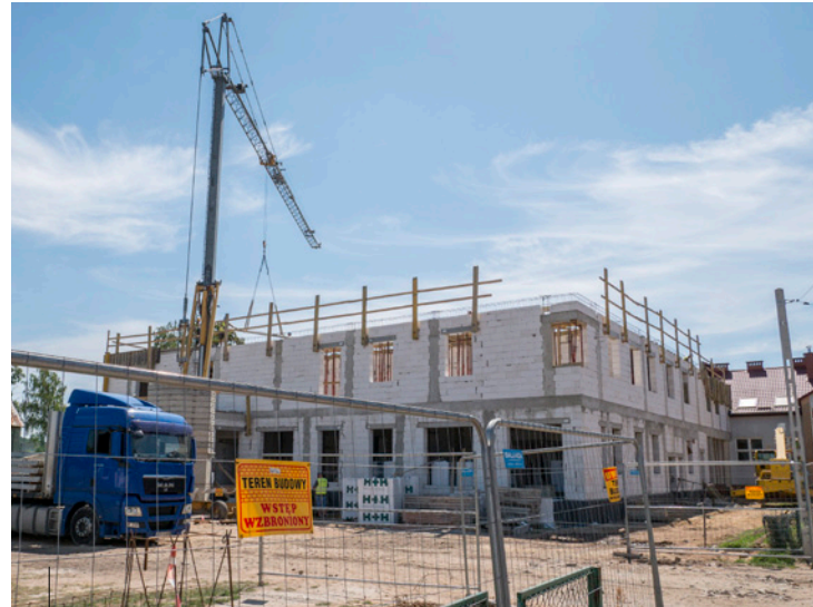
Plac budowy samorządowego żłobka