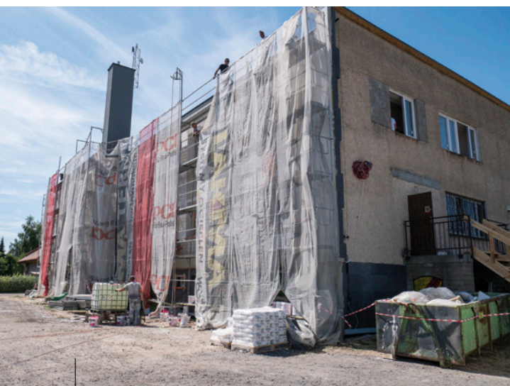
Termomodernizacja Samorządowego Ośrodka Zdrowia w Miedzianej Górze