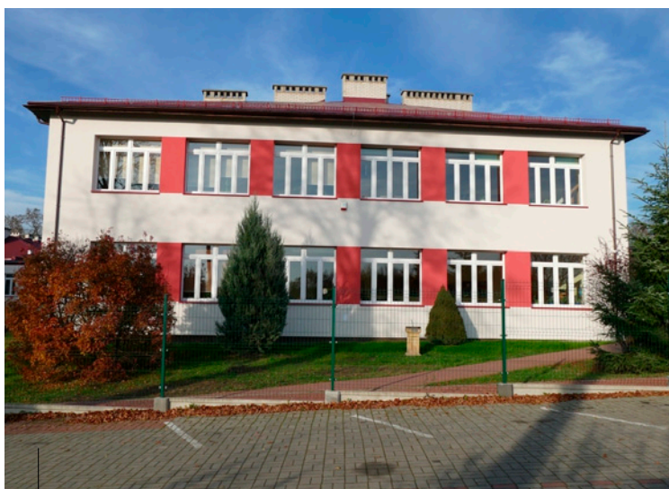
Gmach Szkoły Podstawowej w Ćmińsku po zakończonej termomodernizacji