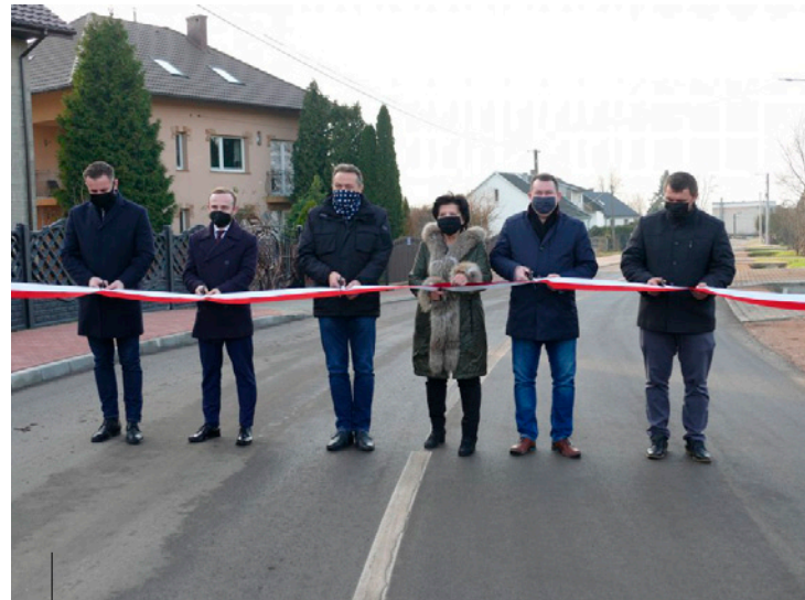
Uroczyste oddanie do użytku ulicy Laskowej w Kostomłotach Drugich