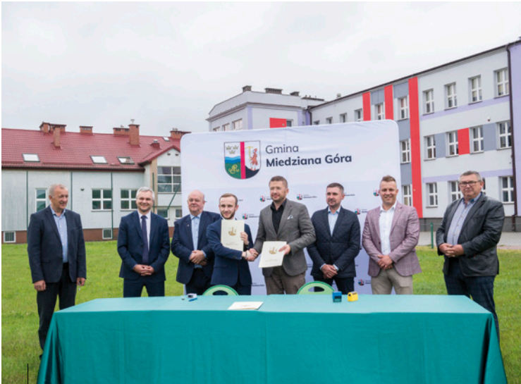
Podpisanie umowy z wykonawcą na budowę pierwszego samorządowego żłobka w gminie Miedziana Góra