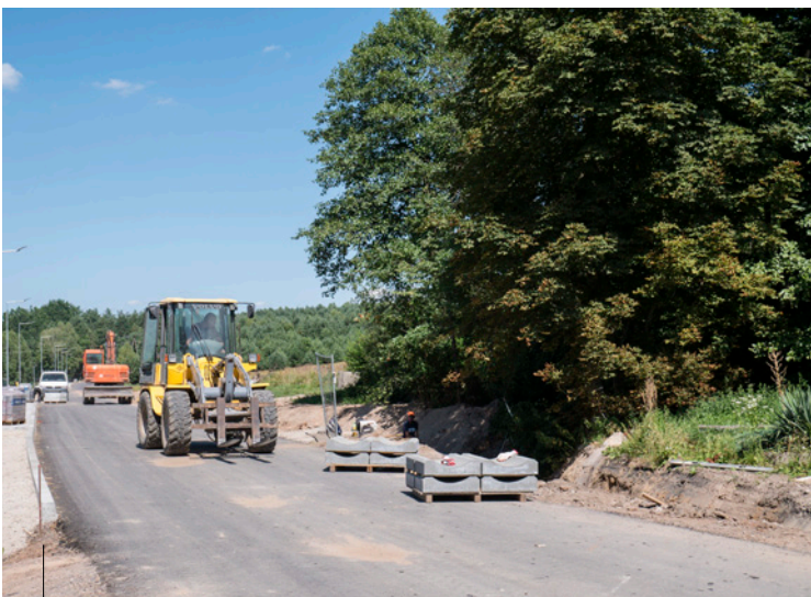
Rozbudowa ulicy Leśnej w Ciosowej