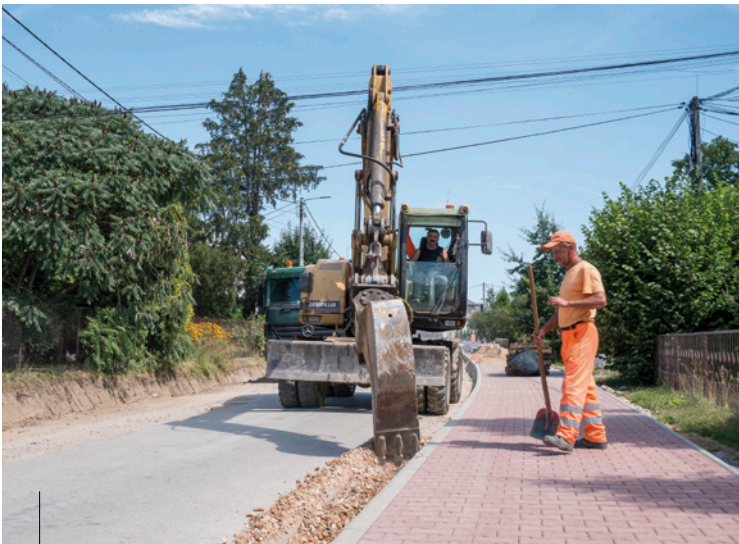
Rozbudowa ulicy Laskowej w Kostomłotach Drugich - inwestycja realizowana wspólnie z powiatem kieleckim