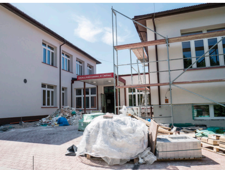
Termomodernizacja Szkoły Podstawowej w Ćmińsku