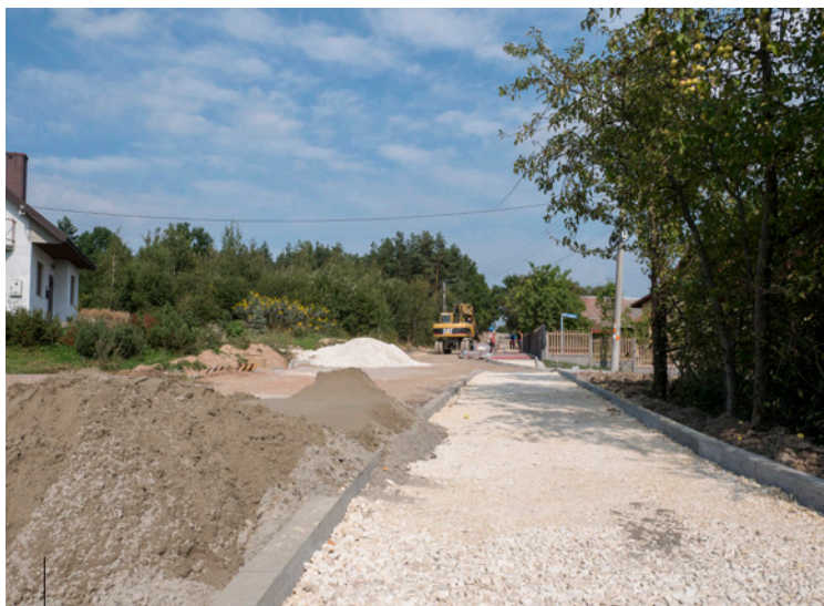
Kontynuacja przebudowy ulicy Kamiennej w Miedzianej Górze