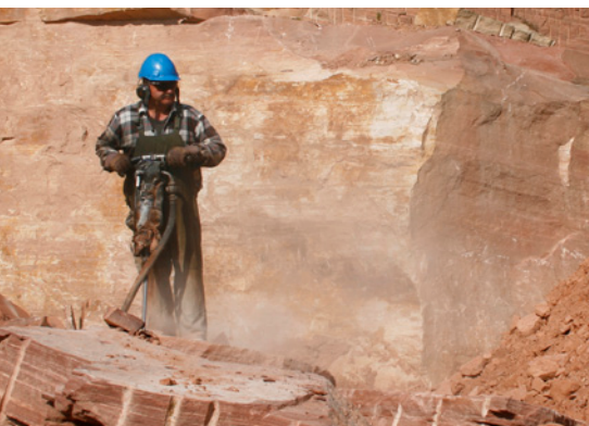
▼ Współczesny górnik w kamieniołomie Tumlin

świętej Barbary, popularną barbórkę. Barwne defilady, w których udział biorą orkiestry górnicze oraz sami górnicy ubrani w tradycyjne mundury, sta-