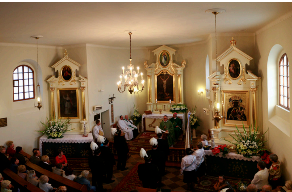
▲ Kaplica św. Barbary w Miedzianej Górze odnowiona została w 2011 roku, z tej okazji została odprawiona uroczysta msza święta