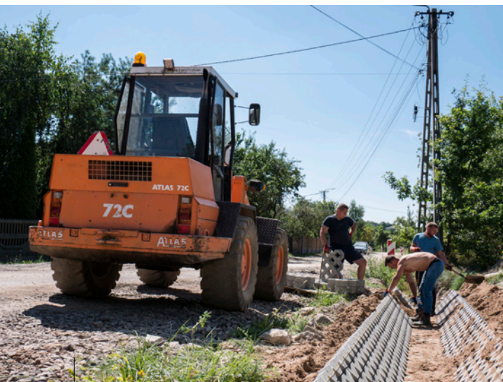
Przebudowa ulicy Kamiennej w Miedzianej Górze