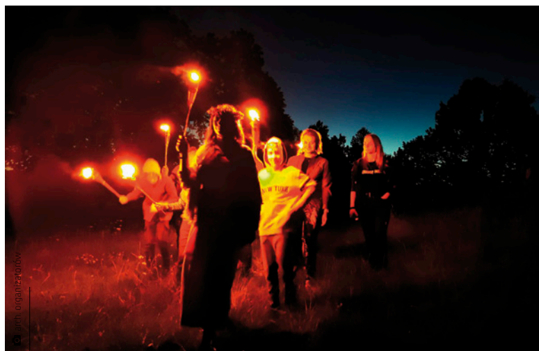
„Słowiańskie Bajduły” to wieczorny spacer z pochodniami, nawiązujący do świętokrzyskich legend i słowiańskiej mitologii