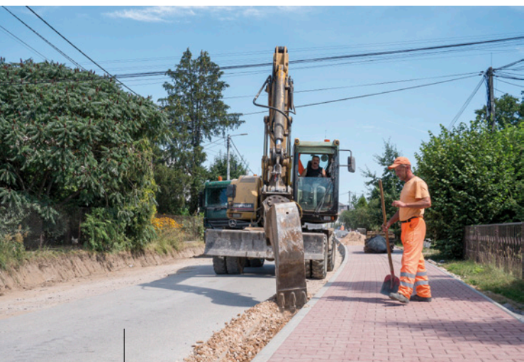
Rozbudowa ulicy Laskowej w Kostomłotach Drugich (inwestycja realizowana wspólnie z Powiatowym Zarządem Dróg w Kielcach) Wartość inwestycji: 5 201 190,32 złotych | Dofinansowanie z Funduszu Dróg Samorządowych: 2 600 595,16 złotych