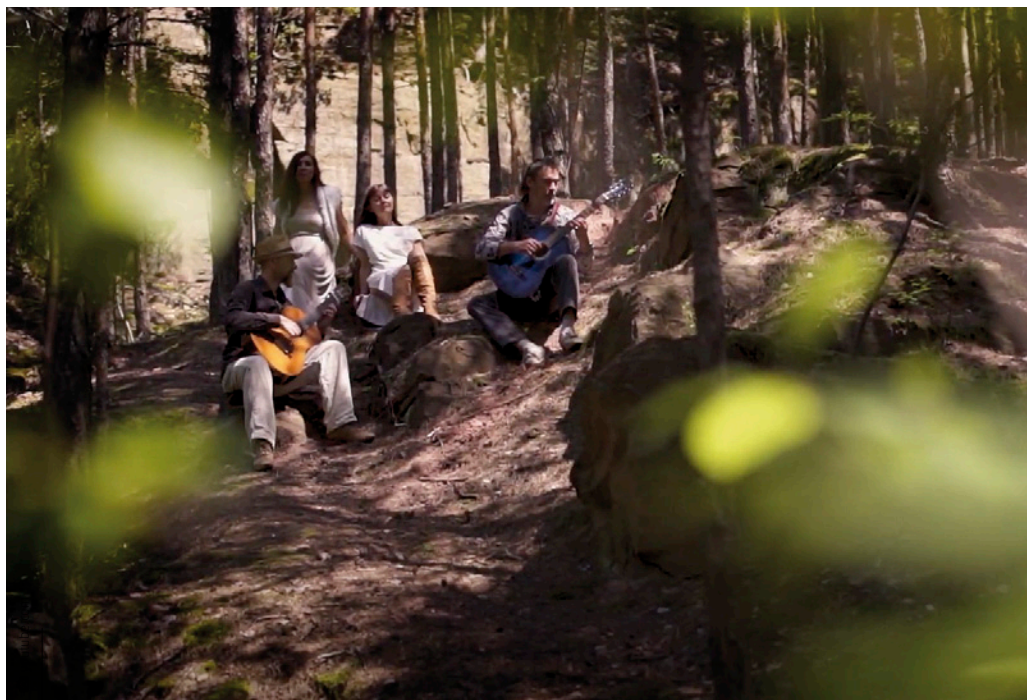
Teledysk Gędzkiego Chóru kręcony m.in. w malowniczej scenerii kamieniołomu Ciosowa ▲ Na Torze Kielce kręcono ujęcia pościgów samochodowych do filmu „Diablo. Wyścig o wszystko” ▼