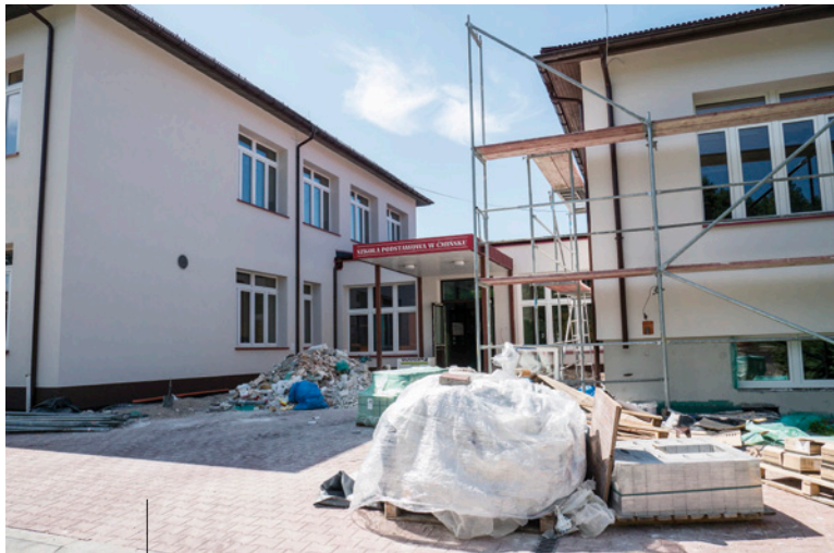
Termomodernizacja Szkoły Podstawowej w Ćmińsku wraz z remontem 10 sal dydaktycznych i 13 łazienek z dostosowaniem do potrzeb osób niepełnosprawnych Wartość inwestycji: 3 863 000,00 złotych | Dofinansowanie z Unii Europejskiej: ok. 3 298 601,24 złotych