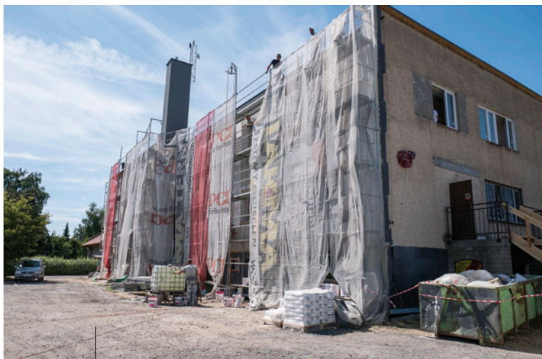
Termomodernizacja Samorządowego Ośrodka Zdrowia w Miedzianej Górze wraz z budową windy osobowej Wartość inwestycji: 1 740 122,48 złotych | Dofinansowanie z Unii Europejskiej: ok. 1 124 577,66 złotych