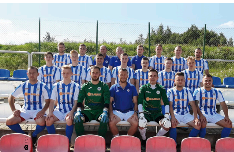
Drużyna Wichru Miedziana Góra na sezon 2020/21