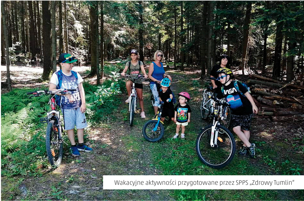
Wakacyjne aktywności przygotowane przez SPPS „Zdrowy Tumlin”