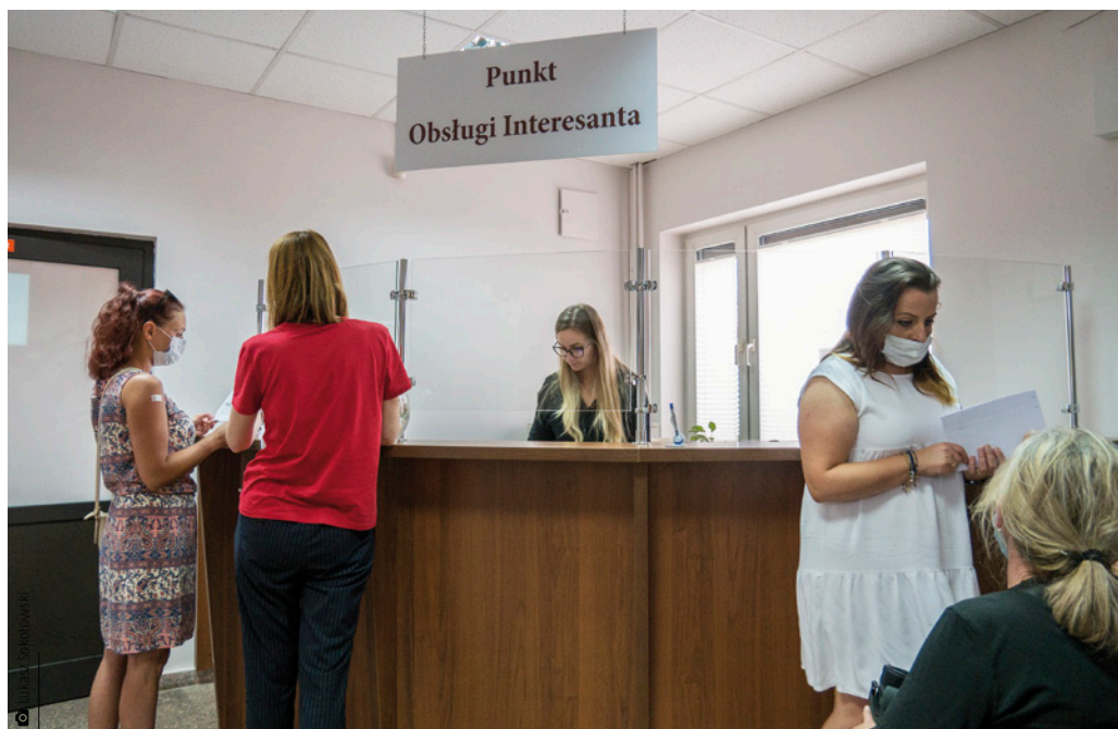
W punkcie można pobrać wszystkie obowiązujące wzory wniosków i druków oraz uzyskać dokładne informacje na temat sposobu załatwiania spraw w urzędzie gminy

średnio przy okienku Punktu Obsługi Interesanta, jak również w pokojach urzędu może znajdować się tylko jedna osoba. Czekać na obsługę, trzeba zachować odpowiednią, bezpieczną odległość. – Dotychczasowa praca idzie dosyć sprawnie; część spraw, z którymi zwracają się petenci, jest rozwiązywana od razu przy okienku. Są wydawane także potrzebne druki, natomiast ci, którzy muszą skonsultować swoją sprawę z urzędnikiem, kierowani są bez zwłoki do odpowiedniego pokoju,