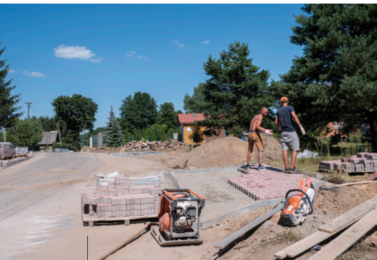
Rozbudowa ulicy Leśnej w Ciosowej i Ćmińsku Wartość inwestycji: 2 981 801,29 złotych | Dofinansowanie z Funduszu Dróg Samorządowych: 1 789 080,00 złotych