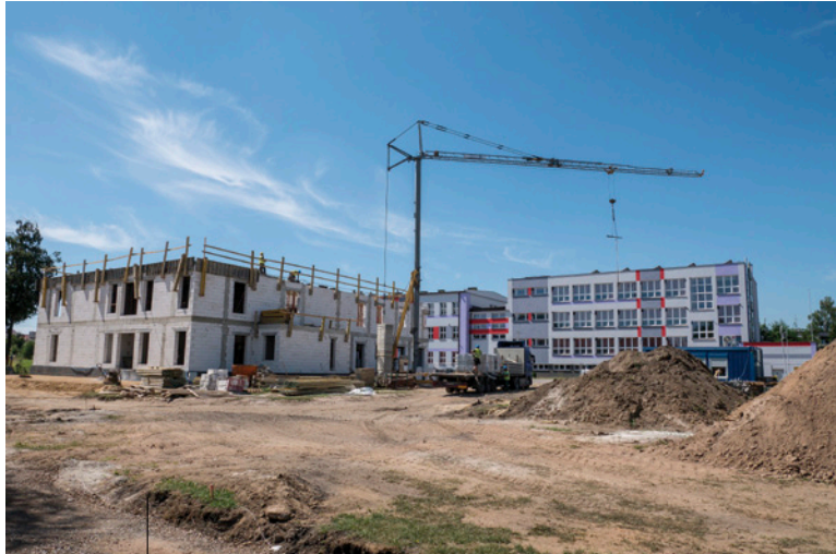
Budowa Samorządowego Żłobka w Kostomłotach Drugich Wartość inwestycji: 4 846 200,00 złotych | Dofinansowanie z Maluch+: 1 287 000,00 złotych Dofinansowanie z Unii Europejskiej: ok. 932 036,77 złotych (wykończenie obiektu wewnątrz oraz zakup pierwszego wyposażenia)