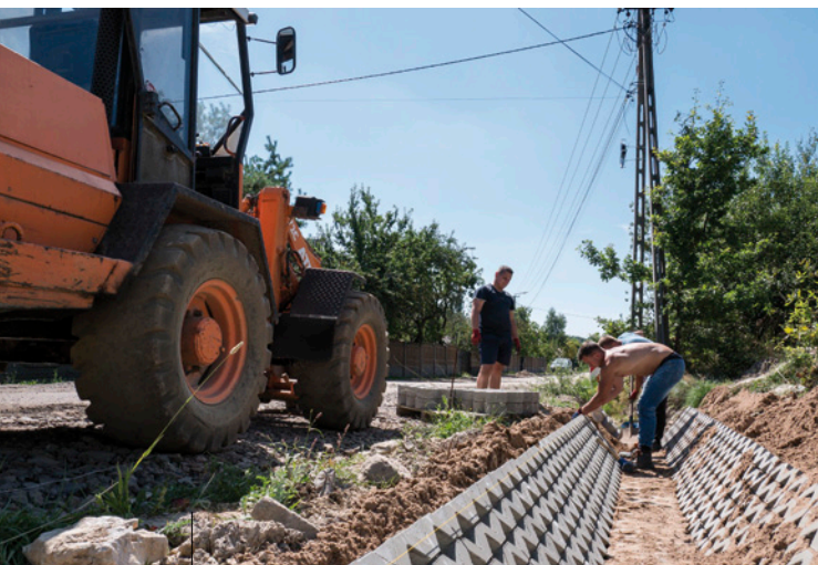
Przebudowa ulicy Kamiennej w Miedzianej Górze Wartość inwestycji: 832 530,00 złotych | Dofinansowanie z Funduszu Dróg Samorządowych: 499 518,00 złotych