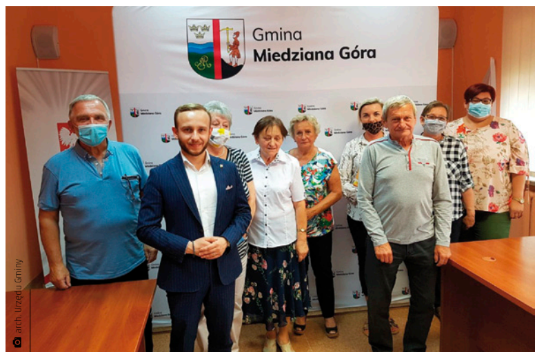
Lokalne stowarzyszenia i fundacje stanowią nieocenioną pomoc w angażowaniu się w inicjatywy społeczne i integrację mieszkańców

Przedmiotem dyskusji były perspektywy dalszej współpracy w czasach panującej pandemii, wobec której część zadań i imprez zaplanowanych przez organizacje pozarządowe na ten rok została odwołana, a umowy aneksowano lub rozwiązano. Pomimo zaskoczenia, jakie wywołała pandemia i wprowadzone w jej wyniku restrykcje, większość organizacji próbuje sobie radzić w tej trudnej sytuacji. Na spotkaniu zastanawiano się, jak wykorzystać środki finansowe przeznaczone na tego typu działalność, tak by sprostać sytuacji epidemiologicznej, jednocześnie najefektywniej wykorzystując możliwości. Negatywne skutki epidemii mogą obejmować: zamknięte szkoły, świetlice, domy kultury, boiska, obiekty