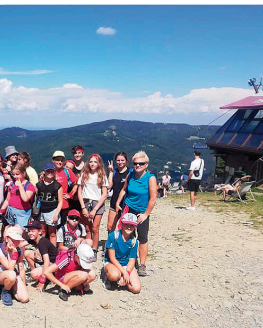
Klub młodzieżowy „Wolna Strefa” również nie pozwolił na nudę w wakacje

Wakacje to dla dzieci upragniony okres „nicnierobienia”. Jednak letni odpoczynek może być także czasem ich intensywnego rozwoju. Wypoczynek i słoneczne dni wpływają pozytywnie na