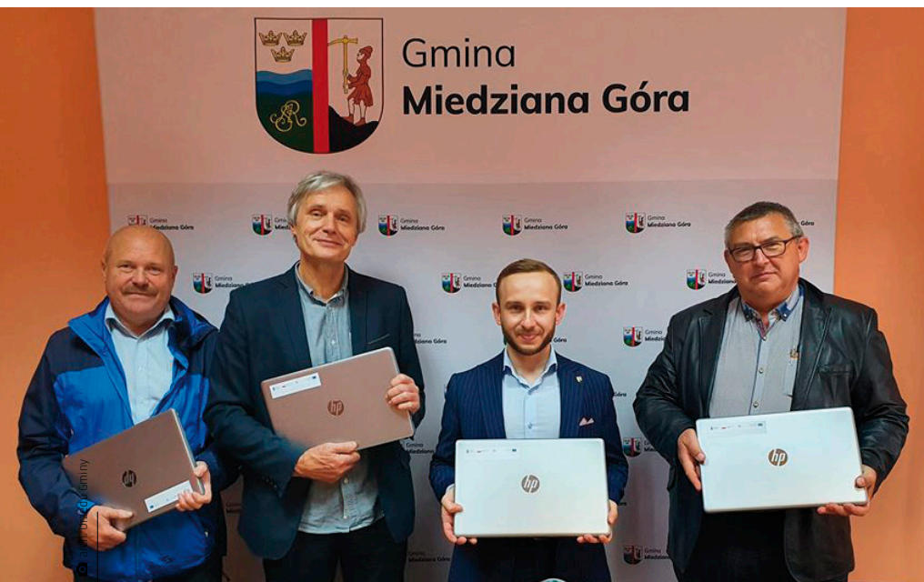
Wójt wraz z dyrektorami gminnych placówek oświatowych i przekazaniem sprzętem komputerowym zakupionym w ramach projektu „Zdalna Szkoła Plus”

Szkoła Podstawowa w Ćmińsku to kolejna placówka po Zespole Szkół w Kostomłotach i Szkole Podstawowej w Porzeczcu, którą czekają prace termomodernizacyjne: docieplanie budynku także poprzez wymianę okien i drzwi, remont instalacji CO i CWU, modernizacja pod kątem osób niepełnosprawnych. Zamontowane zostaną też panele fotowoltaiczne. Wszystkie te prace planowane są na tegoroczne wakacje. Termomodernizacja realizowana jest w ramach projektu „Termomodernizacje budynków użyteczności publicznej na terenie gminy Miedziana Góra” współfinansowanego przez Unię Europejską ze środków Europejskiego Funduszu Rozwoju Regionalnego w ramach RPO WŚ 2014-2020 – ZIT KOF. Natomiast środki na remont sal i łazienek oraz zakup pomocy multimedialnych i dydaktycznych pozyskano z projektu „Rozwój infrastruktury szkół podstawowych w gminie Miedziana Góra” współfinansowanego przez Europejski Fundusz Rozwoju Regionalnego w ramach Programu Operacyjnego Województwa Świętokrzyskiego na lata 2014–2020.