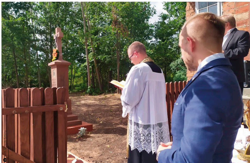
Zeszłoroczne uroczyste poświęcenie odnowionej kapliczki Matki Boskiej przy ulicy Bugajskiej w Kostomłotach Drugich