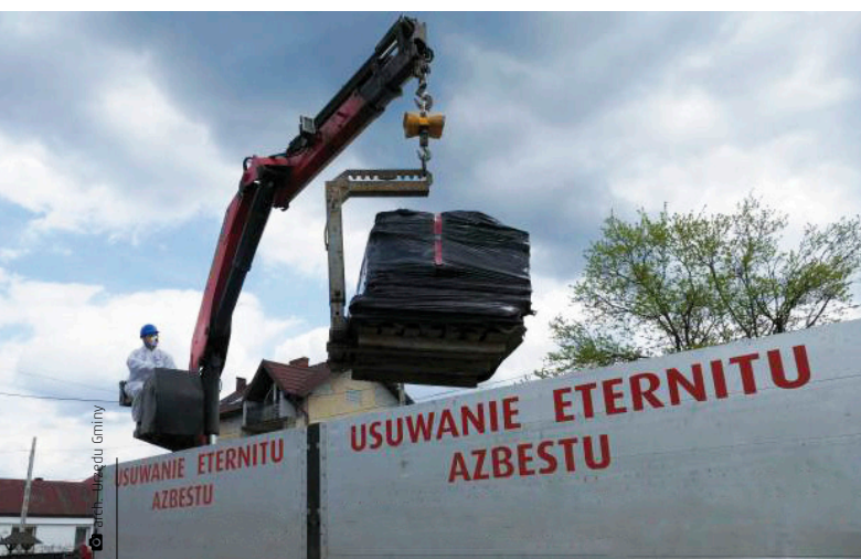
Ubiegłoroczna akcja odbioru azbestowego eternitu od mieszkańców

Nasza gmina realizuje te obowiązki poprzez szereg działań, m.in. usuwanie i oczyszczanie ścieków, unieszkodliwianie odpadów komunalnych czy ograniczenie emisji gazów i pyłów do atmosfery. W ubiegłym roku gmina przystąpiła do realizacji „Programu ograniczania niskiej emisji dla gminy Miedziana Góra”, w ramach którego mieszkańcy mogą starać się o wsparcie finansowe inwestycji związanych z montażem, wymianą