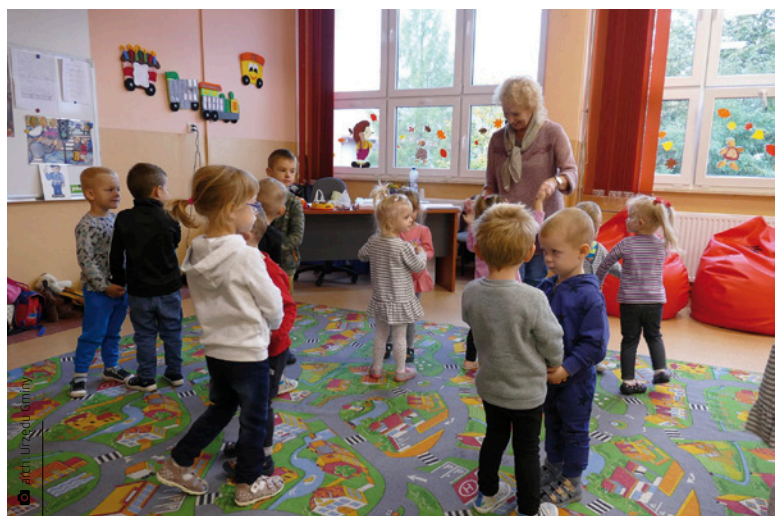
Przy większym zainteresowaniu przedszkola zostaną otwarte

W dobie pandemii koronawirusa, w drugim etapie luzowania ograniczeń, od 6 maja przedszkola mogą w zaostrzonym reżimie sanitarnym pełnić funkcję opiekuńczą, bez prowadzenia zajęć edukacyjnych. Te działania mają umożliwić pracującym rodzicom powrót do aktywności zawodowej. – Mimo moż-