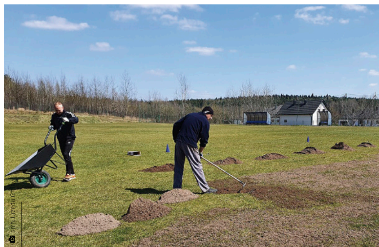
Wiosenne prace renowacyjne boiska w Miedzianej Górze

Według wytycznych z obiektów sportowych mogą korzystać małe grupy do sześciu osób z trenerem lub opiekunem. Nadal obowiązuje zasłanianie twarzy w drodze na boisko, ale przybywając na nim, nie musimy już tego robić. Konieczne jest zachowanie dystansu społecznego. Nie ma możliwości korzystania z szatni i węzła sanitarnego, poza toaletami. Po