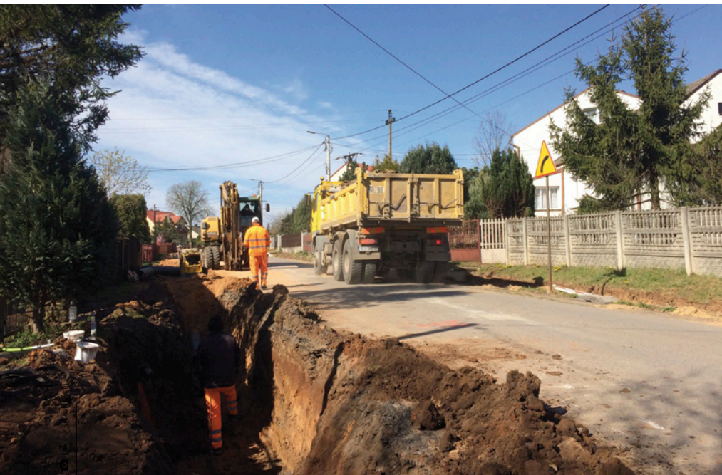
Prace przy przebudowie ulicy Laskowa w Kostomłotach Drugich

Władze gminy pozyskały kolejne duże dofinansowanie na zadania rozwojowe. – Otrzymaliśmy 1 933 941 złotych w ramach Programu Rozwoju Obszarów Wiejskich na lata 2014-2020. Dzięki temu przeprowadzimy budowę sieci wodociągowej i kanalizacyjnej w Porzeczu i Kostomłotach Drugich – informuje wójt Damian Sławski. W Porzeczu zaplanowano budowę wodociągu na ulicach Platynowej i Brylantowej oraz kanalizacji na ulicach Rubinowej, Platynowej, Brylantowej i Złotej. Natomiast w Kostomłotach Drugich – ulice Wierzbowa, Topolowa i część Stadionowej podłączone zostaną do gminnej sieci kanalizacyjnej i wodociągowej. ■