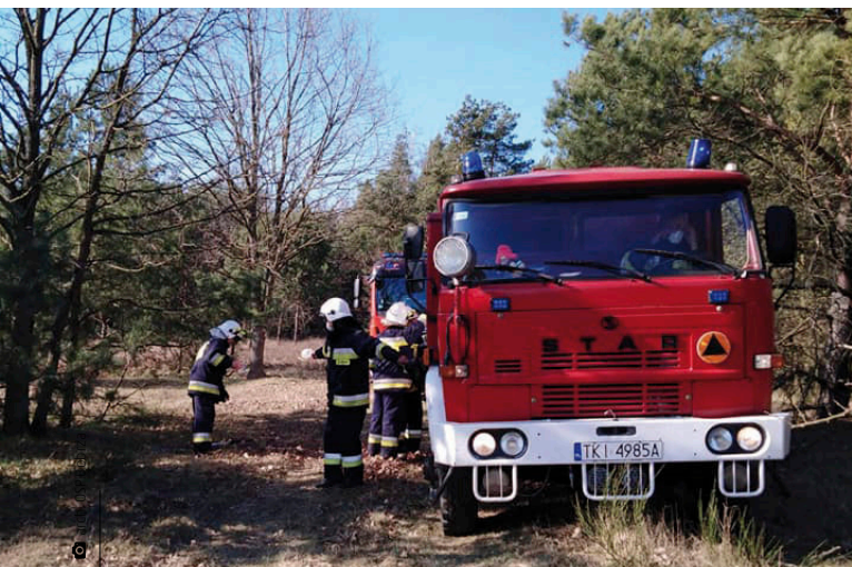
Strażacy z jednostki w Bobrzy podczas akcji gaszenia pożycia leśnego, którego przyczyną było wypalanie traw na pobliskiej łące