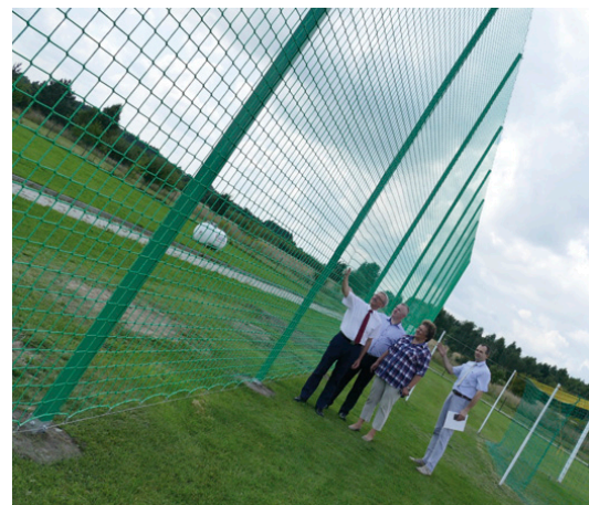
Gminne boiska sportowe wzbogaciły się o nowoczesne wyposażenie

Z prac wykonanych na boisku piłkarskim Wichru cieszy się przewodniczący Rady Gminy Miedziana