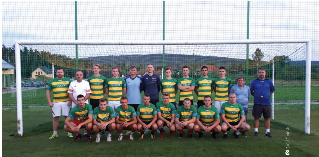
Drużyna klubu piłkarskiego Gród Ćmińsk

Pierwsze ligowe rozgrywki już za drużyną z Ćmińska, która 19 sierpnia zagrała na swoim boisku z Sokółem-Nordkalk Rykoszyn. Niestety