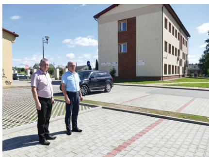
Teren wokół Urzędu Gminy zyskał nowe miejsca parkingowe

10 nowych miejsc parkingowych pojawiło się na przestrzeni wygospodarowanej tuż za budynkiem remizy OSP w Miedzianej Górze. – Służycy będą one nie tylko interesantom odwiedzającym Urząd Gminy, ale i wszystkim mieszkańcom, którzy przyjeżdżają do centrum Miedzianej Góry na zakupy, do kościoła czy ośrodka zdrowia – mówi wójt Zdzisław Wrzałka. – Cieszę się, że udało nam się za-