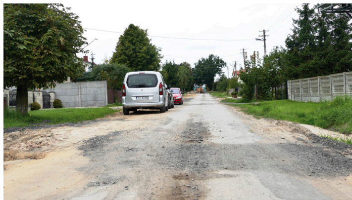
Taki widok nawierzchni już wkrótce odejdzie do przeszłości

ce uwzględniającej specyfikę terenu – najpierw zostanie położona warstwa nośna o grubości 15 cm, która wzmocni grunt, a następnie – dwie warstwy asfaltu – tłumaczy wójt. ■ (nieb.)