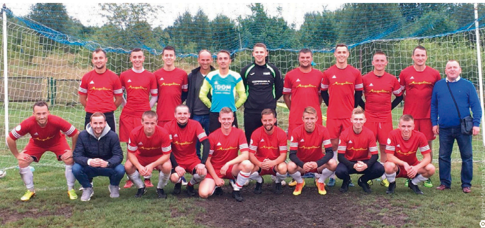
Zespół klubu piłkarskiego Wicher Miedziana Góra

Warto dodać, że 7 października Wicher i Gród czekają derby. Bez wątplenia to spotkanie przejdzie do historii, a my trzymamy kciuki za obie drużyny. ■