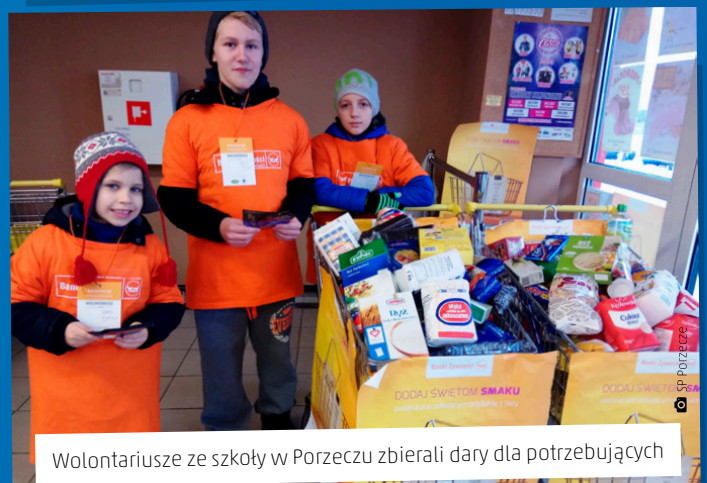
Wolontariusze ze szkoły w Porzeczu zbierali dary dla potrzebujących