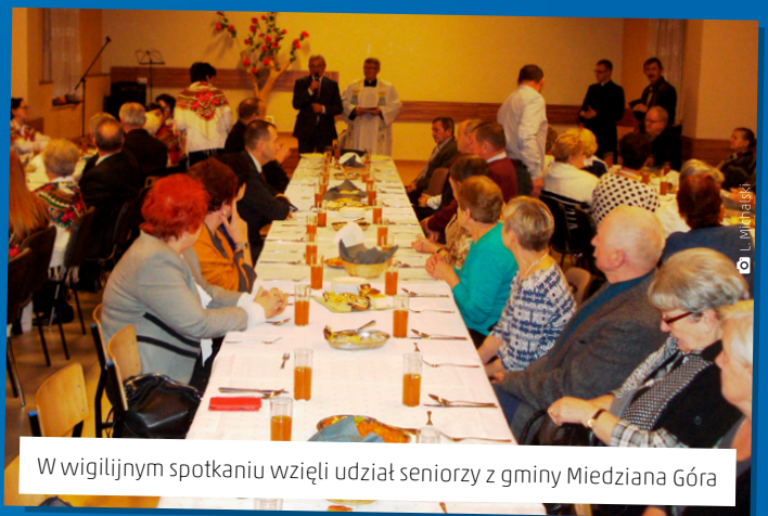
W wigilijnym spotkaniu wzięli udział seniorzy z gminy Miedziana Góra