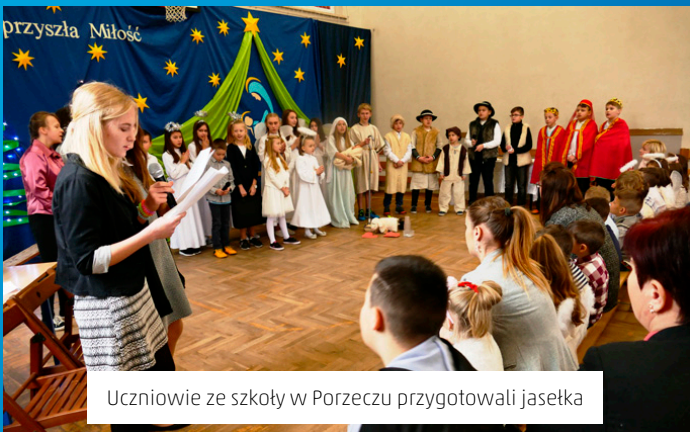
Uczniowie ze szkoły w Porzeczu przygotowali jasełka