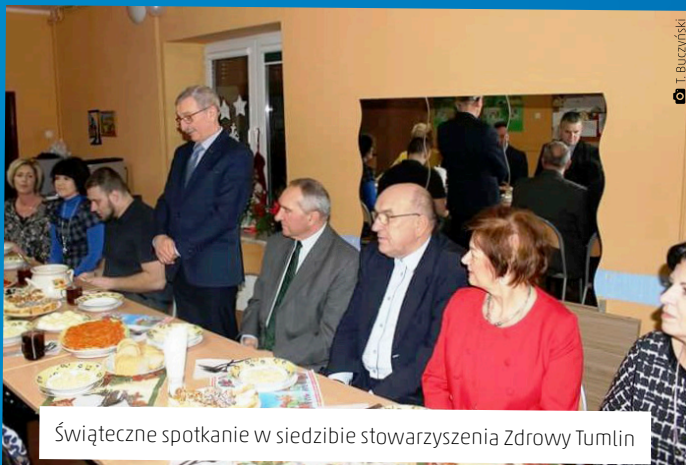
Świąteczne spotkanie w siedzibie stowarzyszenia Zdrowy Tumlin