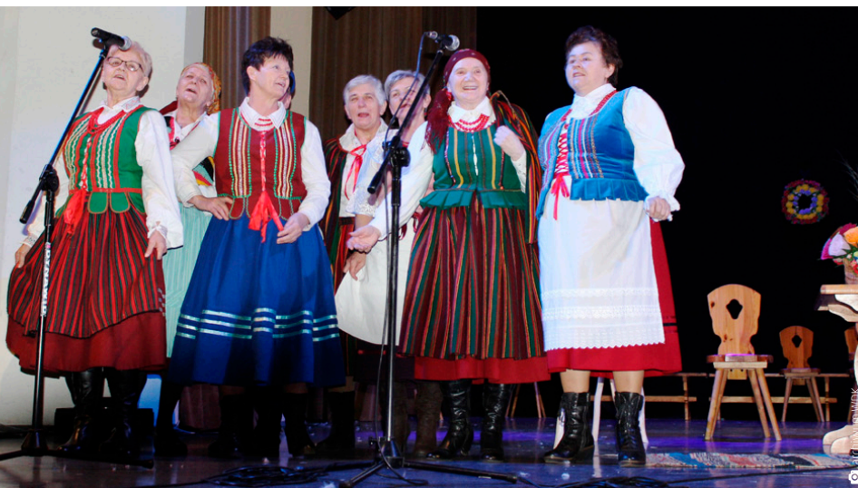
„Złote Lata” podczas prezentacji w Wojewódzkim Domu Kultury w Kielcach