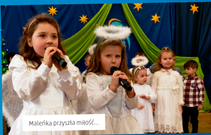
Małeńka przyszła miłość...