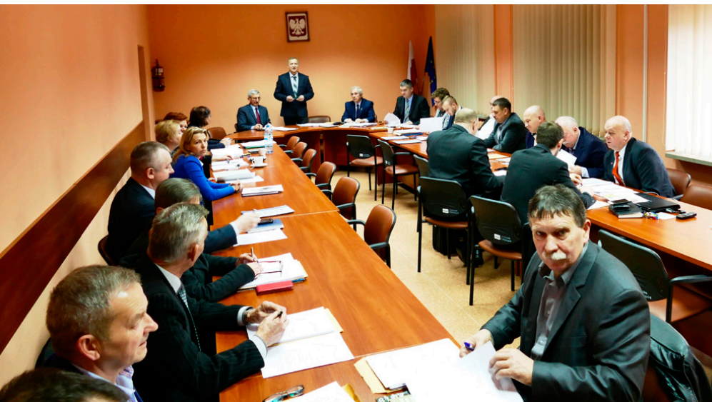
Podczas grudniowej sesji radni przyjęli budżet gminy na 2018 r.

Podczas ostatniej w 2017 r. sesji radni Miedzianej Góry uchwalili miejscowy plan zagospodarowania przestrzennego Kostomłotów Pierwszych „Część Wschodnia” – centrum, podjęli uchwały w sprawie wzniesienia pomnika upamiętniającego setną rocznicę odzyskania niepodległości przez Polskę oraz przyjęcia Gminnego Programu Opieki nad Zabytkami Gminy Miedziana Góra na lata 2018-2021 . Przyjęto również uchwałę w sprawie udostępnienia gruntów nie będących pasem drogowym dróg gminnych i wewnętrznych stanowiących własność gminy Miedziana Góra pod lokalizację urządzeń infrastruktury technicznej. Radni wyrazili zgodę na sprzedaż nieruchomości położonej w miejscowości Ćmińsk oraz zaakceptowali zmiany w statucie Samorządowego Ośrodka Zdrowia w Ćmińsku. Przyjęte zostały także dwa dokumenty - Gminny Program Profilaktyki i Rozwiązywania Problemów Alkoholowych na rok 2018 i Gminny Program Przeciwdziałania Narkomanii na rok 2018 w Gminie Miedziana Góra . Radni zatwierdzili również szczegółowe zasady ponoszenia odpłatności za pobyt w schronisku osób bezdomnych.