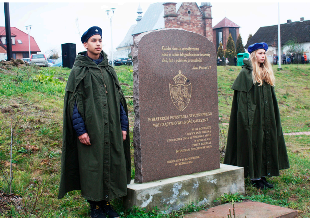
Obelisk ku czci powstańców styczniowych w Ćmińsku