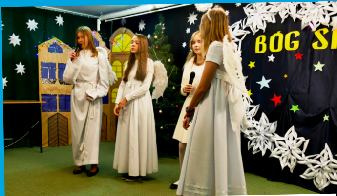
Świąteczny nastrój zapanował w Zespole Szkół w Kostomłotach Drugich