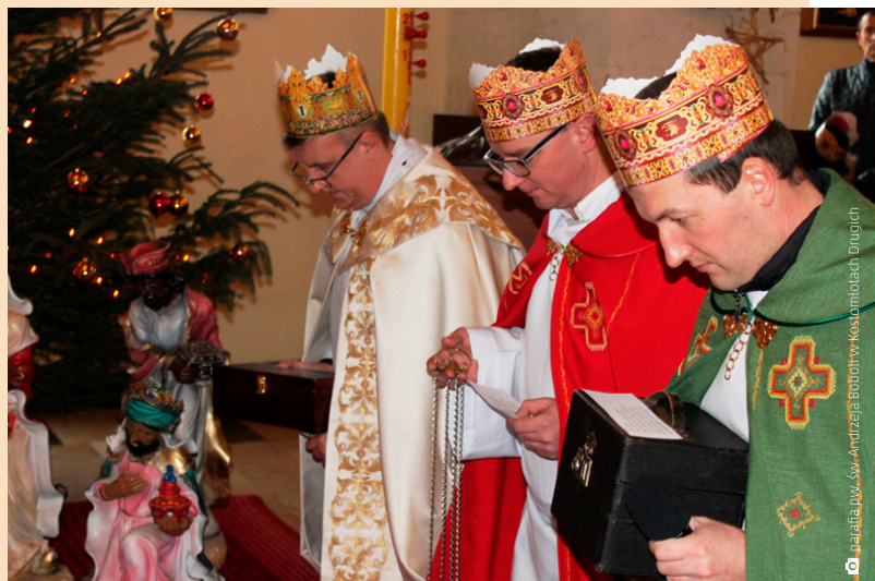
Trzej Królowie pokłonili się Dzieciątku Jezus