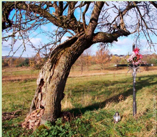
Krzyż przy ul. Kościelnej

Miejsce pochówku osób zmarłych na cholera znajdowało się również najprawdopodobniej w centrum Miedzianej Góry,