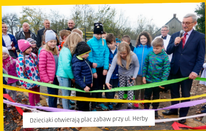
Dzieciaki otwierają plac zabaw przy ul. Herby