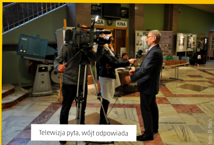
Televizja pyta, wójt odpowiada