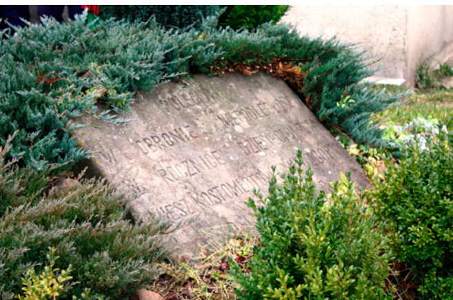
Pamiątkowa płyta przy szkole w Kostomłotach Drugich

Gdy 12 sierpnia 1914 r. legionieści Józefa Piłsudskiego witani m.in. przez mieszkańców Miedzianej Góry, Kostomłotów i Tumlina nieśli nadzieję na odzy-