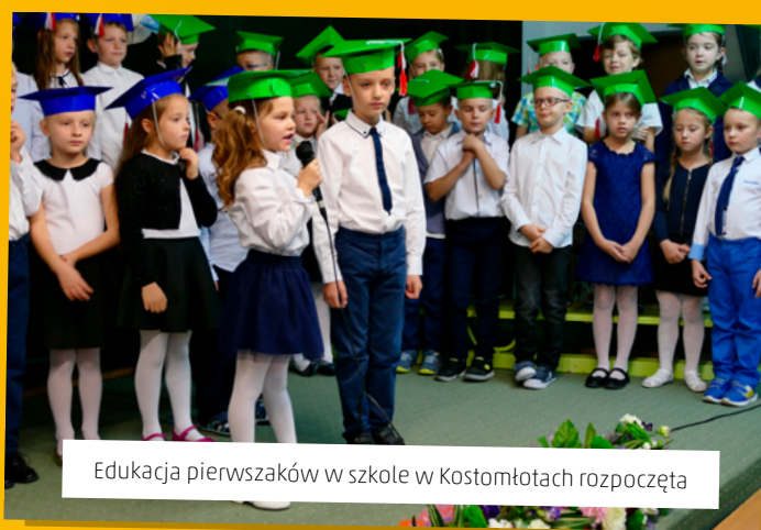
Edukacja pierwszaków w szkole w Kostomłotach rozpoczęta