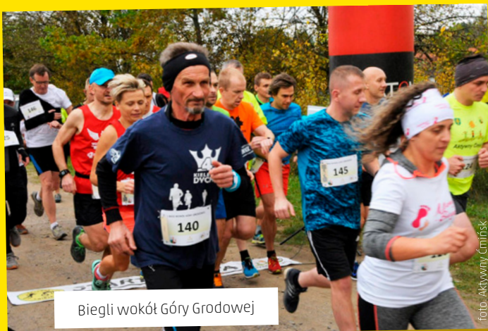
Biegli wokół Góry Grodowej