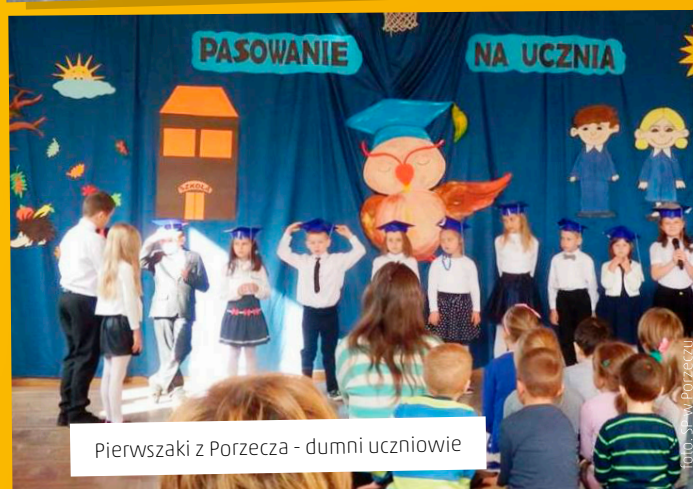
Pierwszaki z Porzeczka - dumni uczniowie