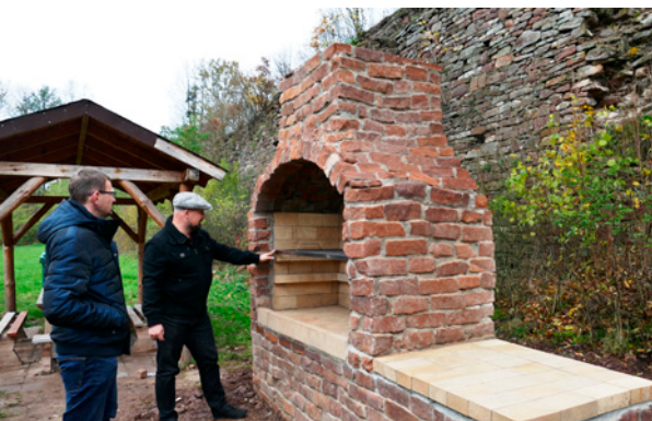
Grill w Bobrzy stanął pod koniec października

Plac zabaw przy ul. Herby w Miedzianej Górze uroczystie otwarto w połowie października. Dzieciaki z radością testowały urządzenia, a trzeba przyznać, że jest na czym się bawić. Na pla-