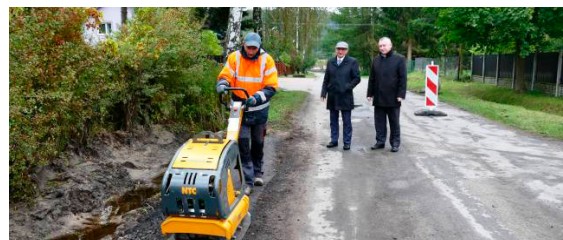
Zagęszczarka już pracuje na ulicach gminy

Zagęszczarka to nie jedyny zakup Zakładu Gospodarki Komunalnej, który wzbogacił się również o dwie nowe pompy do przepompowni ścieków (jedna za 8 tys. zł o mocy 8 kW, druga za 27 tys. zł o mocy 22 kW). – Kupiliśmy także fotometr, który służyć będzie do badania jakości wody – zawartości chloru, żelaza, jej twardości i pH. Nowy zakup to również zamrażarka do rur, która działa wtedy, gdy podczas prac remontowych lub wymiany wodomierzy nie trzymają zawory – wylicza prezes Dudek. ■ (nieb.)