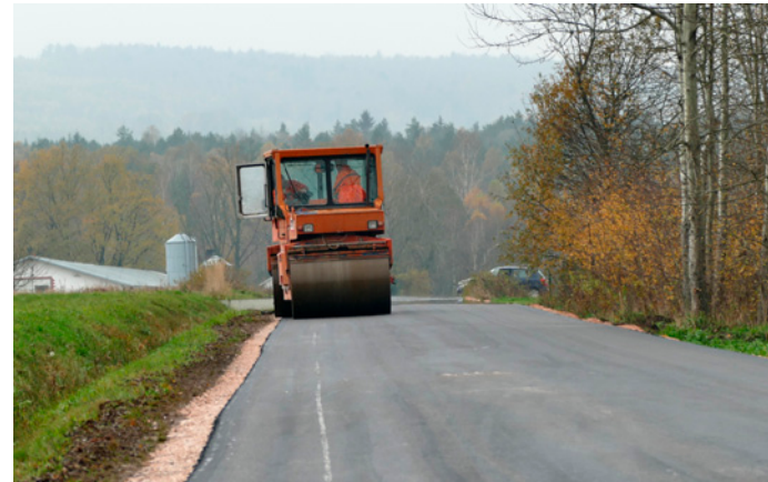
Remont ul. Północnej w Przyjmie

Gmina Miedziana Góra uzyskała także dofinansowanie na przebudowę 400-metrowego odcinka ul. Północ-