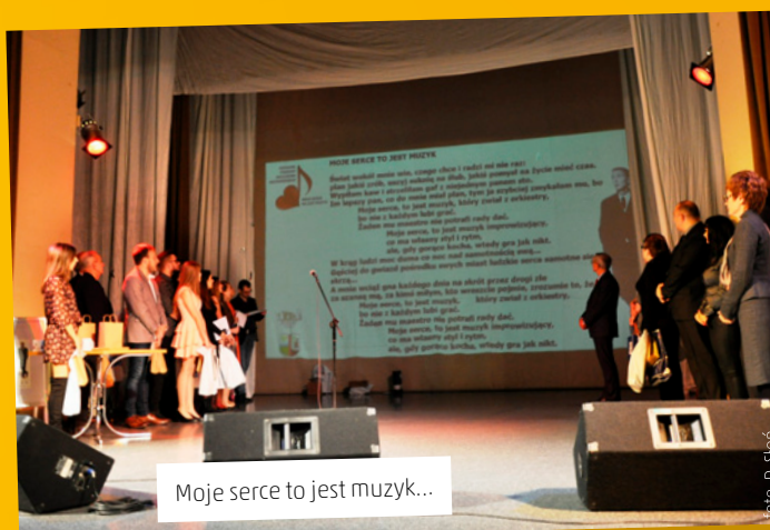
Moje serce to jest muzyk...