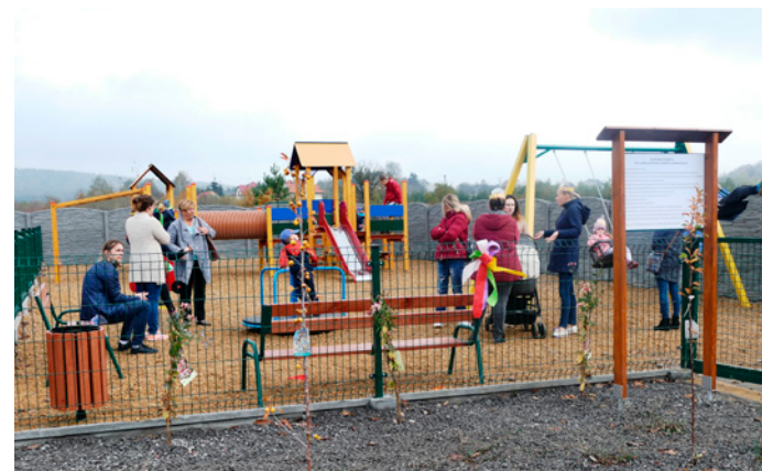
Plac zabaw przy ul. Herby będzie miejscem zabawy i spotkań mieszkańców

nej w Przyjmie. – Na tę inwestycję otrzymaliśmy z województwa świętokrzyskiego 34 tys. zł na zadania określone w ustawie o ochronie gruntów rolnych. Całko-