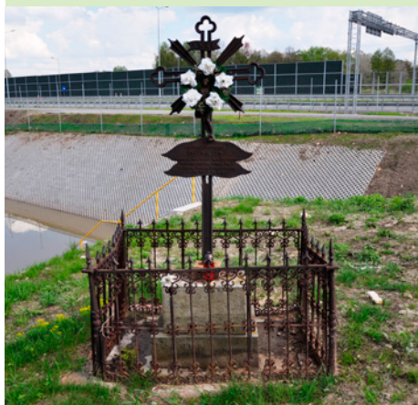
Krzyż przy drodze krajowej 74

Zakaźne choroby niosły tragiczne żniwo – nikt nie znał na nie lekarstwa, nikt nie wiedział, jak się przed nimi ustrzec. Epidemie cholery, dżumy czy tyfusu powodowały wyludnienie całych wsi i miast,