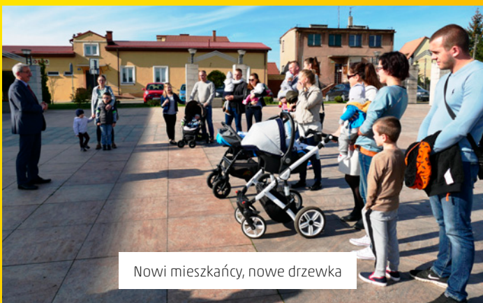
Nowi mieszkańcy, nowe drzewka