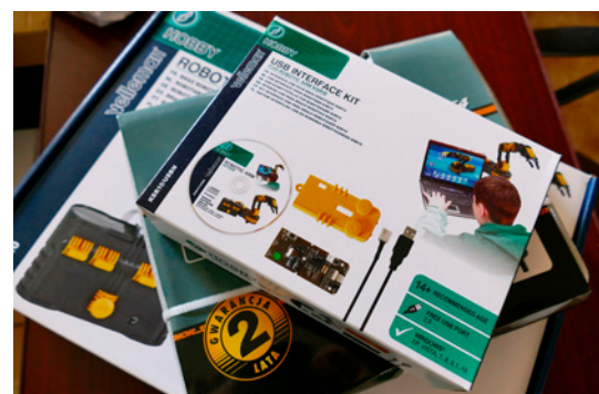
Zakupione w ramach projektu pomoce uatrakcyjnią zajęcia lekcyjne

Dzięki dofinansowaniu w wysokości 431 477,93 zł możliwe będzie objęcie działaniami projektu 358 uczniów i uczennic klas starszych z terenu gmi-