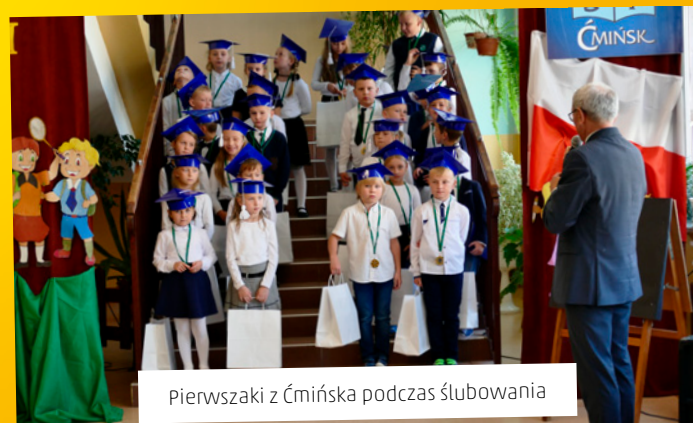
Pierwszaki z Ćmińska podczas ślubowania