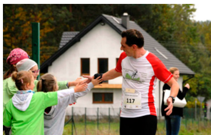
Biegowi towarzyszyły sportowe emocje

Sportowa rywalizacja była połączona z festynem oraz uroczystym przekazaniem