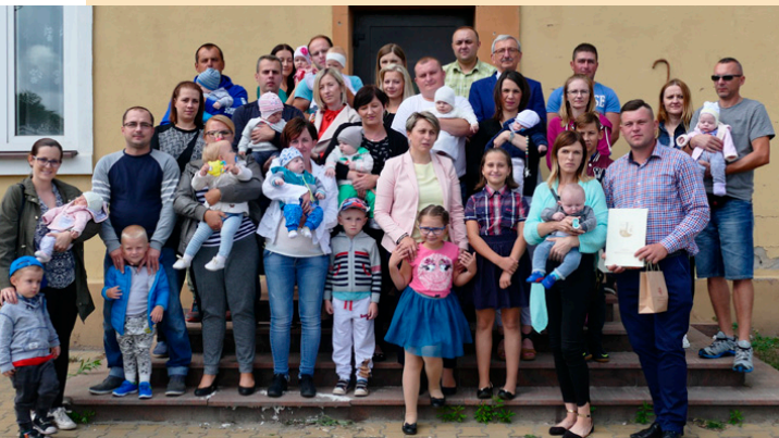
W sierpniowej edycji akcji uhonorowaliśmy rodziców 18 maluchów

Po raz czternasty w Miedzianej Górze zorganizowano akcję „Drzewka dla szczęśliwych rodziców”, w ramach której rodzice najmłodszych mieszkańców naszej lokalnej społeczności otrzymu-