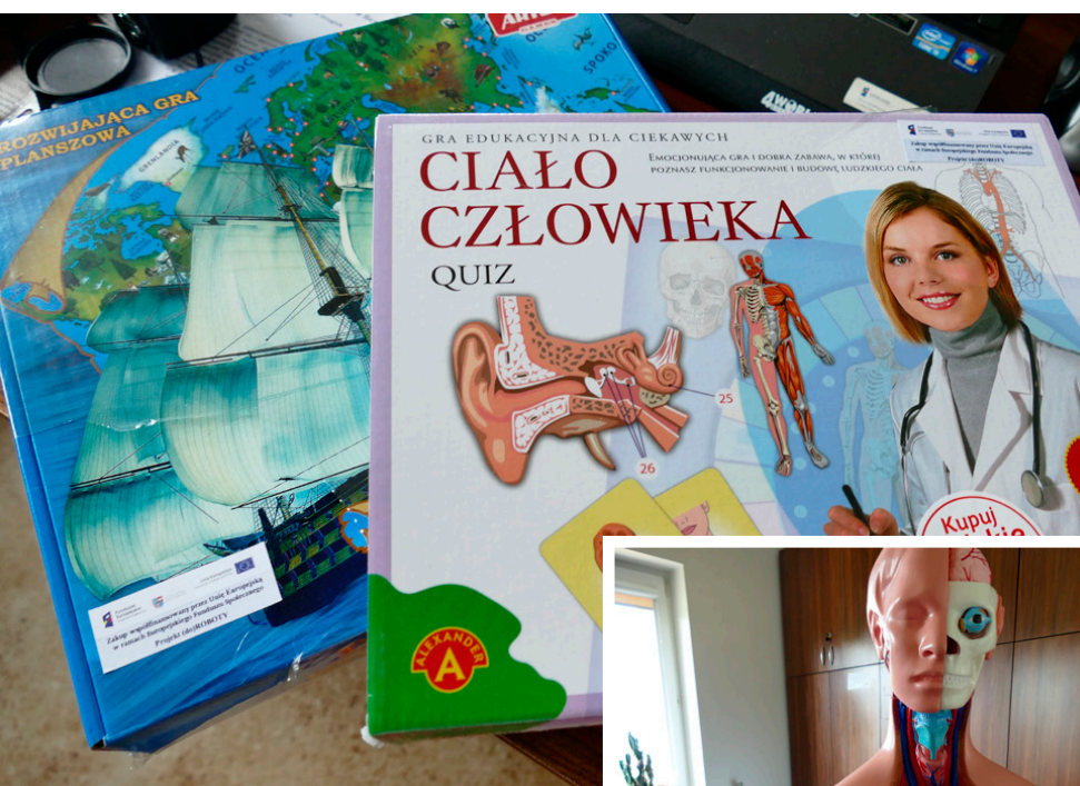
Nowoczesne pomoce dydaktyczne uatrakcyjnią zajęcia lekcyjne

W trzech podstawówkach uczy się 757 dzieci, zaś w dwóch gimnazjach 233 młodych ludzi. Najwięcej uczniów zasiadło w ławach szkolnych placówki w Kostomłotach Drugich. Po raz pierwszy