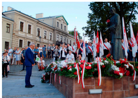
Chwila zadumy pod pomnikiem ks. Popiełuszki