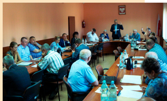
Podczas sierpniowej sesji radni przyjęli dziewięć uchwał

Podczas sierpniowej sesji radni zaakceptowali także wstępną lokalizację przystanku autobusowego na drodze powiatowej przy ul. Kobylaki w Ćmińsku po lewej stronie na wysokości posesji nr 24, a także przyjęli zmiany w załączniku uchwa-