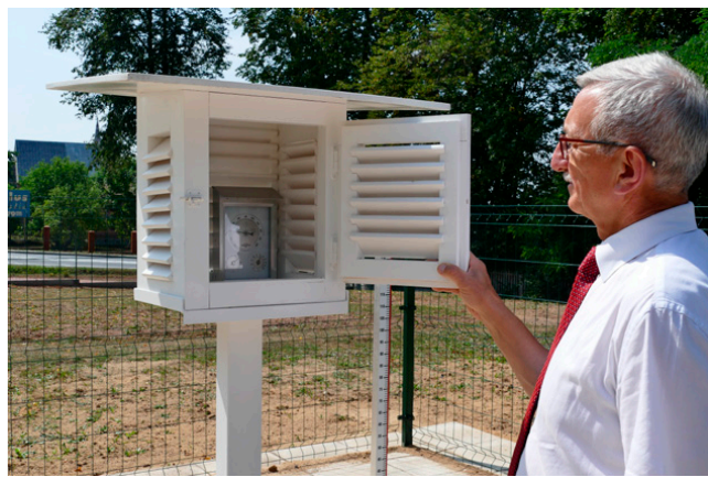
Stacja meteo w Ćmińsku służyć będzie uczniom naszych szkół

BOTY” w ramach Regionalnego Programu Operacyjnego Województwa Świętokrzyskiego na lata 2014-2020 współfinansowanego ze środków Europejskiego Funduszu Społecznego z Osi Priorytetowej 8 – Rozwój edukacji i aktywne społeczeństwo, Poddziałanie 8.3.4 Rozwój