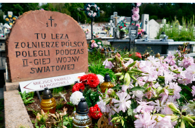
Mieszkańcy gminy pamiętają o żołnierzach poległych w czasie II wojny światowej

Polska czeka gotowa z bronią u nogi. Hitlerowi pozostaje do wyboru cofnąć się – albo rozpocząć wojnę – pisała wojowniczo jedna z polskich gazet. Ogłoszona 30 sierpnia mobilizacja nie była dla niko-