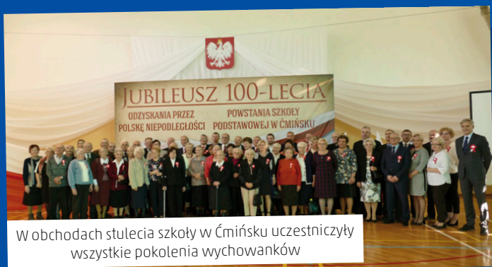
W obchodach stulecia szkoły w Ćmińsku uczestniczyły wszystkie pokolenia wychowanków