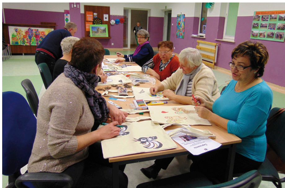
Członkinie klubu uczestniczą w warsztatach plastycznych