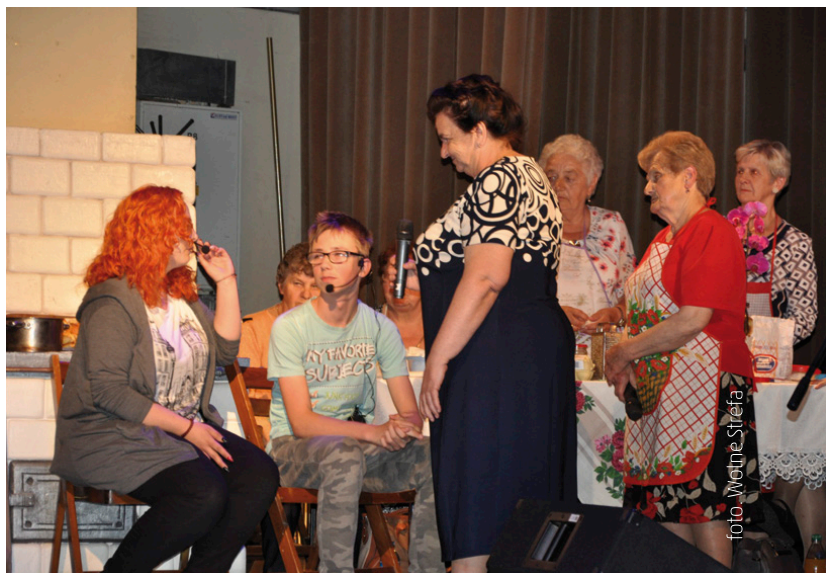
Wspólny występ senierek z młodzieżą z Wolnej Strefy