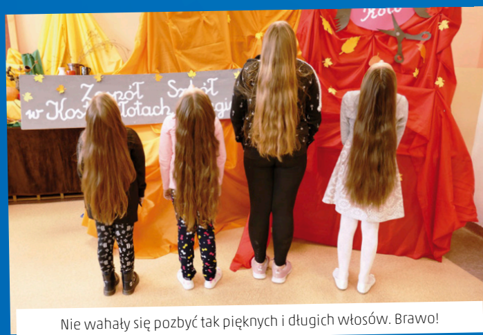
Nie wahały się pozbyć tak pięknych i długich włosów. Brawo!