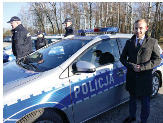
Jeden z radiowozów służyć będzie posterunkowi w Strawczynie, któremu podlega gmina Miedziana Góra