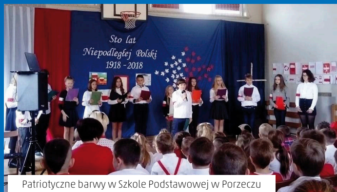
Patriotyczne barwy w Szkole Podstawowej w Porzeczcu