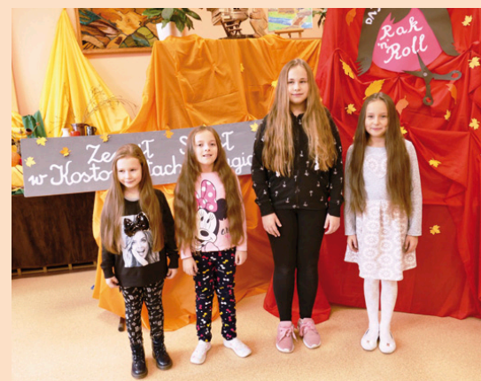
Wspaniałe dziewczyny podarowały swoje długie włosy chorym osobom