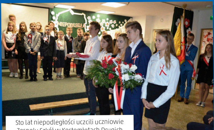
Sto lat niepodległości uczcili uczniowie Zespołu Szkół w Kostomłotach Drugich