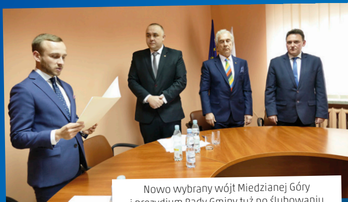
Nowo wybrany wójt Miedzianej Góry i prezydium Rady Gminy tuż po ślubowaniu