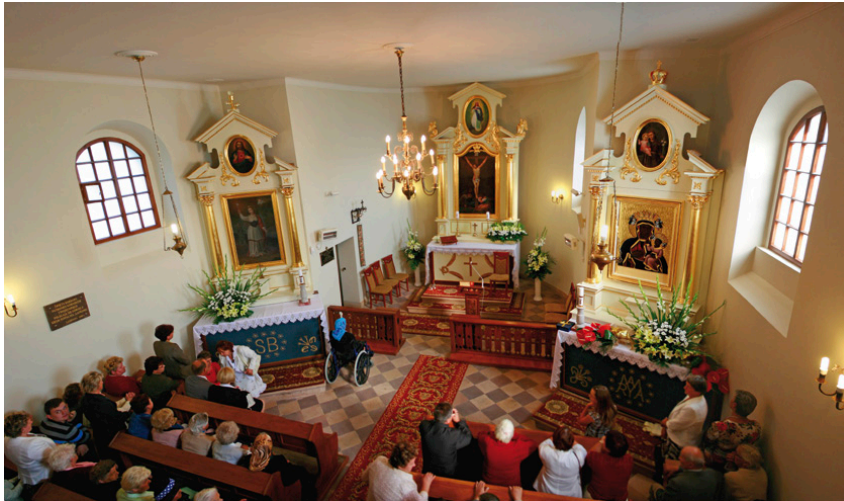
Wnętrze kaplicy św. Barbary, po lewej ołtarz z portretem św. Barbary

patronką dobrej śmierci i trudnej pracy, głównie górników. Obrali ją oni za swoją patronkę dlatego, że próbując uciec z więzienia, Barbara miała się przecisnąć przez skalną szczelinę. Jest ona rów-