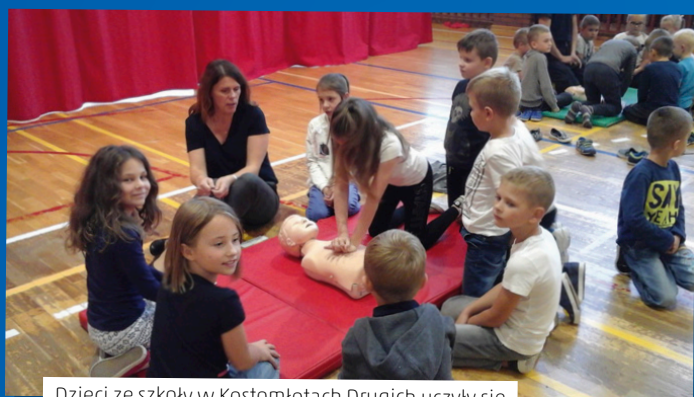
Dzieci ze szkoły w Kostomłotach Drugich uczyły się zasad udzielania pierwszej pomocy