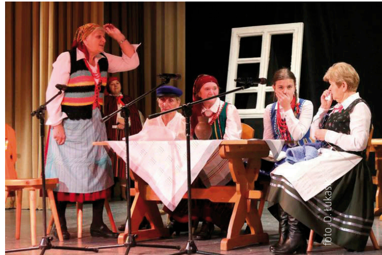
Klub Seniora „Złote Lata” zaprezentował w WDK spektakl „Cielotko”