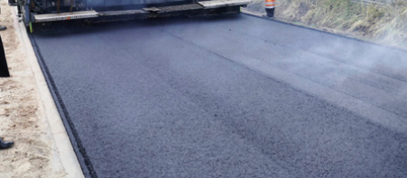
Inwestycję przy ul. Wyrowce odwiedziliśmy w końcowym etapie prac

– Remont tego odcinka był bardzo potrzebny, mieszkańcy od dawna czekali na kompleksowe prace przy ul. Wyrowce. Stan nawierzchni na ulicy był fatalny, popękany asfalt nie nadawał się już do latania, w wielu miejscach droga była zapadnięta – mówi wójt Sławski, przypominając, że na całej długości ulicy wybudowano także chodnik oraz pobocze z kruszywa.