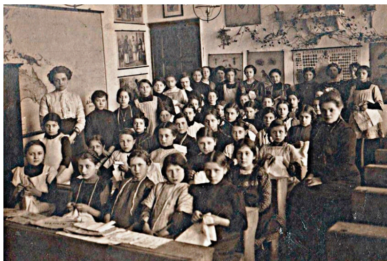
Zajęcia z prac ręcznych w przedwojennej szkole