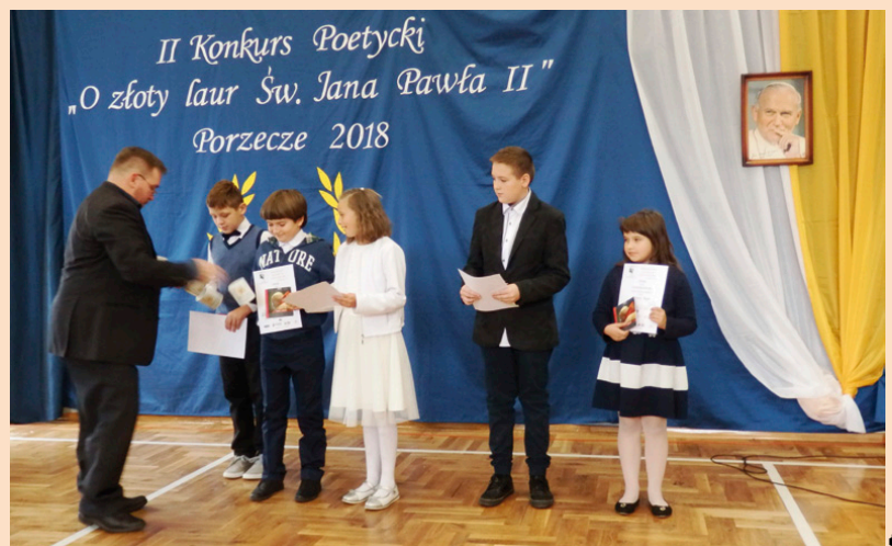
Laureaci konkursu organizowanego przez SP w Porzeczcu

Nazwiska wszystkich laureatów konkursu dostępne są na naszej stronie internetowej – www.miedziana-gora.pl ■