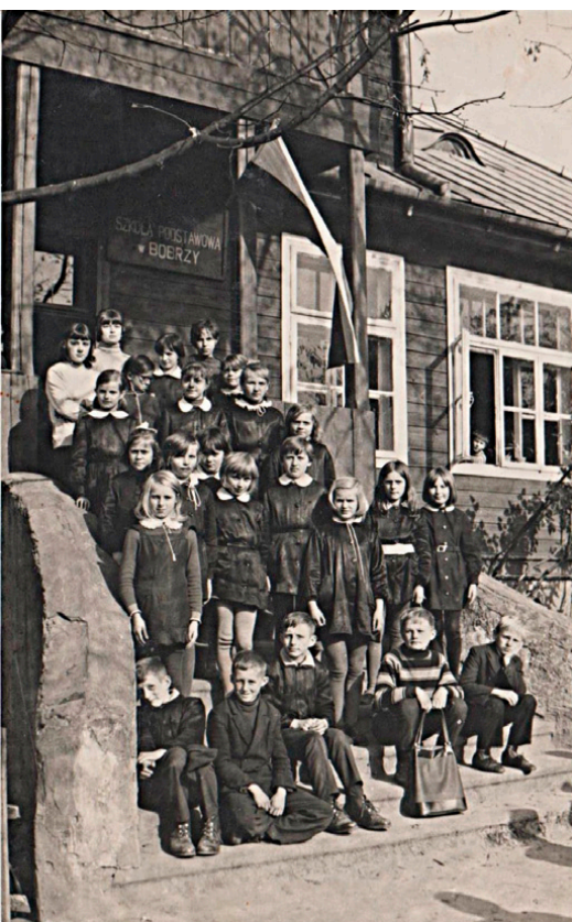
Budynek filii szkoły w Bobrzy