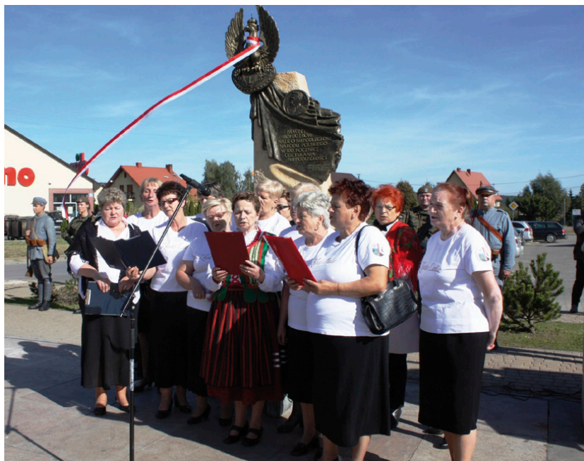
Pań z klubu „Złote Lata” nie może zabraknąć podczas uroczystości patriotycznych