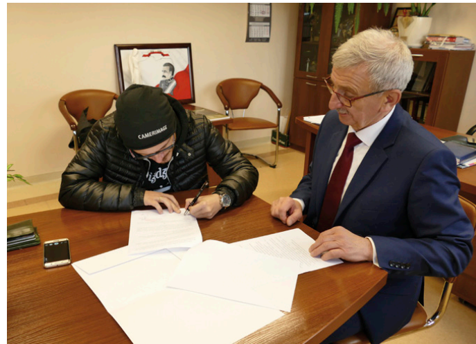
Podpisanie umowy na współpracę przy produkcji filmu

Konkretny termin rozpoczęcia zdjęć zależy od zebrania funduszy na realizację filmu, które będą znacznie wyższe niż te przeznaczone na „Wyklętego”. Gmina Miedziana Góra jest pierwszym świętokrzyskim samorządem, który zdecydował się na wsparcie produkcji filmu. – Film historyczny wymaga wielomilionowych nakładów – dodaje re-