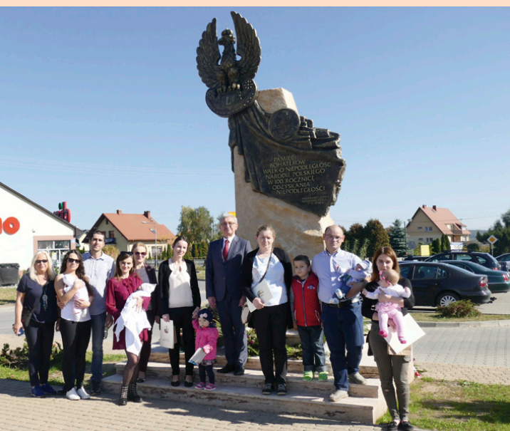
Rodzice najmłodszych mieszkańców otrzymali pamiątkowe drzewka

Po raz ostatni w tym roku wręczyliśmy drzewka dla szczęśliwych rodziców. W ten uroczysty sposób powitaliśmy w październiku wśród mieszkańców gminy piątkę maluchów.