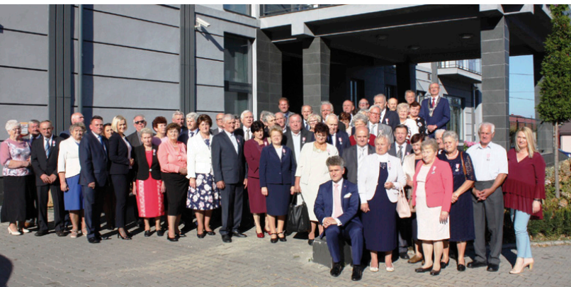
W październiku świętowaliśmy piękny jubileusz Złotych Godów

Wręczenie Medali za Długoletnie Pożycie Małżeńskie odbyło się 14 października w gminie Miedziana Góra. Uroczystość poprzedziła msza święta w kościele pw. św. Andrzeja Boboli w Kostomłotach Drugich, do której odprawiania ks. proboszcz