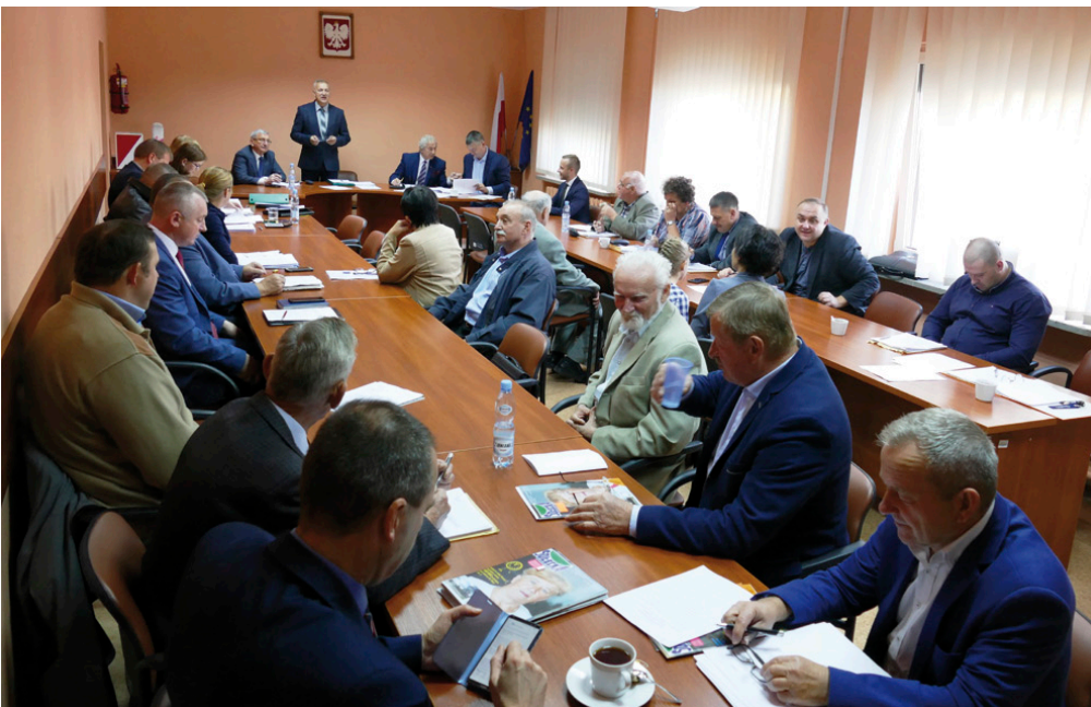
Przedostatnia, październikowa sesja Rady Gminy w Miedzianej Górze

14 listopada odbędzie się ostatnia sesja kończącej swą kadencję Rady Gminy Miedziana Góra. Formalnie kadencje wszystkich rad upływają 16 listopada 2018 r. Zwołanie pierwszej sesji rady nowej kadencji należy do obowiązków komisarzy wyborczego. Posiedzenie powinno zostać zwołane między 19 a 23 listopada 2018 r. Państwowa Komisja Wyborcza zobowiązała komisarzy wyborczych do uwzględnienia w porządkach obrad