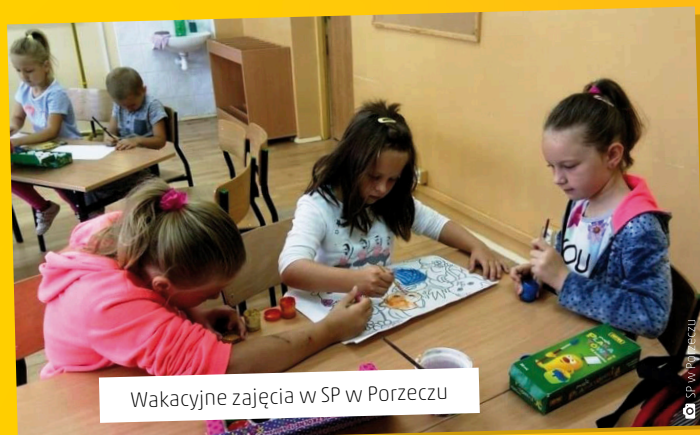
Wakacyjne zajęcia w SP w Porzeczcu