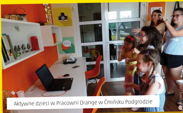
Aktywne dzieci w Pracowni Orange w Ćmińsku Podgrodzie