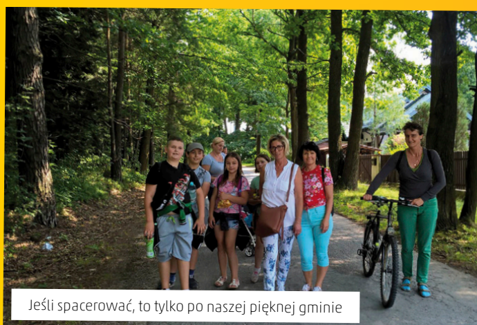
Jeśli spacerować, to tylko po naszej pięknej gminie