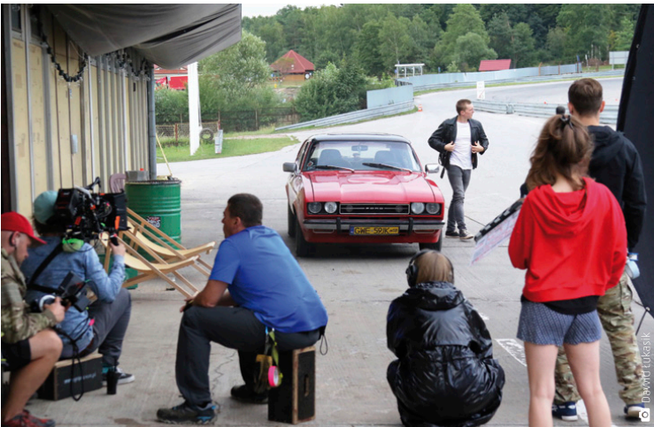
Na Torze Kielce powstawały zdjęcia samochodowych pościgów, które będzie można zobaczyć w filmie „Diablo”

zykiem. Chłopak wchodzi w świat, który balansuje na granicy prawa i w którym stawką okazuje się nie tylko wygrana, ale i życie. Na planie filmowym na Torze Kielce gościła ponad 40-osobowa ekipa, uwagę przyciągały przede wszystkim widowiskowe wyścigi z udziałem takich aut jak ford mustang gt i capri, a także mercedesy sls amg gt i subaru impreza. Jak powiedziała nam kierownik pro-