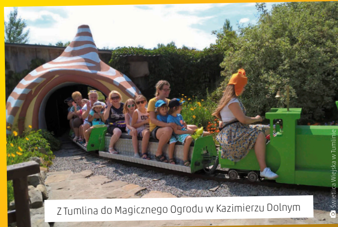
Z Tumlina do Magicznego Ogrodu w Kazimierzu Dolnym