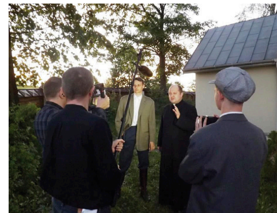
Na Górze Janowej kręcono zdjęcia do filmu „Wilk”