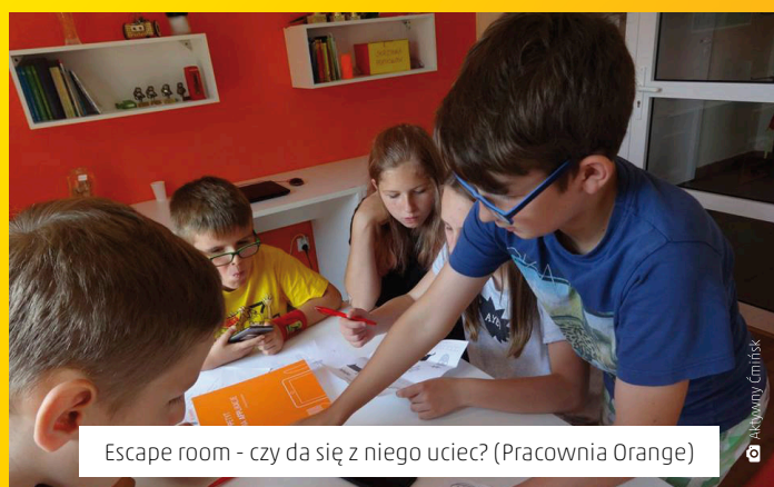
Escape room - czy da się z niego uciec? (Pracownia Orange)