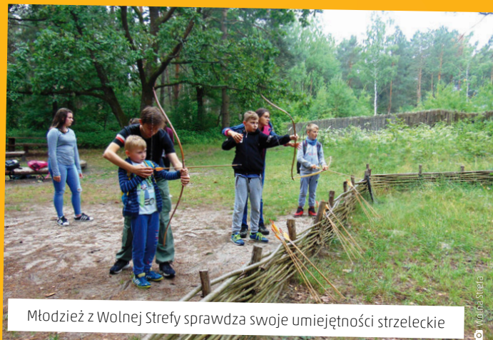
Młodzież z Wolnej Strefy sprawdza swoje umiejętności strzeleckie