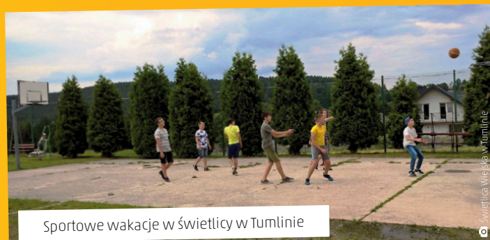
Sportowe wakacje w świetlicy w Tumlinie