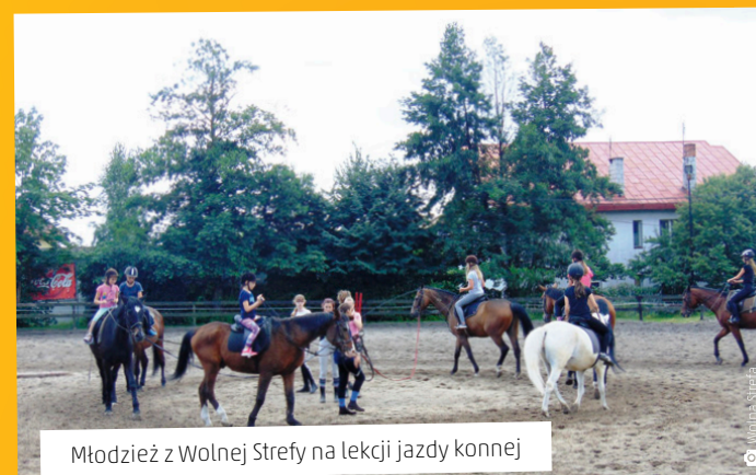
Młodzież z Wolnej Strefy na lekcji jazdy konnej