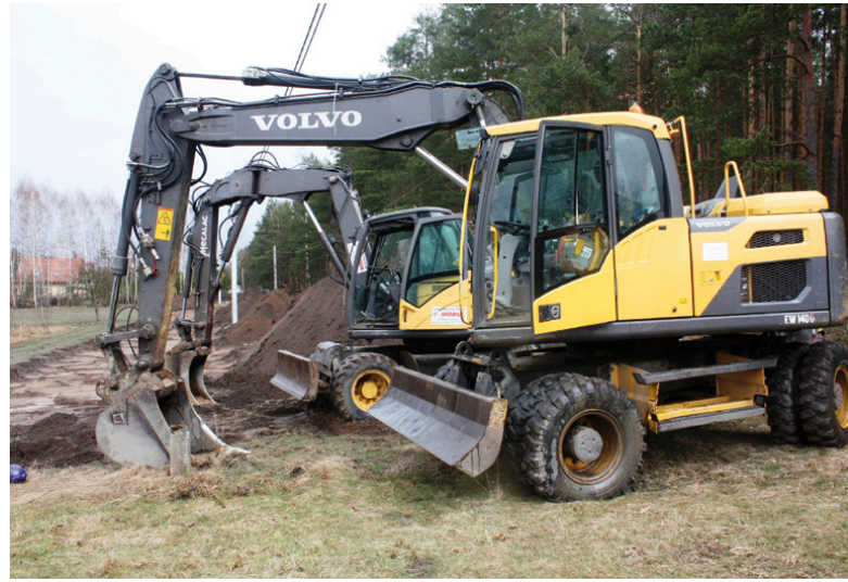
Największym zadaniem inwestycyjnym tej kadencji samorządu jest budowa kanalizacji

pejskich. Ale po pieniądze można sięgać także do krajowych programów, jak choćby Fundusz Sprawiedliwości (dzięki któremu jednostki OSP otrzymały nowoczesny sprzęt) czy rządowych progra-