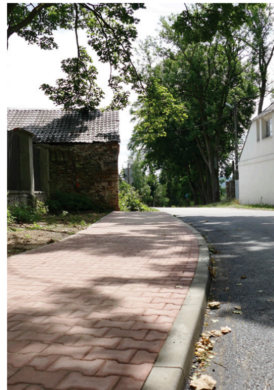
W tej kadencji samorządu m.in. wyremontowano za kwotę 482 tys. zł ul. Staszica

mów remontów dróg (np. modernizacja ul. Wyrowce). Liczy się bowiem każda pozyskana złotówka. Nasza pozycja w zestawieniu Ministerstwa Fi-