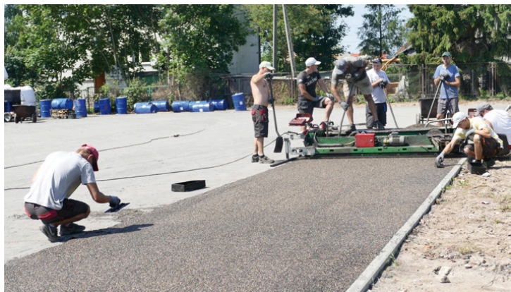
Wielofunkcyjne boisko będzie gotowe pod koniec sierpnia

natrysk. Obiekt ma być gotowy do końca wakacji. W ramach projektu w szkole w Kostomłotach Drugich trwa również remont dwóch szatni wraz z holami, ubikacjami i natryskami przy sali gimnastycznej, łazienki na terenie szkoły zostaną zmodernizowane i dostosowane do potrzeb osób niepełnosprawnych. Całkowita wartość projektu, współfinansowanego z RPO Województwa Świętokrzyskiego na lata 2014-2020 to 969 tys. zł, unijne wsparcie wyniosło 726 tys. – To dofinansowanie pozwoli na realizację zadań służących rozwojowi edukacji we wszystkich naszych trzech gminnych szkołach – mówi wójt gminy Miedziana Góra Zdzisław Wrzałka.