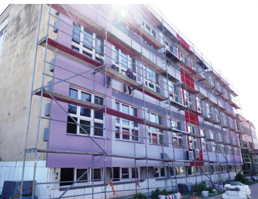
Nową szatę zyska elewacja budynku szkoły

Nowa nawierzchnia boiska i termomodernizacja gmachu, remont łazienek, wymiana okien i grzejników – w Zespole Szkół w Kostomłotach Drugich trwają prace realizowane w ramach dwóch unijnych projektów.