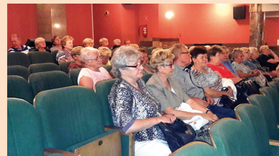
W lipcu członkowie UTW uczestniczyli w seansie filmowym

górscy seniorzy przez ostatnie tygodnie uczestniczyli w zajęciach na basenie w Strawczyźnie, po wakacjach zaś – w ramach UTW – ruszą wykłady poświęcone m.in. profilaktyce zdrowotnej, ziołolecz-