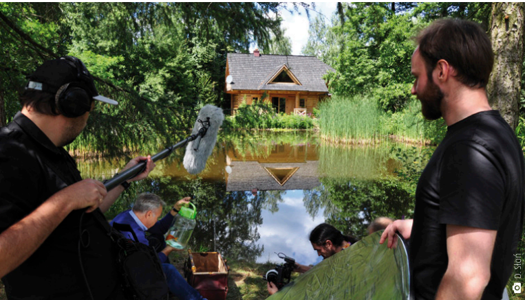
Gospodarstwo agroturystyczne Sucholand stało się na początku lipca tłem do zdjęć kręconych przez ekipę filmową

Góra Ciosowa znalazła się w elitarnym gronie największych hitów turystycznych naszego województwa – m.in. Świętego Krzyża, JuraParku w Bałtowie czy Sandomierza. Para blogerów doceniła to miejsce za ciekawe skałki, uznając, że doskonale nadaje się ono na niewymagające zbytniego forsowania spaceru. Miejmy nadzieję, że wskazówki portalu „Bussem przez świat” sprawią,