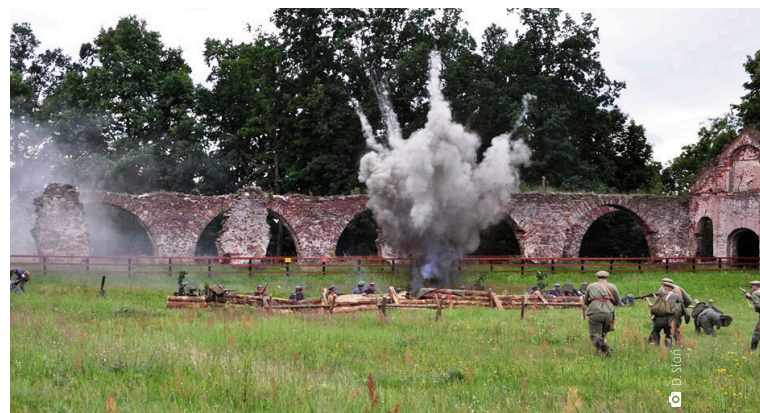
Pozostałości Zakładu Wielkopiecowego w Bobrzy były tłem rekonstrukcji z czasów I wojny światowej

Szczegółowemu usystematyzowaniu wiedzy o potencjalne turystycznym służy „Gminny program opieki nad zabytkami gminy Miedziana Góra na lata 2018-2021”. – Wskazane w programie działania są skierowane na poprawę stanu zabytków, ich rewaloryzację oraz zwiększenie dostępności do nich mieszkańców i turystów. Ma też budzić