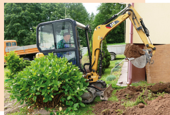
Nowy sprzęt już pracuje na terenie gminy