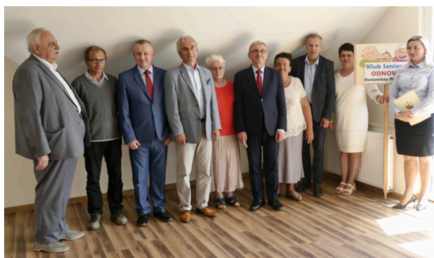
Wyremontowane poddasze służyć będzie społeczności lokalnej

Przewodniczący Sobczyk nie ma wątpliwości, że remont poddasza był dobrą decyzją. – Przed