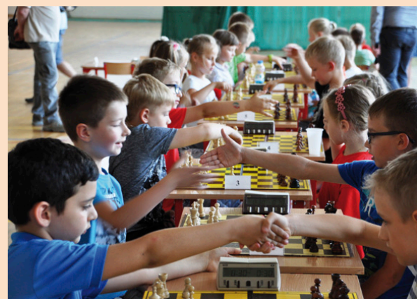
Najmłodsi uczestnicy szachowych zmagania