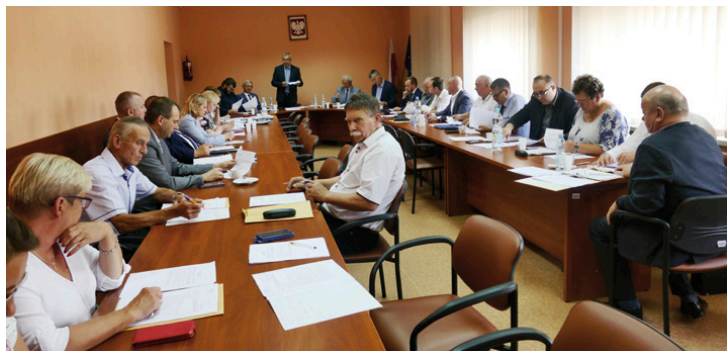
Czerwcowca sesja absolutoryjna

Wójt podziękował także za współpracę radnym oraz sołtysom, podkreślając, że bez tego niemożliwa byłaby realizacja wielu przedsięwzięć. ■ (nieb.)