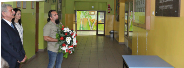
Uczestnicy Turnieju Szachowego im. Józefa Mazgaja każdego roku składają kwiaty pod tablicą pamiątkową ku czci patrona

sztabu Komendy Rejonu Zachodniego AK, obejmującego tereny gmin: Mniów, Łopuszno, Niewachłów, Snochowice, Piekoszów, Zajączków, Korzeczek i miasto Chęciny) ale wiadomość tą trudno zweryfikować.