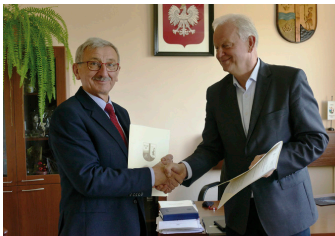
Podpisanie umowy na wymianę oświetlenia ulicznego

– Rozpoczynamy kolejne ważne inwestycje w gminie Miedziana Góra, która – obrazowo mówiąc – od listopada rozbliśnie nowym blaskiem, a wszystko to dzięki kompleksowej wymianie oświetlenia na nowoczesne, ledowe – mówi wójt