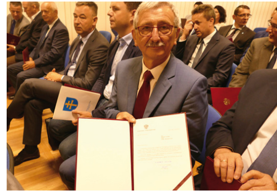
Mieszkańców ul. Wyrowce ucieszy wiadomość o dotacji na remont nawierzchni i budowę chodnika

Całkowity koszt przebudowy ul. Wyrowce to po-