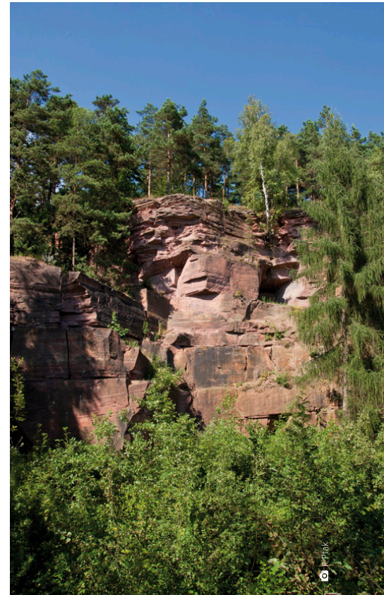
Góra Ciosowa zaliczana jest do największych atrakcji regionu

Nie bez znaczenia jest fakt, iż obszar gminy charakteryzuje się dużym zróżnicowaniem rzeźby terenu, występują tu wzniesienia na przemian z dolinami. Wzniesienia w rejonie Miedzianej Góry tworzą pasmo Bukowej Góry oraz Góry Kamień (400 m. n.p.m.). Okolice Tumlina-Wyknia i Tumlina-Podgrodzia to wzniesienia osiągające wysokość 397 m n.p.m. Północną część gminy stanowi wzniesienie podłużne o wysokości ponad 400 m n.p.m., po którego południowej stronie rozciąga się rozległa dolina rzeki Bobrzy. Południowo