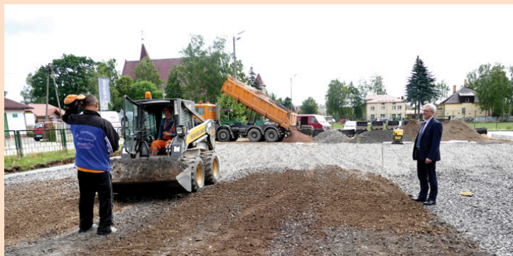
Trwają prace przy budowie boiska w Kostomłotach Drugich

– Całkowita wartość projektu to 969 tys. zł, unijne wsparcie wyniosło 726 tys. zł – mówi wójt gminy Miedziana Góra – Zdzisław Wrzałka. – To dofinansowanie pozwoli na realizację zadań