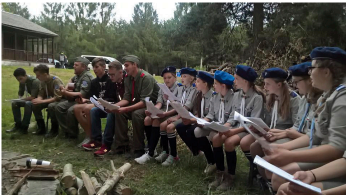
Podczas biwaku nie zabrakło spotkań przy ognisku

Napisać projekty i wygrali granty na ich realizację. Młodzież z gminy Miedziana Góra pokazała, jak skutecznie działać dla społeczności lokalnej.