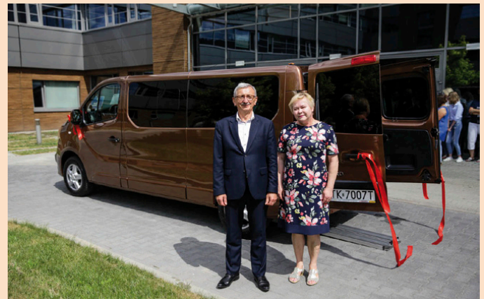
To auto służyć będzie niepełnosprawnym mieszkańcom gminy