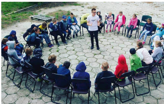
Dzieciaki z „Plusika” uczyły się zdrowego odżywiania

Innym pomysłem były warsztaty kulinarne przeprowadzone przez grupę młodzieży z Miedzianej Góry, która realizuje projekt „Fit jest git”. Zajęcia odbywały się m.in. w świetlicy „Plusik” w Miedzianej Górze oraz świetlicy wiejskiej w Tumlinie. Na zajęciach młodzież przygotowywała smaczne i zdrowe posiłki, które będą łatwe do samodzielnego