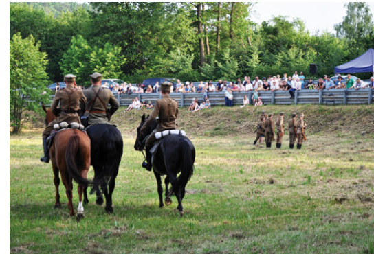
Motywem przewodnim widowiska była kawaleria

my do Bobry na rekonstrukcję wydarzeń z okresu I wojny światowej w wykonaniu Stowarzyszenia Rekonstrukcji Historycznej 4 Pułku Piechoty Legionów Kielce. Będzie można m.in. obejrzeć ostrzał