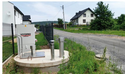
Pompownia ścieków przy ul. Cichej w Ciosowej w gminie Miedziana Góra - ETAP IV oraz rozbudowa oczyszczalni ścieków w Kostomłotach Drugich - Etap II" z Regionalnego Programu Operacyjnego Województwa Świętokrzyskiego na lata 2014-2020. ■ (nieb.)

Zadanie 2 zostało zrealizowane w ramach projektu pn. „Budowa systemu kanalizacji sanitarnej