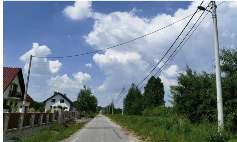
Przy ul. Spacerowej z funduszu sołeckiego zbudowano układ pomiarowy i uziemienie dla oświetlenia ulicznego

wzięcie. Pierwsze – wykonanie projektu pod budowę mostu przy ul. Kaczmarska (22 tys. 413 zł), drugie – przygotowanie projektu i budowa placu zabaw i siłowni (21 tys. 639 zł). W innych sołectwach realizowanych jest po kilka działań. Z funduszu sołeckiego doposażone zostaną jednostki OSP w Ćmińsku, Kostomłotach Drugich i Miedzianej Górze, budowane jest także oświetlenie uliczne (ulice: Jana Pawła II w Ćmińsku Kościelnym, Topolowa w