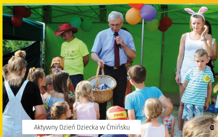
Aktywny Dzień Dziecka w Ćmińsku