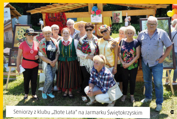
Seniorzy z klubu „Złote Lata” na Jarmarku Świętokrzyskim