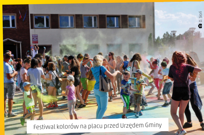
Festiwal kolorów na placu przed Urzędem Gminy