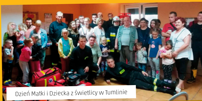
Dzień Matki i Dziecka z świetlicy w Tumlinie