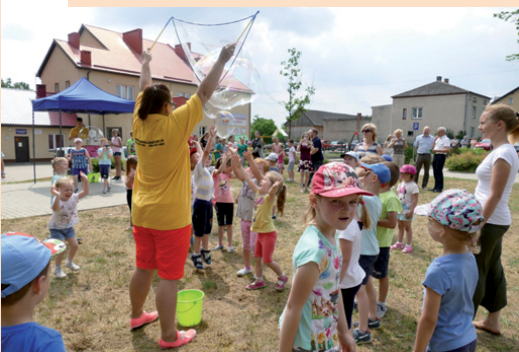
Tak bawiły się dzieci podczas festynu w Porzeczcu

Obchody Dnia Dziecka zapoczątkował „Festiwal Kolorów”, który w połowie maja odbył się na