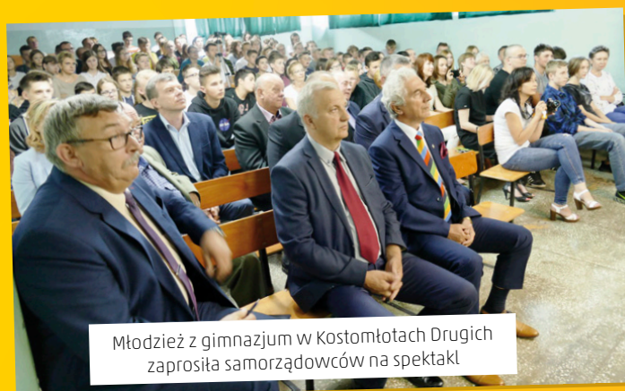
Młodzież z gimnazjum w Kostomłotach Drugich zaprosiła samorządowców na spektakl