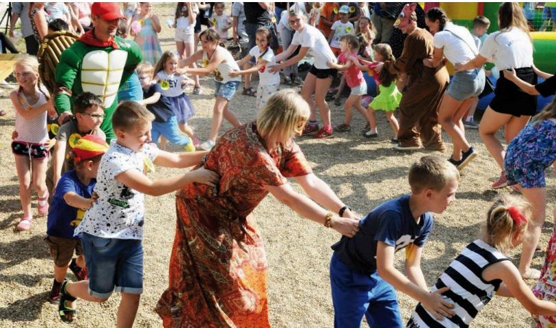
Z funduszu sołeckiego Ćmińska Rządowego współfinansowano w tym roku festyn w Dzień Dziecka

Nikt nie ma wątpliwości, że istnienie funduszu sołeckiego pobudza aktywność społeczności lokalnych i przyczynia się do ożywionych dyskusji o najpilniejszych potrzebach mieszkańców. Co najistotniejsze – na dyskusjach się nie kończy, bowiem oddanie konkretnych pieniędzy do dyspozycji społeczności lokalnych pozwala zrealizować wiele cennych inicjatyw, które poprawiają ich jakość życia, integrują, a przede wszystkim dają im poczucie tego, że w sposób bezpośredni mogą decydować o zadaniach realizowanych w ich wsi. ■