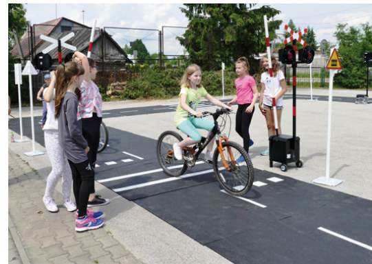
Dzieci uczą się bezpiecznego poruszania się po drodze

Warto dodać, że w ramach projektu „Rozwój infrastruktury edukacyjnej wraz z wyposażeniem na terenie Gminy Miedziana Góra” dla miedzianogórskich szkół zakupiono już wiele pomocy naukowych, m.in. modele narządów wewnętrznych człowieka, wkrótce do szkół trafi sprzęt sportowy (m.in. materace gimnastyczne, piłki, kozy i skrzynie, stoły do tenisa, rakiетки) oraz pomoce edukacyjne do zajęć z języka polskiego, biologii, fizyki oraz muzyki. Dzięki projektowi wyremontowane zostaną także łazienki szkolne, szatnie sportowe i sala gimnastyczna. Pracownie informatyczne zostaną wyposażone w nowe komputery, a sale przedmiotowe w nowe meble szkolne. Jednym z zadań uję-