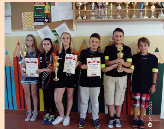
Młodzi tenisistów z Porzeczca