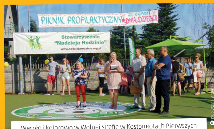
Wesoło i kolorowo w Wolnej Strefie w Kostomłotach Pierwszych