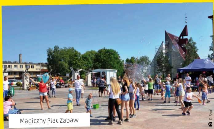
Magiczny Plac Zabaw