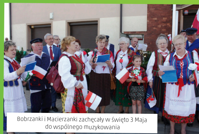
Bobrzanki i Macierzanki zachęcały w święto 3 Maja do wspólnego muzykowania