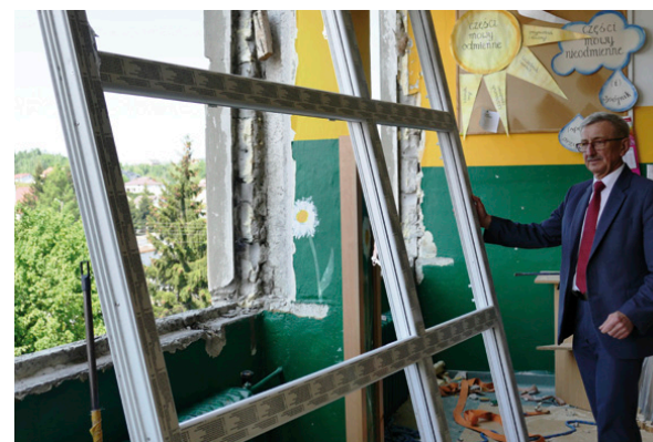
W szkole w Kostomłotach Drugich trwa wymiana stolarki okiennej

W ramach prac docieplono skosy dachu, ułożono płyty gipsowo-kartonowe, wybudowane zostały ścianki działowe, co pozwoliło uzyskać cztery po-