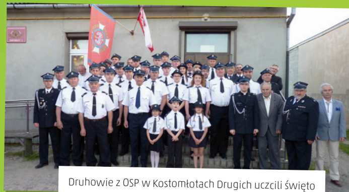
Druhowie z OSP w Kostomłotach Drugich uczcili święto swojego patrona - św. Floriana