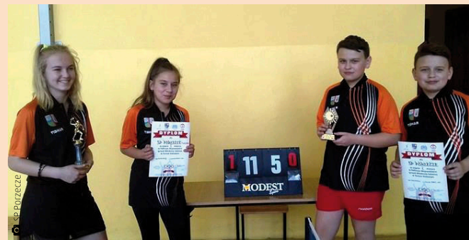
Uzdolnieni tenisiści z Porzecza