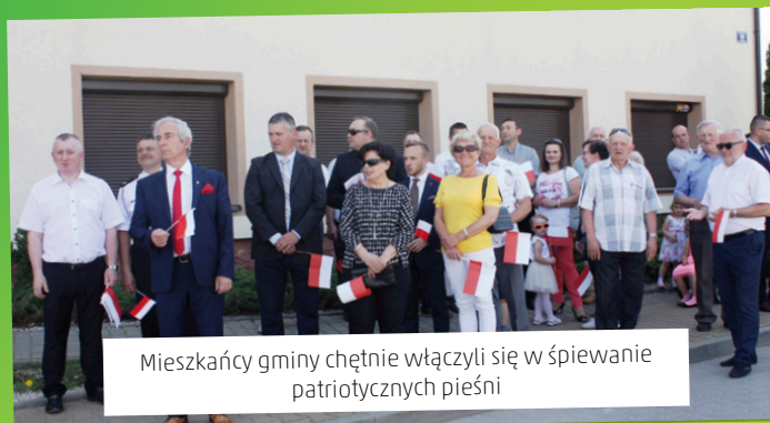
Mieszkańcy gminy chętnie włączyli się w śpiewanie patriotycznych pieśni