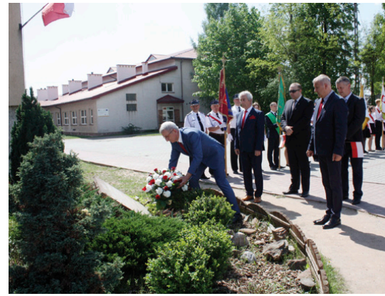
Jednym z punktów uroczystości było złożenie kwiatów pod pamiątkowym obeliskiem

Wspólne pieśniobranie zakończyło miedzianogórskie obchody 227. rocznicy uchwalenia Konstytucji 3 Maja. Okazało się, że mieszkańcy naszej gminy są niezwykle rozśpiewani.