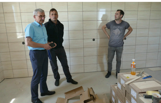
Prace remontowe w remizie OSP w Bobrzy idą bardzo sprawnie

– To dopiero początek prac remontowych. Ogromny projekt „Termomodernizacja budynków użyteczności publicznej na terenie gminy Miedziana Góra” opiewa na kwotę 9 mln 897 tys. zł, a wartość pozyskanej dotacji to 8 mln 761 tys. zł – mówi