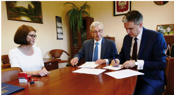
Podpisanie umowy na dofinansowanie V etapu budowy kanalizacji

– Realizacja V etapu przedsięwzięcia przyczyni się do osiągnięcia 100 proc. skanalizowania gminy – podkreśla wójt. – Ma to niebagatelne znaczenie nie tylko dla poprawy jakości życia mieszkańców, ale i ochrony środowiska naturalnego, znacznego ograniczenia odprowadzania zanieczyszczeń