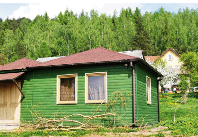
Kilka kroków od domu rozciąga się ściana lasu z kamieniołomem Ciosowa