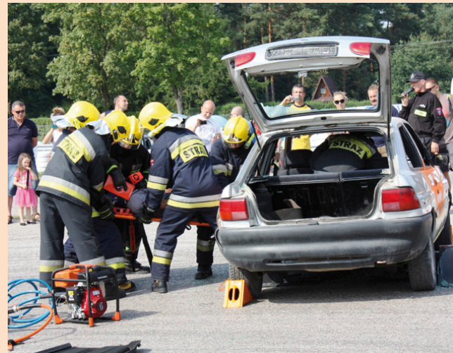
Druhowie z Ćmińska podczas pokazu ratownictwa technicznego