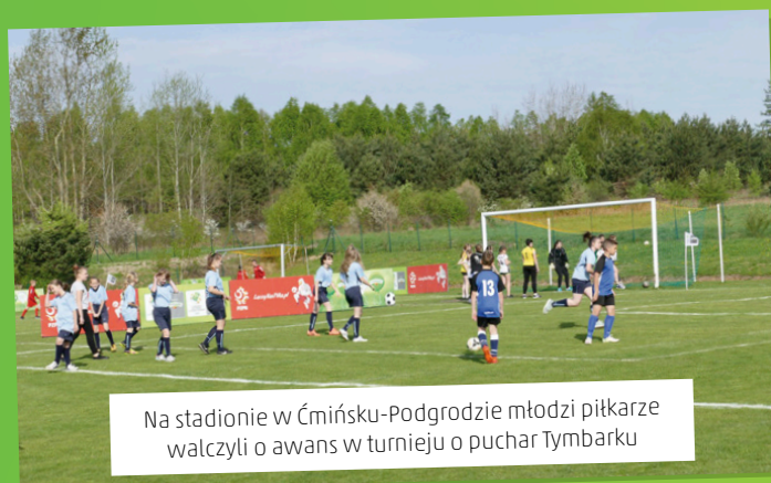
Na stadionie w Ćmińsku-Podgrodzie młodzi piłkarze walczyli o awans w turnieju o puchar Tymbarku