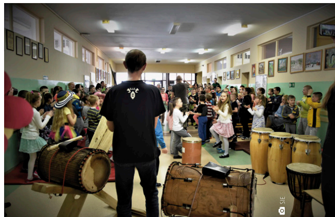
Etno-edukacja w SP w Ćmińsku

Spotkania z muzyką etno odbyły się w dwóch miedzianogórskich szkołach – w Ćmińsku oraz Kostomłotach Drugich. Było głośno, wesoło i bardzo żywiołowo. Finałowym przedsięwzięciem był „Festiwal Kolorów”, który odbył się w niedzielę, 13 maja na placu przed Urzędem Gminy w Miedzianej Górze. Do całej gamy muzycznych wrażeń dołączyły barwy, które w połączeniu z muzyką stworzyły niezwykle klimat. ■ (nieb.)