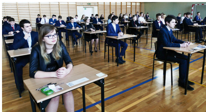
Tuż przed egzaminem w szkole w Kostomłotach Drugich

Egzaminy gimnazjalne nazywane często „małą maturą” są obowiązkowe, a dobry wynik to przepustka do wymarzonego liceum, technikum czy szkoły branżowej. Wyniki tegorocznych egzaminów gimnazjalnych zostaną ogłoszone 16 czerwca. Warto przypomnieć, że to już przedostatni taki egzamin. W przyszłym roku szkolnym – zgodnie z reformą – odbędą się ostatnie egzaminy gimnazjalne i po raz pierwszy – egzaminy ósmoklasistów. ■ (nieb.)