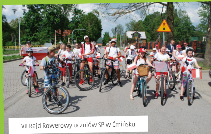
VII Rajd Rowerowy uczniów SP w Ćmińsku