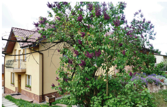
Gospodarstwo agroturystyczne skryte jest wśród bżów