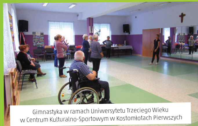
Gimnastyka w ramach Uniwersytetu Trzeciego Wieku w Centrum Kulturalno-Sportowym w Kostomłotach Pierwszych