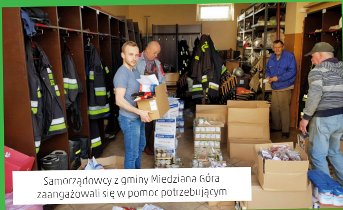
Samorządowcy z gminy Miedziana Góra zaangażowali się w pomoc potrzebującym