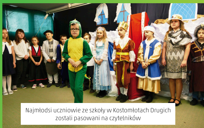
Najmłodszy uczniowie ze szkoły w Kostomłotach Drugich zostali pasowani na czytelników