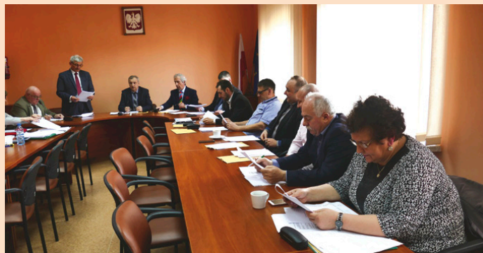
Radni wysłuchali informacji o bezpieczeństwie i działalności jednostek OSP