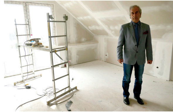
Tak poddasze w placówce w Kostomłotach Pierwszych wyglądało w połowie kwietnia. Teraz prace są na ukończeniu

Zaglądamy również do Zespołu Szkół w Kostomłotach Drugich, od którego rozpoczęła się realizacja dużego projektu termomodernizacji budynków użyteczności publicznej. W placówce trwa właśnie wymiana okien, wkrótce rozpocz-