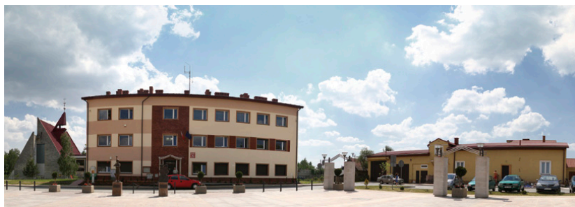
Od 1973 r. Miedziana Góra jest siedzibą gminy

Gromadzką Radę Narodową w Ćmińsku tworzyło 21 osób, a w granicach gromady znalazły się wsie Bobrza (bez osady młyńskiej Śleparnia), Ćmińsk Kościelny, Ćmińsk Rządowy, Wykień (bez Ciosowej i Ławęcznej). Natomiast miejscowości: Miedziana Góra, Kostomłoty Drugie, osada młyńska Śleparnia i wsie Ciosowa i Ławeczna utworzyły gromadę w Miedzianej Górze. Tamtejsza GRN składała się z 18 członków. Należy jeszcze wspomnieć o 17-osobowej GRN w Tumlinie, której historia była jednak bardzo krótka, bowiem została zlikwidowana w grudniu 1959 r. najprawdopodobniej z powodu zbyt małego obszaru, który zajmowała. Tereny zli-