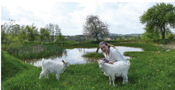
Podgórski Kącik Alicji słynie z wyrobów z koziego mleka

W „Kąciku” dla wypoczywających przygotowano 15 miejsc w pięciu pokojach. Goście przyjeżdżają tu z całej Polski, a nawet z zagranicy. Kiedyś w rejonie Ciosowej zapuścił się Japończyk, który na rowerze jechał aż z Londynu i postanowił zatrzymać się na nocleg w „Kąciku”. Bywali tu także Norwegowie, Niemcy, Czesi i Słowacy oraz mnóstwo gości z najodleglejszych zakątków Polski, których skusiły wspaniałe miedzianogórskie krajobrazy i możliwość odpoczynku z dala od zgiełku, tuż przy lesie