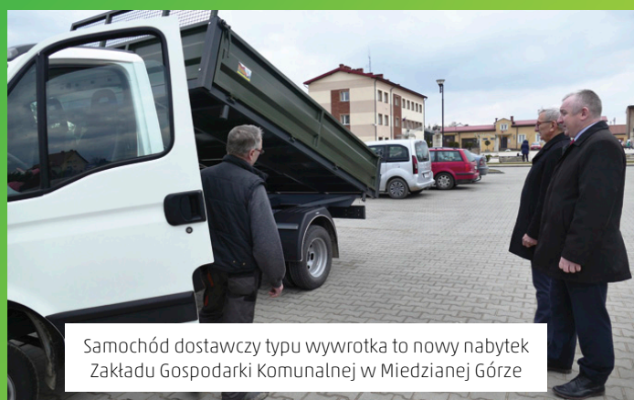
Samochód dostawczy typu wywrotka to nowy nabytek Zakładu Gospodarki Komunalnej w Miedzianej Górze