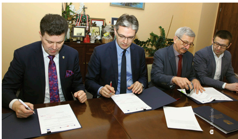
Podpisanie umowy na realizację projektu przez władarzy partnerskich gmin

zewnętrznych i zamówień publicznych Urzędu Gminy w Zagnańsku. – W przypadku gdy dany mieszkaniec nie ureguluje w ustalonym terminie należności, jego miejsce zastąpi osoba z listy rezerwowej. Tu decydować będzie kolejność złożonych wniosków. Biorąc pod uwagę krótki termin, proszę wszystkich o współpracę przy tym projekcie. Tylko dzięki wspólnemu działaniu i zaangażowaniu będziemy w stanie go zrealizować. Zgodnie z zapowiedziami planowany termin realizacji projektu to II i IV kwartał 2018 r. Warto dodać, że gmina Miedziana Góra jest jedną z 48 w województwie świętokrzyskim, które otrzymały dofinansowanie. Montaż inwestycji OZE prowadzić ma do redukcji emisji CO2 oraz co najmniej jednego z innych zanieczyszczeń powietrza, takich jak benzen, dwutlenek azotu, dwutlenek siarki czy pył za-