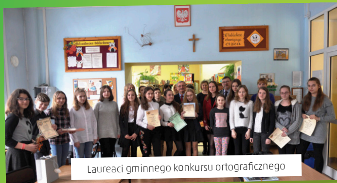
Laureaci gminnego konkursu ortograficznego