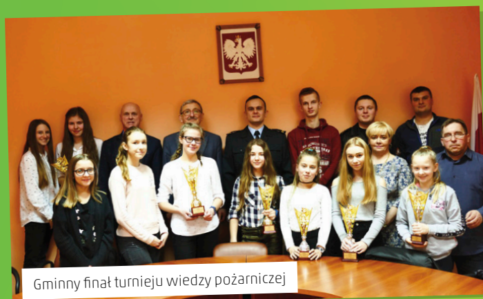
Gminny finał turnieju wiedzy pożarniczej