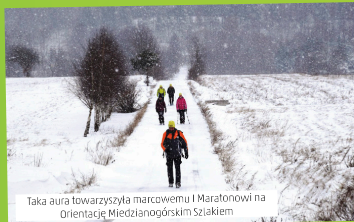
Taka aura towarzyszyła marcowemu I Maratonowi na Orientację Miedzianogórskim Szlakiem