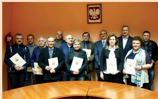
Sołtysi z gminy Miedziana Góra

Nikt nie ma wątpliwości, że sołtysi są autentycznymi reprezentantami społeczności lokalnych i głosem mieszkańców wsi. Są również waż-