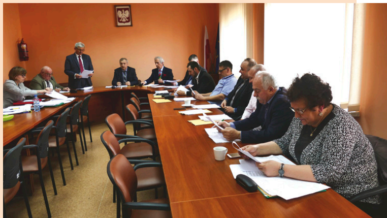
Podczas kwietniowej sesji radni przyjęli podział gminy na obwody wyborcze

oraz podjęli m.in. uchwały dotyczące opłaty targowej i nabycia działek położonych w miejscowościach Tumliń-Wykień i Ćmińsk. Pierwsza z nich