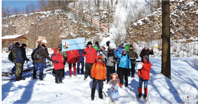
Pieszy rajd zakończył się topieniem marzanny

i Bobrzę. Na zakończenie wycieczki na piechurów czekało turystyczne ognisko, miska ciepłej stawy przygotowane przez samorząd gminy Miedziana Góra. Podczas obu imprez plenerowych o pyszne