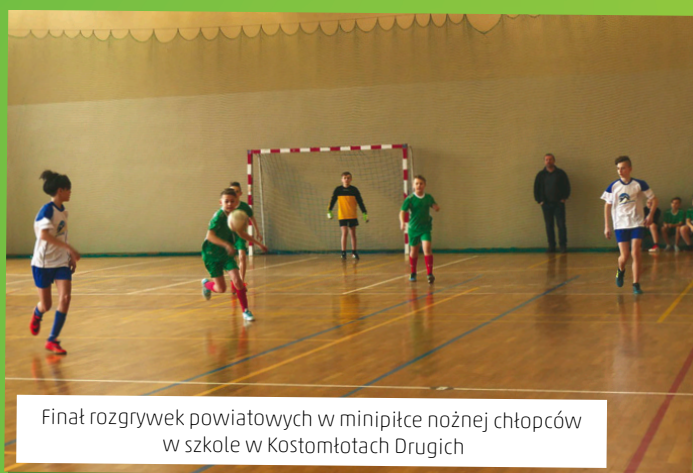
Finał rozgrywek powiatowych w minipiłce nożnej chłopców w szkole w Kostomłotach Drugich