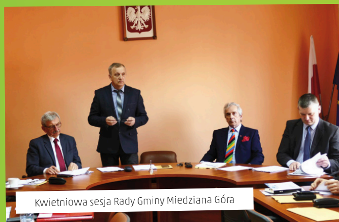
Kwietniowa sesja Rady Gminy Miedziana Góra