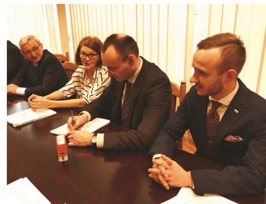
Do miedzianogórskich strażaków trafi sprzęt o wartości 85 tys. zł

Ogółem dla wszystkich działających w gminie jednostek udało się zdobyć dofinansowanie z Funduszu Sprawiedliwości w wysokości 85 tys. 338 zł. Wkład własny gminy ma wynieść 1 proc. Za pozyskane pieniądze zostaną zakupione: torba ratownicza (dla OSP w Kostomłotach Drugich), deska ortopedyczna ze stabilizacją i pasami (dla OSP w Miedzianej Górze), średni zestaw hydrauliczny z nożycorozpieraczem (dla OSP w Bobrzy) oraz uniwersalne narzędzie hydrauliczne – nożycorozpieracz z demontowanymi końcówkami rozpierający-