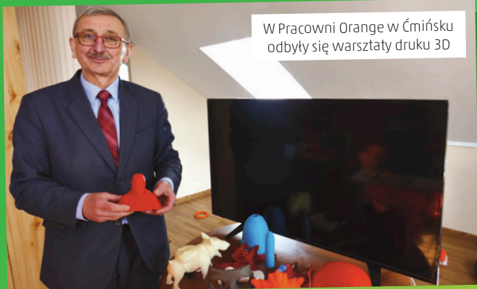
W Pracowni Orange w Ćmińsku odbyły się warsztaty druku 3D