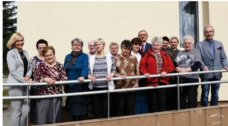
Studentzi z Kostomłotów Pierwszych

seniorzy w klubie „OdNova” w Kostomłotach Pierwszych. Teraz mamy dla nich nową propozycję – dzięki programowi Ministerstwa Nauki i Szkolnictwa Wyższego i finansowemu wsparciu tego resortu w gminie Miedziana Góra ruszy Uniwersytet Trze-