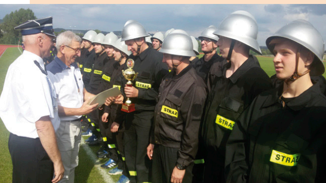
Druhowie z OSP w Miedzianej Górze podczas gminnych zawodów