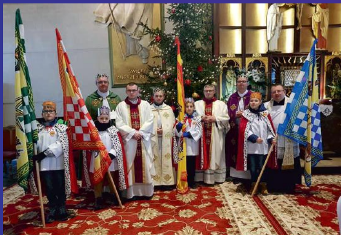
Mędrcy świata, Trzej Królowie ... w kościele pw. św. Andrzeja Boboli