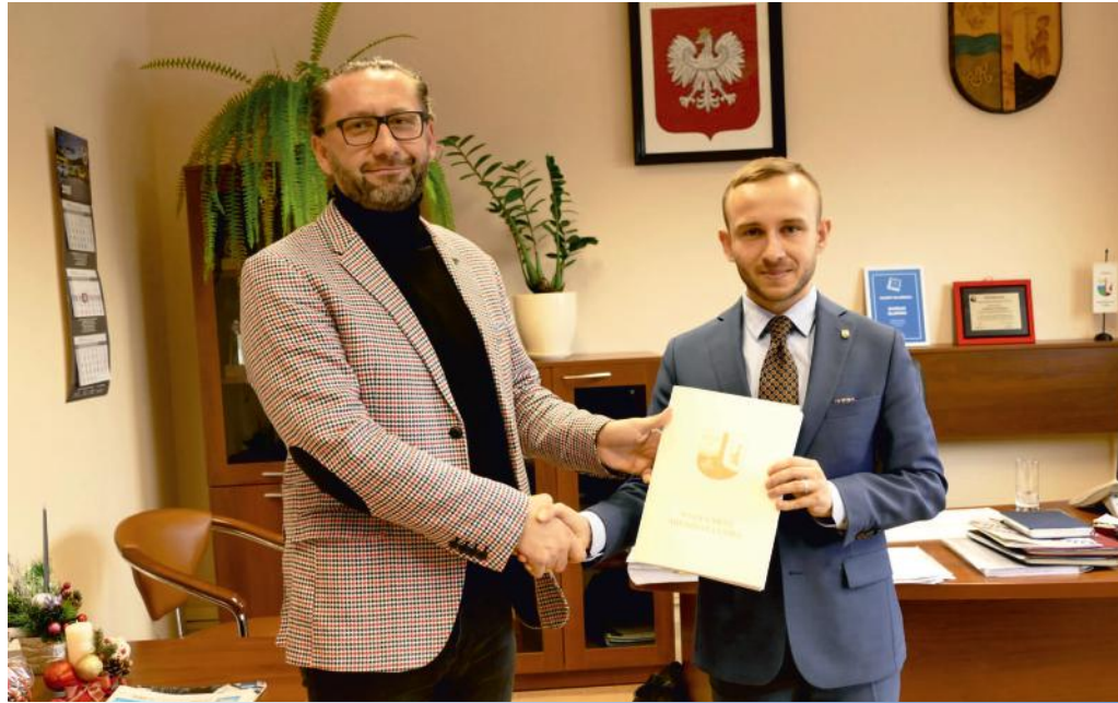
Podpisanie umowy na budowę dwóch placów zabaw

Drugi obiekt powstanie na terenie parku wiejskiego przy ul. Ślefnia w Ciosowej. Mieszkańcy będą mogli skorzystać z siłowni plenerowej, w skład której wejdzie sześć urządzeń (orbitek, biegacz wolnostojący, koło i kierownice Tai Chi, wioślarz wolnostojący, wahadło i Twister oraz wyciąg górny). Plac zabaw zostanie również wyposażony w pięć urządzeń dla dzieci o charakterze sprawnościowym (zestaw sprawnościowy, huśtawkę bocianie gniazdo, kids rowerek i stepper, kids koła oraz kids kręciołek). Na placu pojawią się także urządzenia do gier edukacyjnych i ławki.