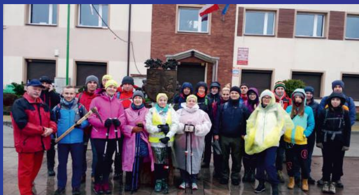
W strugach deszczu, ale z werwą uczestnicy Rajdu Barbórkowego przemierzali 13 km