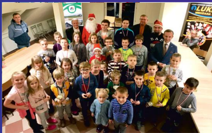
Uczestnicy I Mikołajkowego Turnieju Szachowego o Puchar Wójta Miedzianej Góry