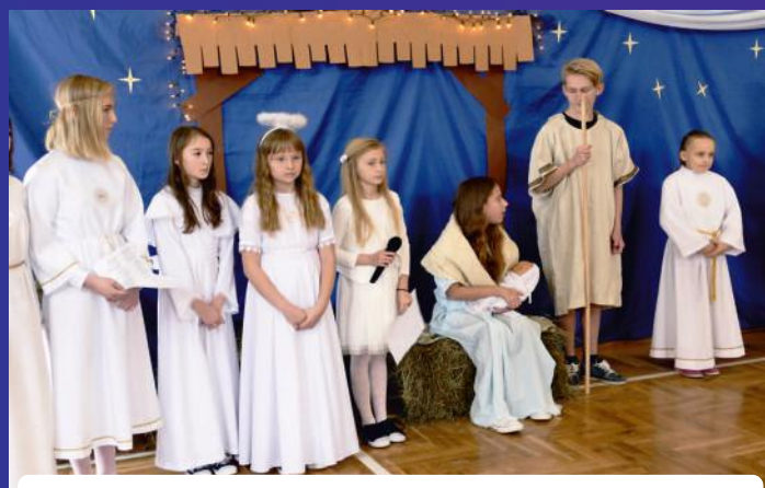
Jasełka w Szkole Podstawowej w Porzeczcu