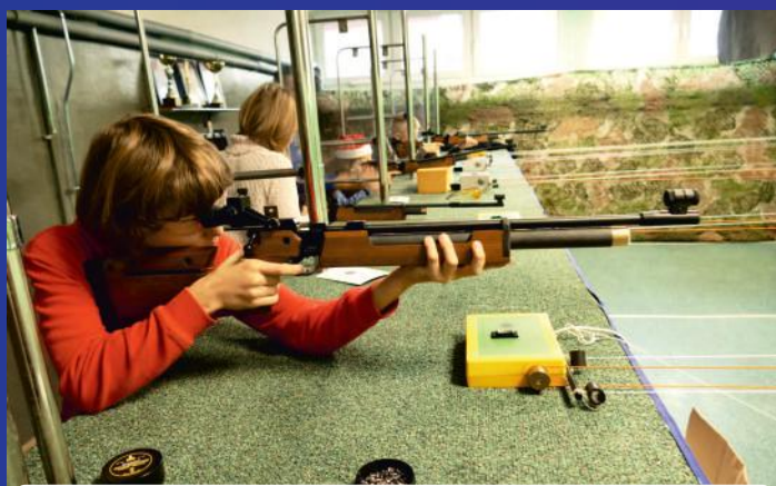
Do celu. Mikołajkowy turniej strzelecki w szkole w Kostomłotach Drugich