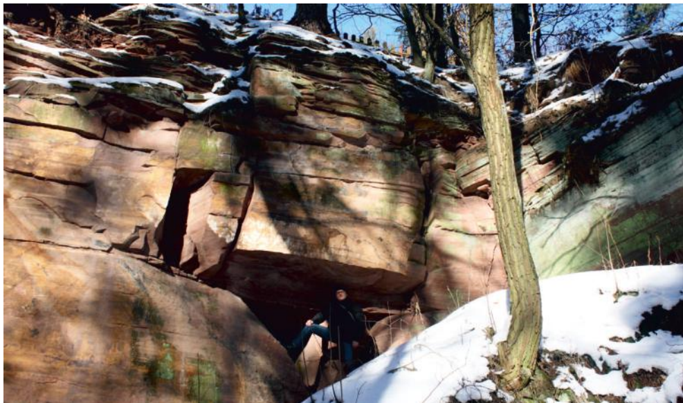
Atrakcją Kamiennych Kręgów są skalne wychodnie

Góra Grodowa była również świadkiem wydarzeń związanych z potopem szwedzkim - w połowie XVII w. dzielnie broniły się tu wojska polskie. Legenda głosi, że gdy Polakom zabrakło już amunicji, zaczęli strzelać do wroga z ... kaszy, a Szwedzi miast wyśmiać tak nikczemną amunicję, odstąpili od oblężenia góry. Dlaczego? Ponoć doszli do wniosku, że skoro Polakom nie szkoda kaszy, to pewnie mają ją w bród jedzenia i jeszcze długo będą się