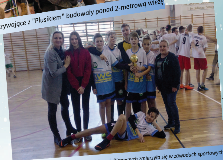
Młodzież z Wolnej Strefy w Kostomłotach Pierwszych zmierzyła się w zawodach sportowych