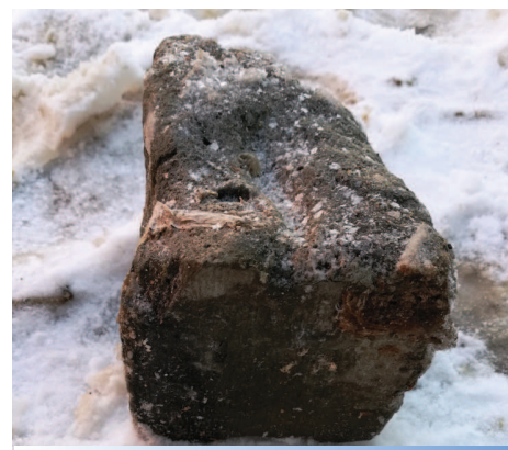
Pustak wyciągnięty z kanału

Czy problem zanieczyszczania studzienek kanalizacyjnych da się rozwiązać? Trzeba zmienić nastawienie mieszkańców i uświadomić im, jakie spustoszenie, także dla środowiska, powoduje traktowanie kanalizacji jak śmietnika. Jest też argument ekonomiczny – naprawy sieci powodują wzrost kosztów jej eksploatacji, co ma bezpośredni wpływ na stawki usług świadczonych przez ZGK. (nieb.)