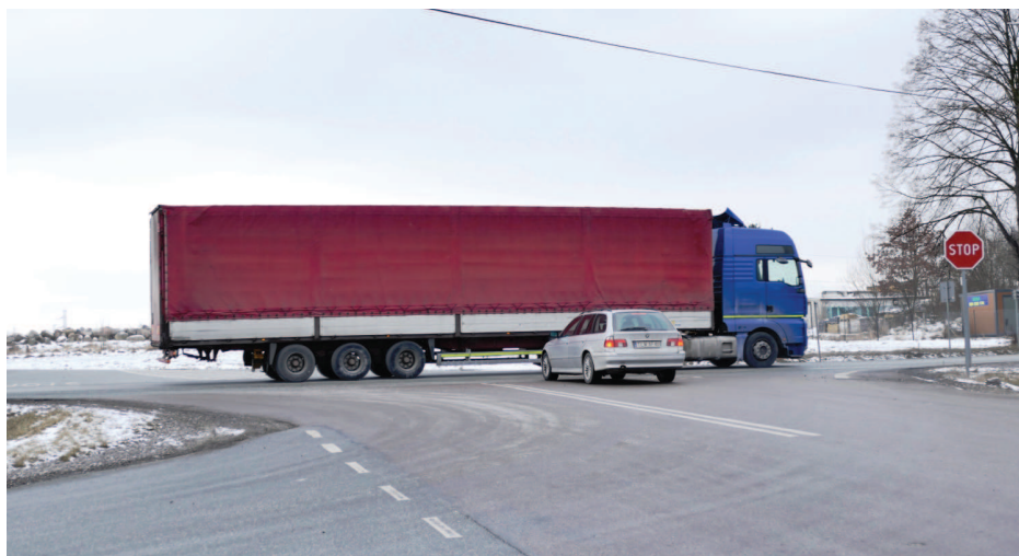
W tym miejscu powstanie rondo

Czwarty lewoskręt powstanie przy skrzyżowaniu z ulicą Malachitową w Miedzianej Górze. Wydzielenie dodatkowych pasów ruchu dla aut, które z drogi głównej chcą skręcić w ulice lokalne z pewnością ułatwi wykonanie manewru i wpłynie na płynność ruchu. (nieb.)