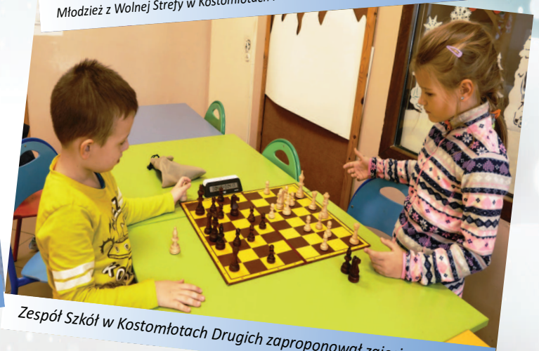
Zespół Szkół w Kostomłotach Drugich zaproponował zajęcia szachowe