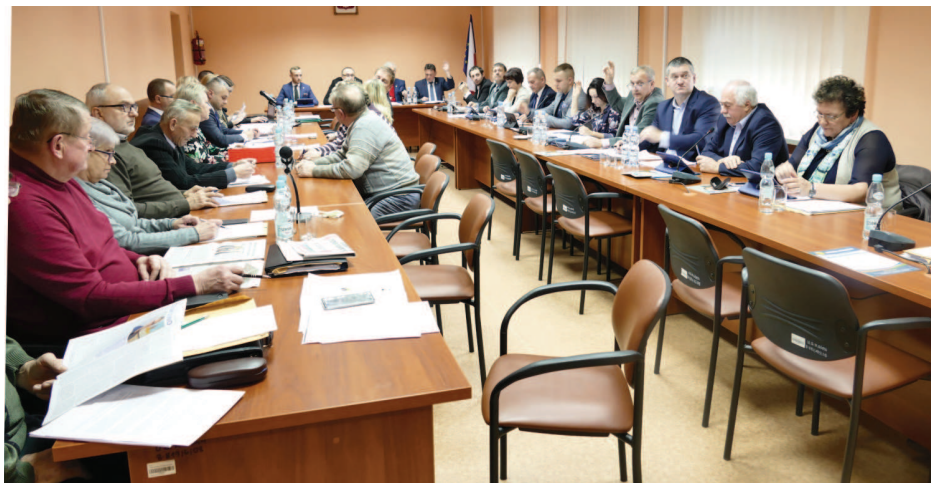
Radni gminy podczas sesji

Podczas sesji radni jednogłośnie przyjęli budżet gminy na 2019 r. (szerzej na ten temat piszemy na str. 3). Radni przyjęli także uchwały dotyczące m.in. przystąpienia gminy do projektu pozakonkursowego pn. „Centrum usług – współpraca na rzecz społeczności lokalnej” współfinansowanego z RPO WŚ. Podczas sesji podjęto uchwały w sprawie wyrażenia zgody na: użyczenie nieruchomości w miejscowości Tumlin Wykień stanowiącej własność gminy, wydzierżawienie nieruchomości w Kostomłotach Pierwszych oraz ustanowienie służebności gruntowej na działce w Kostomłotach Pierwszych. Radni wyrazili również zgodę na nabycie nieruchomości w Kostomłotach Pierwszych, która niezbędna jest do przebudowy drogi lokalnej oraz odwołali i jednocześnie powołali Rady Społeczne przy samorządowych ośrodkach zdrowia w Miedzianej Górze oraz w Ćmińsku, dokonali także zmian w statucie Rady Seniorów Gminy Miedziana Góra wydłużając jej kadencję do pięciu lat.