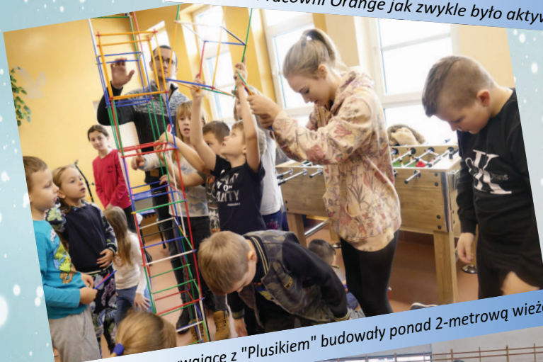
Dzieciaki odpoczywające z "Plusikiem" budowały ponad 2-metrową wieżę